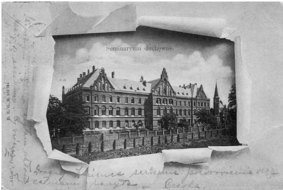
Il. 1. Poznańska widokówka z motywem rozdartej koperty z około 1900 roku

Ten ikonograficzny koncept pojawił się też na innych kartkach, mianowicie na widokówkach z winietą w formie strony tytułowej gazety. Pierwotna gra znaczeń gdzieś uleciała, pozostał jedynie motyw rozdartej karty z której wyłania się widok miasta, miejsca, gmachu. W Poznaniu takich kart pocztowych ukazało się co najmniej kilka, ale – co równie interesujące – zostały też wydane dla innych miejscowości wielkopolskich, oczywiście tylko tych, które miały własne, lokalne tytuły prasowe.