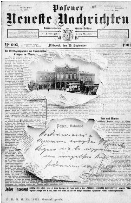
Il. 3. Reklamowa kartka pocztowa z motywem rozdartej gazety „Posener Neueste Nachrichten” z 1901 roku