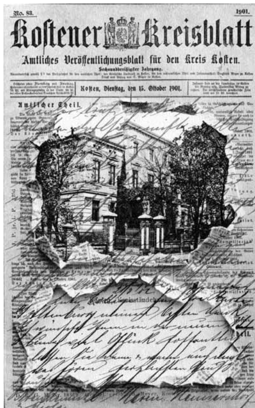
Il. 2. Reklamowa kartka pocztowa z motywem rozdartej gazety „ Kostener Kreisblatt ” z 1901 roku

Z tego samego mniej więcej czasu co pocztówka jarocińska pochodzi kartka z Kościana: Kosten. Kreisständehaus z winietą czasopisma „ Kostener Kreisblatt. Amtliches Veröffentlichungsblatt für den Kreis Kosten ” z 15 października 1901 roku 6 , również wydana przez lokalnego nakładcę, S. Meyera (il. 2). Kartka ta chroniona jest opatentowanym wzorem D.G.R.M. [nr] 18912 i na marginesie opatrzona sygnaturą drukarza „J. P. jr. i. P. 1256”.