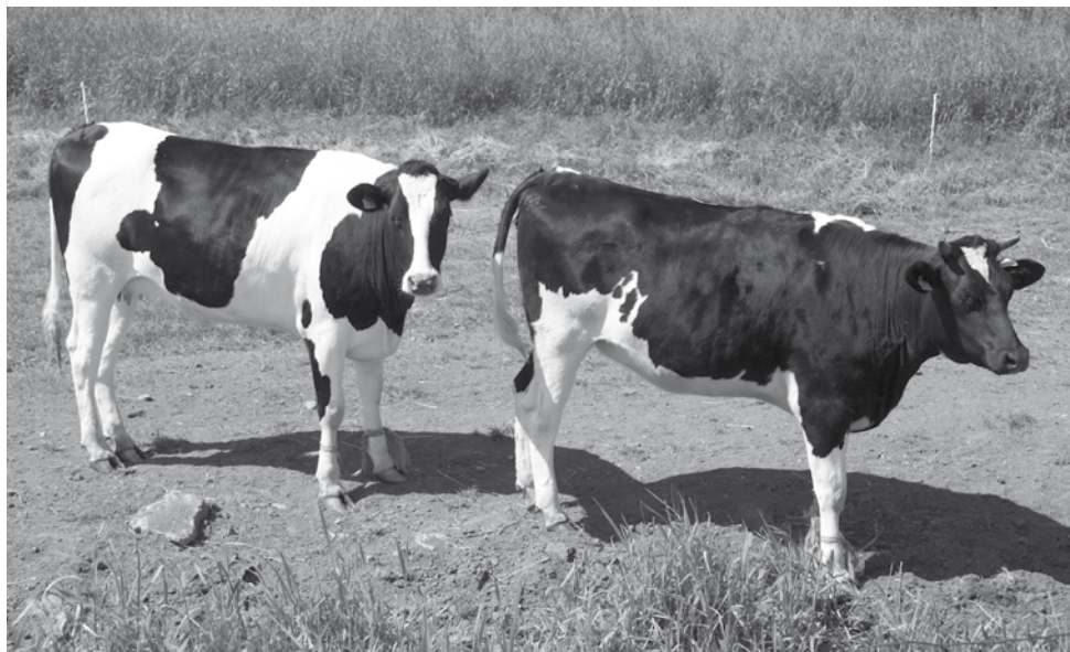
Żuławskie krowy przy drodze z Nowego Dworu Gdańskiego do Cyganuka; fot. A. W. Brzezińska, 2008 r.

Nasze badania to udokumentowanie pewnego stanu kultury regionalnej w latach 2008–2011. Niektóre stwierdzenia zawarte w podsumowaniach badań mogą już być nieaktualne i to dobrze, świadczą bowiem o tym, że żuławska kul-