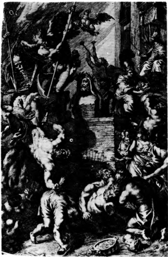
3. Frontispis J. v. Sandrarta, Iconologia Deorum . Oder Abbildung der Götter. Nürnberg 1680