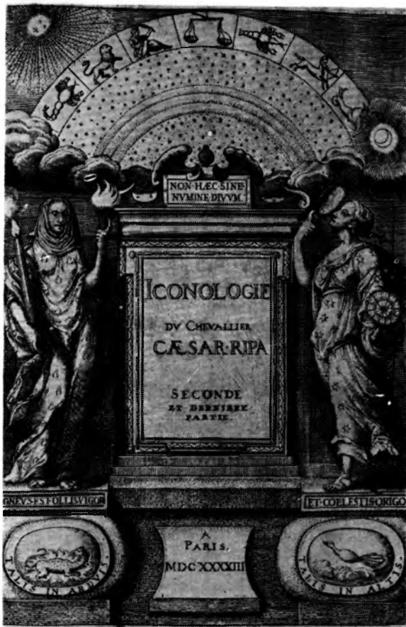
2. Jacques de Bie, Frontispis drugiej części Iconologie, ou explication nouvelle de plusieurs images, emblemes, et autres figures... tirées de Cesar Ripa, moralisées par I. Baudoin