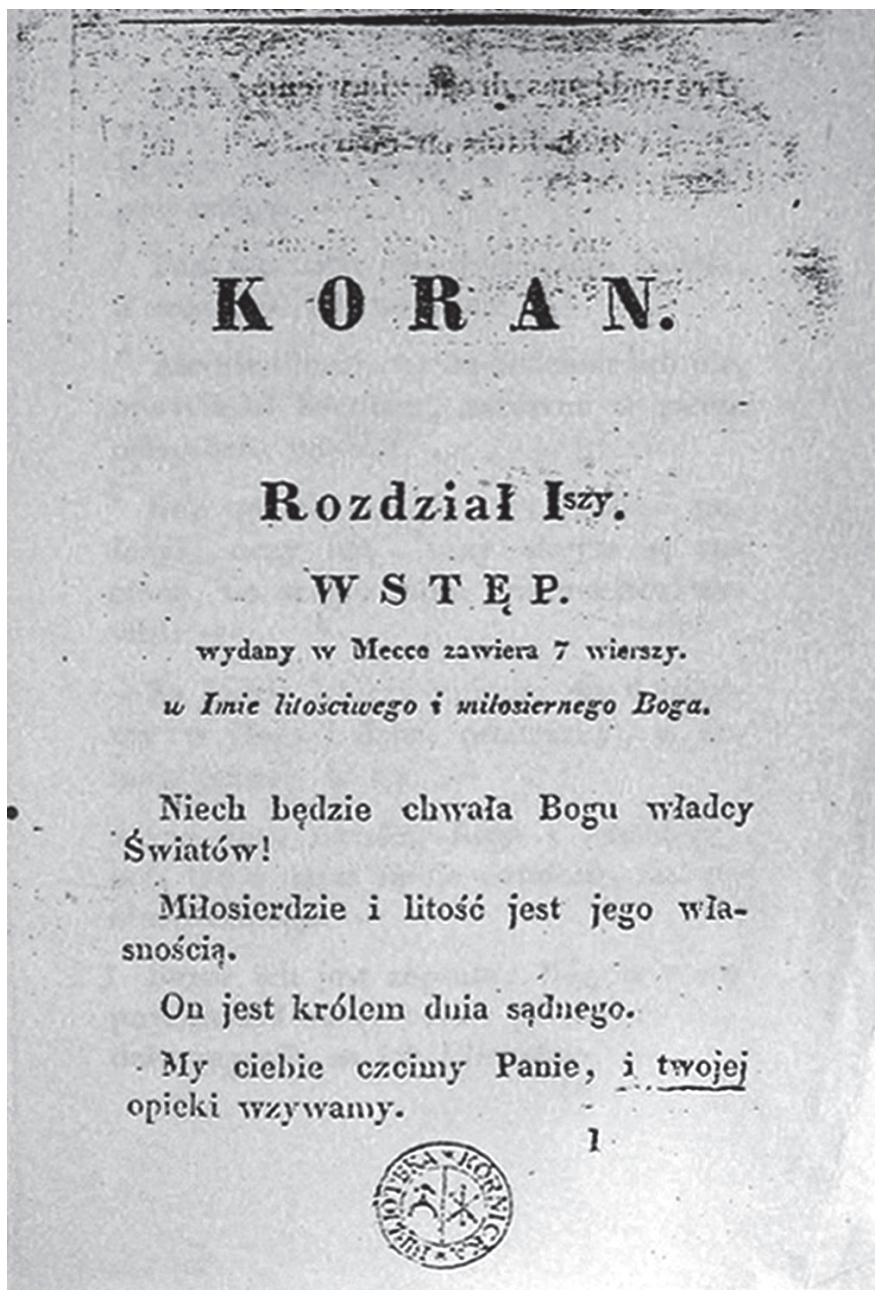
Fot. 3. Pierwsza strona polskiego przekładu Koranu autorstwa wileńskich filomatów z drukarni Potockiego w Poznaniu; zawiera fragment (cztery ajaty, czyli wiersze) sury 1, Otwierającej, tu zatytułowanej Wstęp (na podst. egzemplarza z Biblioteki PAN w Kórniku)