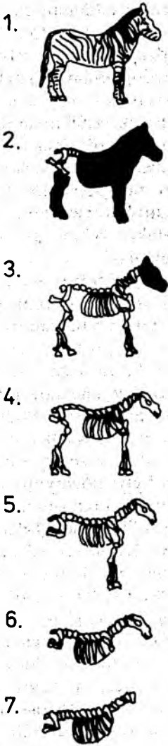
Rys. 1. Siedem faz konsumowania padliny zobrazanych na przykładzie ciała zebry. Objedzony z mięsa szkielet, odpowiadający etapowi czwartemu i następnym, jest nadal atrakcyjny jako źródło pokarmu jedynie dla hien oraz dla posługujących się narzędziami człowiekowatych. Potrafią wykorzystać „zamknięte” w kościach długich i czaszce szpik oraz mózg – tkanki obfitujące w cenne związki fosforu. Wschodnioafrykańskie stanowiska archeologiczne FLK Zinjanthropus, datowane na ok. 2 mln lat, potwierdzają powyższe przypuszczenie: znaleziono tam liczne kości długie i czaszki roślinożernych zwierząt sawannowych ze śladami obróbki prymitywnymi narzędziami

ne). Penetrując codziennie swoje otoczenie hominidy łatwo mogły rozeczać się w zwyczajach drapieżników i wykorzystywać pozostawione resztki dla własnych potrzeb. Zachowania takie mogły być tym bardziej opłacalne, że wysuszona sawanna nie oferowała wówczas konkurencyjnego pożywienia, toteż nawet obgryzione z mięsa kości i czaszki dostarczały satysfakcjonującą ilość pokarmu, jaki stanowił zamknięty w nich, wysokokaloryczny i cenny pod względem zawartości fosforu, mózg i szpik kostny. Sama metoda wydobywania ich z „zamknięcia”, z użyciem najprostszych tłuków kamiennych, nie była tak energochłonna i czasochłonna, jak wyszukiwanie i zbieranie pokarmu roślinnego. Atutem wzmacniającym strategię „specyficznego padlinożercy” było prawdopodobnie okazjonalne odnajdywanie całego, nie naruszonego zębem drapieżcy, martwego zwierzęcia, ponieważ w zwyczaju wielkich mięsożerców jest pozostawianie na jakiś czas zdobyczy w stanie nietkniętym; czasami też po prostu przypadek sprawiał, że hominidy jako pierwsze odnajdywały padłe z głodu czy pragnienia zwierzę.