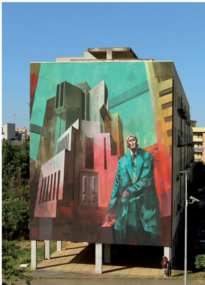
Sepe, The Trial of Joseph K. , Fondi 2016

środowiska, trzeba uwzględnić kontekst urbanistyczny, społeczny i kulturowy danego fragmentu przestrzeni miejskiej oraz postrzegać w jego ramach aktywną, zaangażowaną, sensualnie receptywną osobę. Jest to podejście odpowiednie do dokonywania analiz z perspektywy twórców obrazów i ich odbiorców.