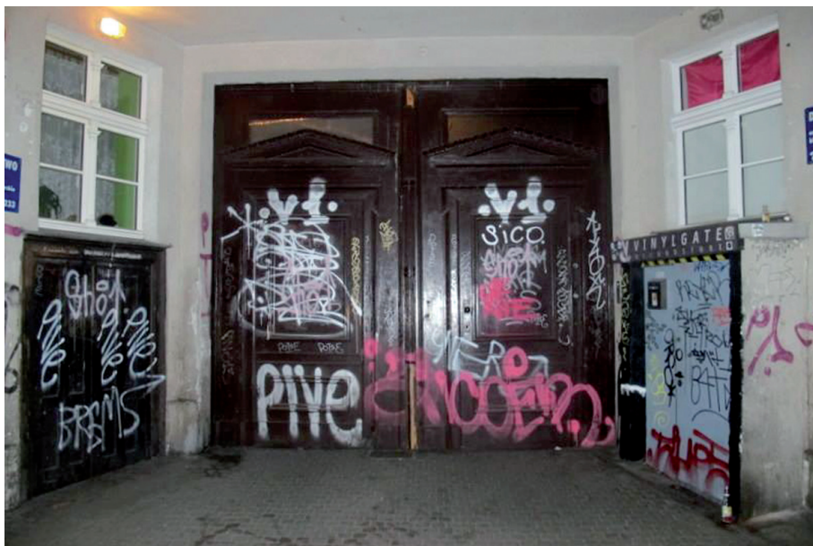
Fot. Karolina Dryps, Poznań 2015

Wandalizm jest zatem obszarem, w którym podobnie jak w graffiti realizuje się estetyczne zaangażowanie w tkankę miejską i estetyczne doświadczenie przestrzeni miejskiej, przekraczające granice tradycyjnych pojęć piękna, wzniosłości, subtelności, symetrii czy harmonii, ponieważ każdy obiekt i każdy obraz na budynkach