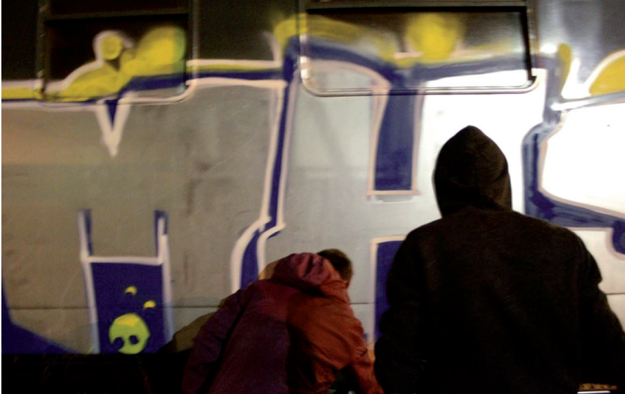
Krazz86, Regional train, Szczecin 2014