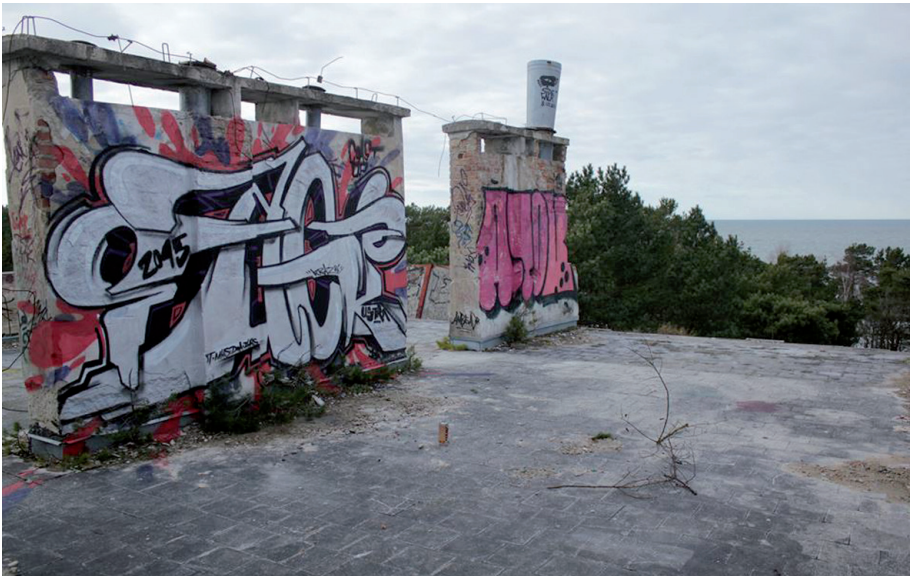
Krazz86, Ustka 2014

niczo odmienny jest, jeśli osoba postrzegająca jest stamtąd, co nie znaczy, że sama maluje, ale odczuwa daną przestrzeń jako przestrzeń zamieszkiwania, udomowioną, ze znanymi (mniej lub bardziej) innymi ją zamieszkującymi.