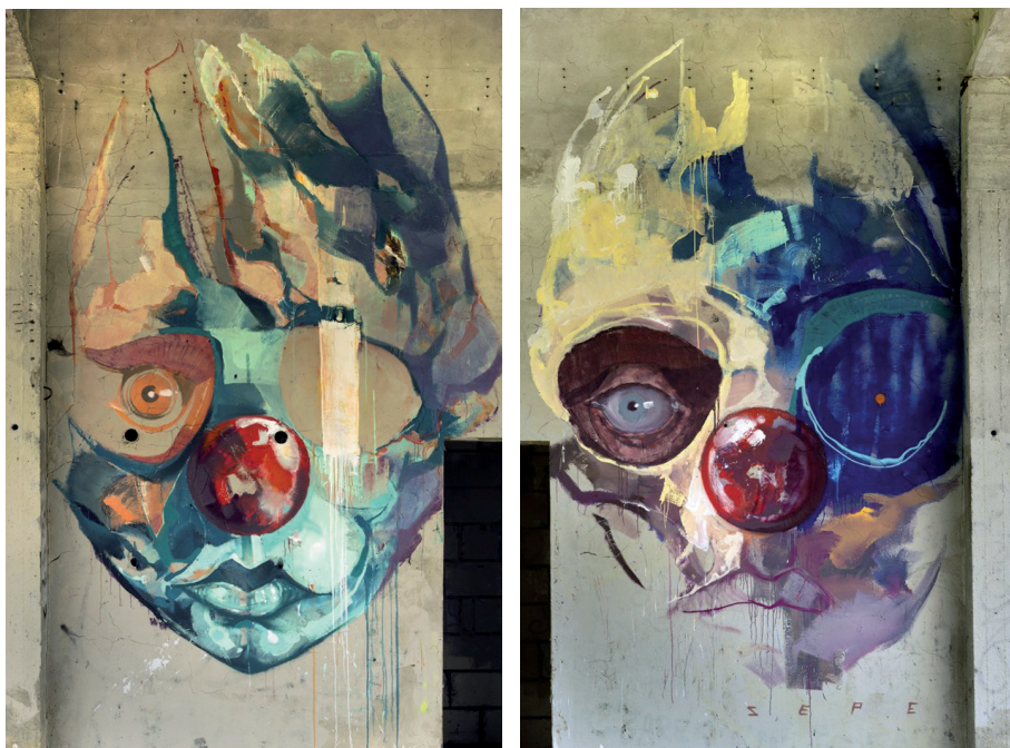
Sepe, The Further You Go... , Warszawa 2015

malując, nie należy zasłaniać twarzy kominiarką, ponieważ można być skazanym jako terrorysta, zaś samo malowanie jest traktowane jako wykroczenie karane grzywną w wysokości kilkuset rubli; Papis 2015: 9), jest nieodłącznie związane z odczuciem adrenaliny – stresu, lęku, mobilizacji, szybkiego i zdecydowanego działania, świadomego swoich możliwych konsekwencji. Mam tu na myśli przede wszystkim street-bomberów tagujących, tj. zostawiających swoje estetycznie opracowane podpisy na ścianach miast, oraz writerów malujących rooftopy, tj. ściany bezpośrednio pod dachami budynków, i pociągi metra w wielu krajach świata. Nie można odbierać tych obrazów tylko z perspektywy ich powierzchniowej, wizualnej estetyki, choć ona także odgrywa istotną rolę. Konieczne jest uwzględnienie cielesnego zaangażowania jako takiego, które zawiera komponent wizualny, emocjonalny, ale też nastawiony na zmianę pewnej przestrzeni, pewnego środowiska miejskiego, wykonywanej fizycznie, z adrenaliną, potem, zapachem farby i ulic miejskich nocą.