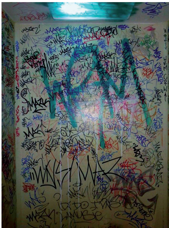
Fot. Karolina Dryps, Bytom 2014

emituje pewnego rodzaju energię w otaczającej go przestrzeni, a ta aura wpływa na osoby w jego sąsiedztwie. Znaki, ślady, podpisy, napisy, formy nie tylko powinny sprawiać nam estetyczną, wizualną przyjemność, ale mogą także zaburzać nasze codzienne postrzeganie miasta jako tworu odpowiednio – również pod względem estetycznym – zarządzanego, może wywoływać spokój lub niepokój, dawać poczucie bezpieczeństwa lub opresji, zapraszać lub odstraszać, odpowiadać naszym oczekiwaniom lub onieśmiać.