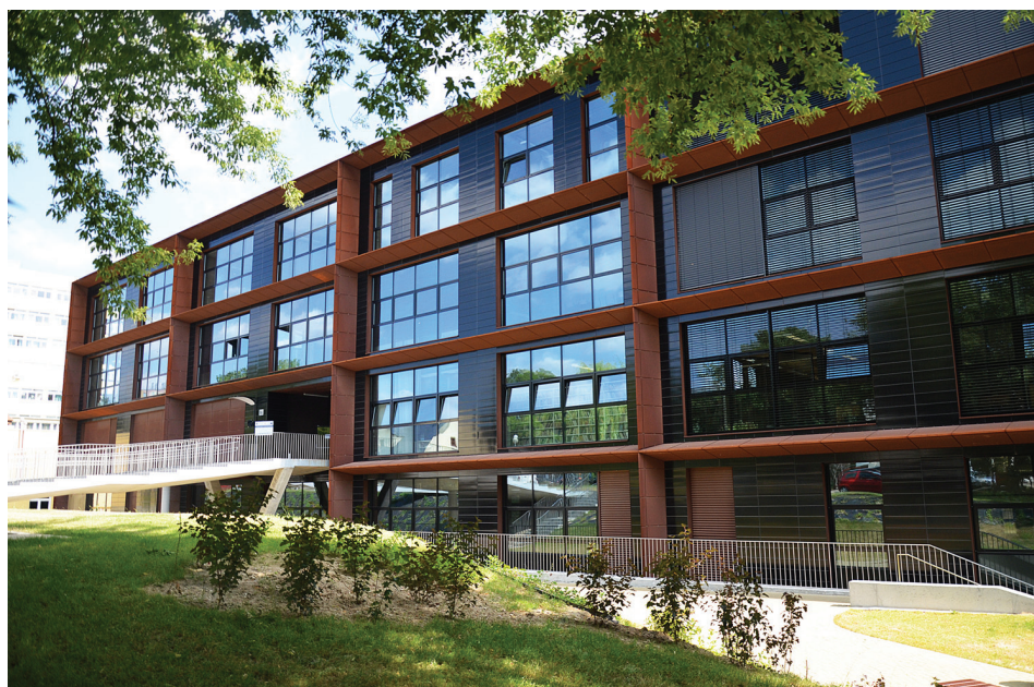
Il. 1. Budynek Centrum Innowacji i Zaawansowanych Technologii PL.