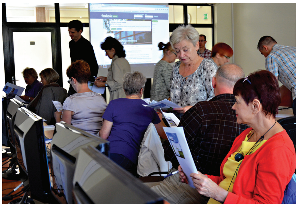
Il. 7. Lubelski Festiwal Nauki – warsztaty Senior na czasie – jak być w stałym kontakcie z bliskimi .

promocyjnych, takich jak „Zabierz książkę na wakacje” oraz informowanie o nowościach przez plakaty, kontakt z uczelnianymi mediami, stroną WWW biblioteki i social media owocują coraz większym zainteresowaniem i liczbą wypożyczeń oraz propozycjami nowych zakupów. W formie daru przyjmowane są polskie i zagraniczne książki beletrystyczne, a ich liczba, głównie dzięki pracownikom, stale rośnie. Kolekcję czasopism wzbogaciliśmy o prasę społeczno-polityczną („Newsweek”, „wSieci”, „Polityka”, „Wprost”), kulturalną („Nowe Książki”), psychologiczną („Charaktery”), popularnonaukową („Focus”), kobiecą („Zwierciadło”, „Twój Styl”), podróżniczą („National Geographic”), hobbystyczną („Masterclass Fotografia”, „Moje Mieszkanie”, „Nowa Fantastyka”), komputerową („PC Format”) oraz jeden tytuł anglojęzyczny („Scientific American”). W zależności od indywidualnych potrzeb i upodobań każdy znajdzie coś dla siebie.