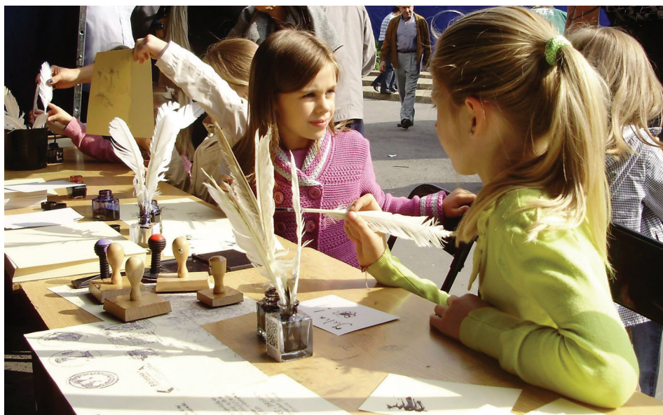
Il. 6. Lubelski Festiwal Nauki.

pozytywnym odbiorem i sukcesem, na tegoroczną edycję przygotowaliśmy jego kontynuację – Senior w labiryncie informacji . W 2016 roku z naszą ofertą odwiedziliśmy również V Festiwal Nauki w Muzeum Przyrody i Techniki na terenie dawnej huty żelaza i fabryki samochodów w Starachowicach.