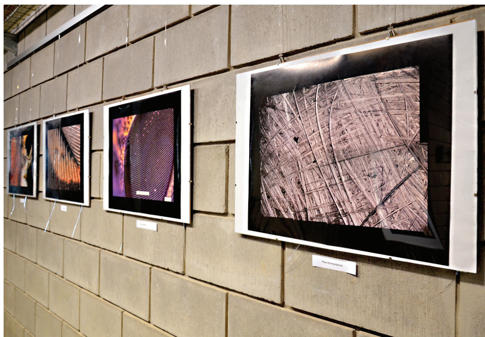
Il. 2. Galeria Biblioteki PL – Mikrowystawa.