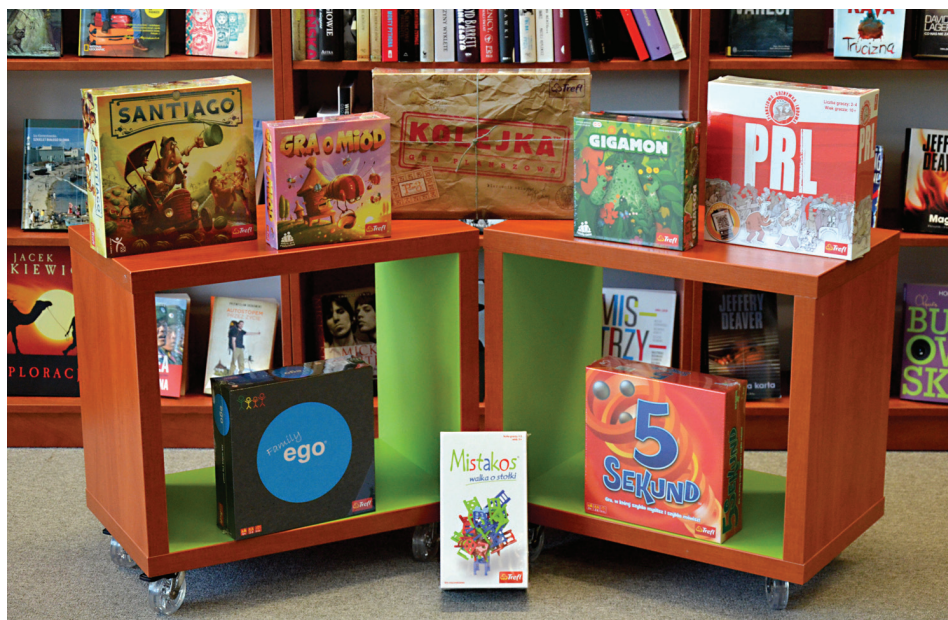
Il. 10. Kącik gier planszowych w Czytelnii Ośrodka Informacji Naukowo-Technicznej.

udział biblioteki ograniczał się do udostępniania pomieszczeń. Wraz z rozbudowaniem oferty o gry pojawiła się szansa na szerszą współpracę. Jej efektem jest wybór typów gier i poszczególnych tytułów, którymi warto zasilić kolekcję, a także organizowanie wspólnych wydarzeń (pierwsze popołudnie z grami – listopad 2017 roku). Liczymy, że nie będzie ono odosobnione, a cykliczne popołudnia z grami na stałe wpiszą się w kalendarz Biblioteki PL. W poszukiwaniu partnerów i sponsorów tej inicjatywy wyszliśmy poza obręb kampusu. Od jednej z przodujących firm na rynku otrzymaliśmy pakiet gier na start (il. 10). Resztę zakupów planujemy sfinansować ze środków własnych. Na początek chcielibyśmy zaproponować kilka tytułów gier: klasycznych (chińczyk, szachy, warcaby), ekonomicznych i strategicznych ( Splendor , Santiago ), logicznych ( Abalone , Logix , Scrabble ) oraz szybkich karcianych ( Munchkin , Red7 , Uno ). Liczymy, że trafią one w gusta i zainteresowania osób odwiedzających Czytelnię OINT oraz przyciągną także tych, którzy nie zagląдают do nas regularnie. Inicjatywa ta ponadto będzie stanowić szansę na poznanie biblioteki jako miejsca integracji środowiska akademickiego, a bibliotekarzy jako gospodarzy. Nie można zapomnieć o korzyściach, jakie użytkownikom może przynieść obcowanie z grami. Dziś, w warunkach dominacji kultury audiowizualnej gra planszowa ma do spełnienia doniosłą funkcję: ćwiczy pamięć, rozwija myślenie, pomysłowość i kreatywność,