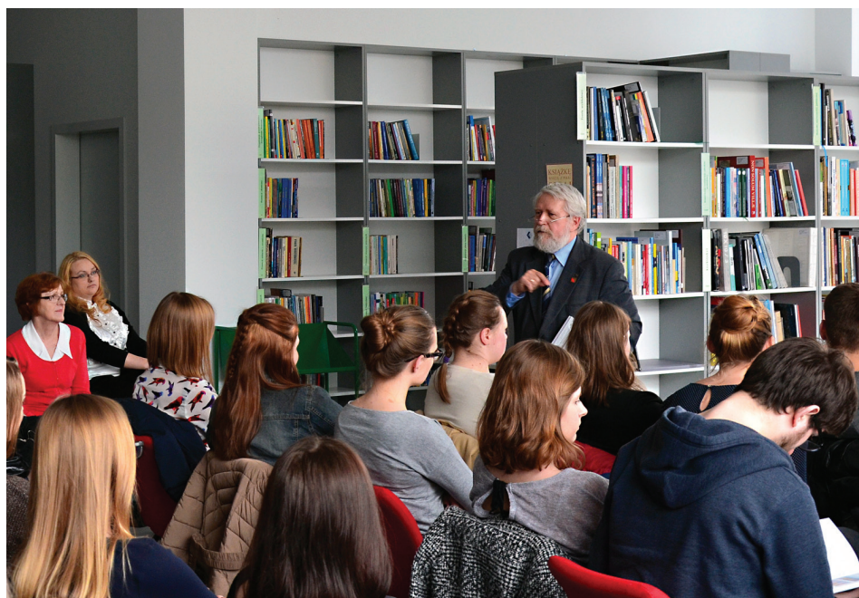
Il. 9. Spotkanie autorskie w Bibliotece Politechniki Lubelskiej.

Bremer, 2014, s. 2) i europejskich (Nicholson, 2009, s. 212–213). W Polsce za przykład mogą posłużyć Biblioteka Główna Uniwersytetu Przyrodniczego w Lublinie i Politechnika Wrocławska. Pierwsza z nich od 2014 roku udostępnia swoim użytkownikom gry w Oddziale Informacji Naukowej, druga poszła krok dalej, uruchamiając w marcu 2017 roku Strefę gier z dostępem do nowoczesnych konsol, takich jak Xbox One. Biorąc pod uwagę aspekt finansowy i specyfikę grupy odwiedzających nas użytkowników, uznaliśmy wybór gier niekomputerowych za właściwy dla Biblioteki PL. Pomysł na realizację tego projektu podsunęły ankiety dotyczące potrzeb i satysfakcji użytkowników, przeprowadzone w latach 2013 i 2015 wśród społeczności akademickiej naszej uczelni. Analiza odpowiedzi pokazała, że „czytelnicy traktują Bibliotekę Politechniki Lubelskiej nie tylko jako miejsce wypożyczeń i zwrotu książek, jest dla nich miejscem, gdzie pracują, uczą się, tworzą projekty, spotykają, wypoczywają” (Matczuk, Pełka-Smętek, 2015, s. 218). „Nowoczesna biblioteka wychodzi naprzeciw oczekiwaniom swoich czytelników, a wzbogacenie jej oferty kulturalnej o gry planszowe sprawi, że stanie się ona jeszcze bardziej atrakcyjna” (Januszewski, 2016, s. 14). W podjęciu decyzji o realizacji tego pomysłu pomógł również kontakt z Samorządem Studenckim odpowiedzialnym za spotkania pod nazwą Pollub Gaming , zrzeszające studentów i innych chętnych po 16. roku życia do wspólnego grania. Do tej pory