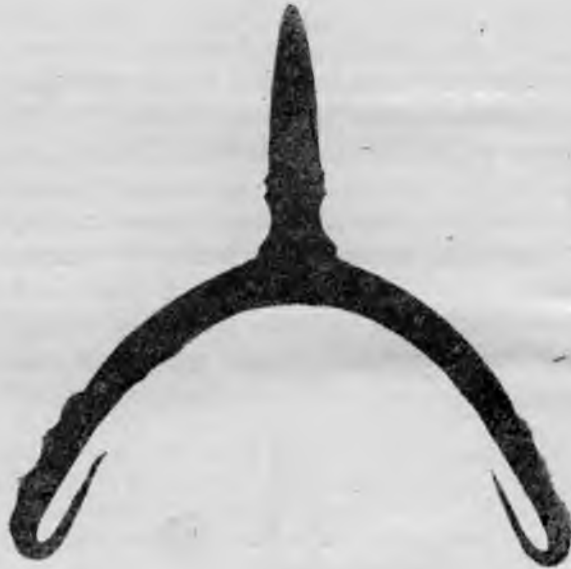
Ryc. 2. Mokre, woj. zamojskie, stan. I. Ostroga żelazna z kopca nr 41 — rentgenogram. Skala 1 : 1.

Ostroga, jak można wnosić ze zdjęcia dokonanego za pomocą promieni „X” (ryc. 2), odkuta jest w całości z jednego kawałka metalu 2 . Jej kabłąk jest lekko asymetryczny, w przekroju trójkątny, o wymiarach: przy bazie bodźca — 6,89 \times 8,00 mm, w połowie długości ramienia kabłąka — 5,30 \times 5,35 mm. Wysokość wewnętrzna kabłąka wynosi 30,40 mm, a rozpiętość wewnętrzna jego ramion — 56,00 mm. W częściach przyczepowych ramiona kabłąka mają po zewnętrznej stronie cztery dołeczki, rozdzielone garbkami, na których są płytkie nacięcia 3 . Górna część bodźca, masywna, ośmioboczna, zwężająca się ku górze i spiczasto zakończona, osadzona jest na bazie trzyczłonowej, w której wklęsłość („klepsydrowata szyjka”) znajduje się między dwoma poduszkami.