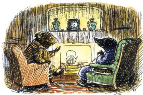
Il. 2. Dom Szczura Wodnego – E. Shepard

Właściciel nadrzecznej norki kocha swoje mieszkanie ponad wszystko, opuszcza je na dłużej rzadko i niechętnie, z wielką przyjemnością natomiast do niego wraca. Choć „prosty i skromny” [26] jest to dom idealny, pod każdym względem dopasowany do angielskiej wizji domowej doskonałości: w saloniku na kominku zawsze płonie ogień, przed którym, oświetlone łagodnym światłem, ustawione są dwa najwygodniejsze na świecie fotele. Spizarnia jest pełna przysmaków, a w piwniczce nie brak wyśmienitych trunków – kolacjom towarzyszą wieczorne opowieści, które są strawą dla ducha, tak jak zawartość kredensów i spizarki stanowi strawą dla ciała. Sam właściciel domostwa jest wzorem gościnnego gospodarza – dzięki jego staraniom, zaopatrzony w szlafrok i kaptcie, odprowadzony do najlepszej, zacisznej sypialni, Kret znajduje nad Rzeką prawdziwą przystań – drugi, przyjazny dom, w którym po dniu pełnym wrażeń zasypia, ukołyszany pluskiem fal, jak ktoś, kto „czuje się jak u siebie w domu”.