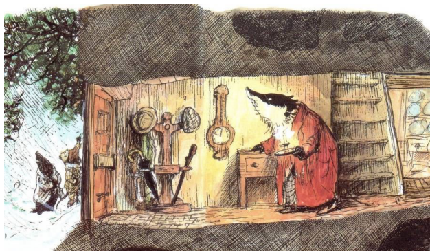
Il. 3. Dom Borsuka – E. Shepard; źródło: https://i.pinimg.com/736x/9f/a1/90/9fa190dd61ebfaffd03593e87fd49428.jpg [20.02.2017].

jak gdyby z Wergilijskich Georgików . Meble kuchenne są uosobieniem prostoty, „pęki suszonych ziół, siatki z cebulą, kosze z jajkami” świadczą o swojskości i dostatku domostwa. Jednocześnie przestrzeń domowa sprzyja budowaniu międzyludzkich (międyzwierzęcych?) relacji, szczególnie przyjaźni, która, jak zdaje się mówić Grahame, cementuje zdrowe społeczeństwo, jest jego podstawową wartością. W domowym rytuale (jedzenia, rozmowy, palenia fajki) udział bierze zarówno ciało, jak i duch, wzmocniony jeszcze aurą bohaterskich czasów i czynów. Więcej nawet: cała kuchnia zdaje się ożywać i włączać w obrzędy domowości – rumiana podłoga „uśmiecha się” do sufitu, dębowe ławy spoglądają na siebie wesoło, talerze w kredensie szczerzą się z radości, a ogień na kominku figlarnie migocze. Dom w ujęciu Kennetha Grahame’a – animizowany i antropomorfizowany – okazuje się żywą istotą, która skrywa swoje własne uczucia, myśli i tajemnice.