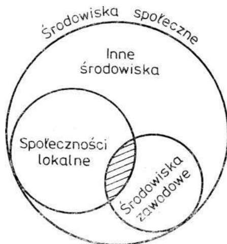
Rys. 1. Środowisko — społeczności lokalne — środowiska specjalistyczne

Można by „środowisko” w ujęciu Znamierowskiego, a więc środowisko w ogóle, traktować jako pojęcie obejmujące różne środowiska zawodowe i społeczne oraz społeczność lokalną, co przedstawia rys. 1.