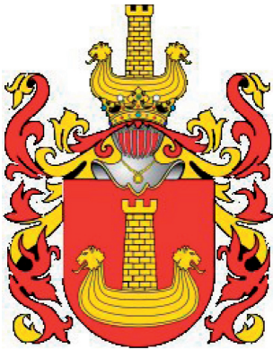
Rys. 1. Herb szlachecki Korab