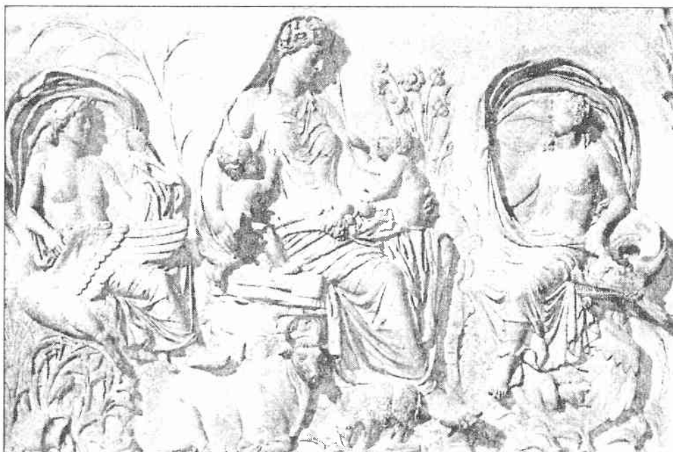
Ryc. 2. Fragment fryzu z ołtarza pokoju z przedstawieniem Bogini Matki [?] (wg Kleiner 1992, s. 97, il. 80)

Jako uzupełnienie powyżej wypowiedzianych uwag na temat społecznych wartości przypisywanych dzieciom przez Rzymian, chciałabym jeszcze na koniec zwrócić krótko uwagę na elementy ikonografii dziecka. Dzieci, choć oczywiście nie są dominującym tematem w sztuce rzymskiej, pojawiają się w niej na przestrzeni dziejów ewidentnie i to w różnych kontekstach, zarówno w sztuce oficjalnej, jak i prywatnej (RAWSON 1997, s. 205-232). Stosunkowo najczęściej ich wizerunki pojawiają się w kontekście funeralnym – widnieją na ołtarzach, stellach lub na sarkofagach. Natomiast na pewno jednym z najbardziej spektakularnych, zachowanych do naszych czasów zabytków sztuki oficjalnej, na którym pojawiają się dzieci, jest Ołtarz Pokoju z okresu Augusta, za panowania którego wartości pro-rodzinne zaczęły zresztą być mocno promowane, a wiadomo, że język wyobrażeń wizualnych był w starożytności rzymskiej wyjątkowo skutecznym i potężnym narzędziem propagowania wzorców i przekazywania nowych idei lub utrwalania starych. W scenie procesji ofiarnej (ryc. 1), w której uczestniczy rodzina princepsa, a która była wyidealizowaną