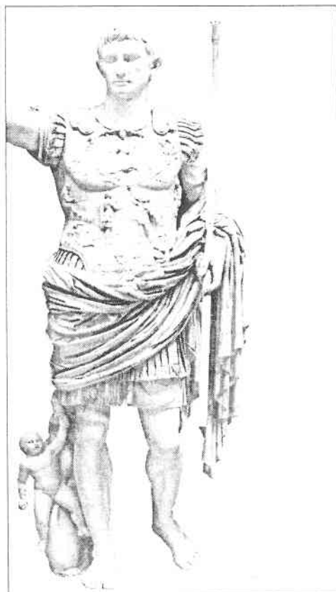
Ryc. 3. Fragment posągu Augusta z Prima Porta (wg Ramage i Ramage 2000, s. 110, il. 3.19)

wizją odnowionego państwa, na pierwszym planie u boku swych rodziców znalazły się dzieci, zapewne gwaranci szczęśliwej przyszłości. Co więcej ich pozy wskazują na element aktywności i akcentują więź emocjonalną z dorosłymi (ZANKER 1999, s. 161-162).