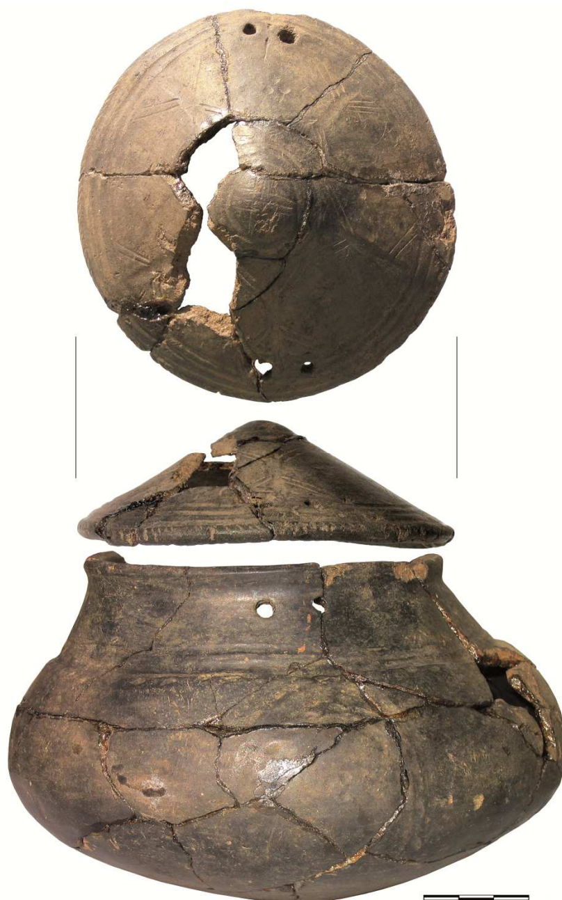
Ryc. 1. Miłosławice, gm. Milicz, pow. milicki, woj. dolnośląskie. Waza z pokrywą z grobu 304