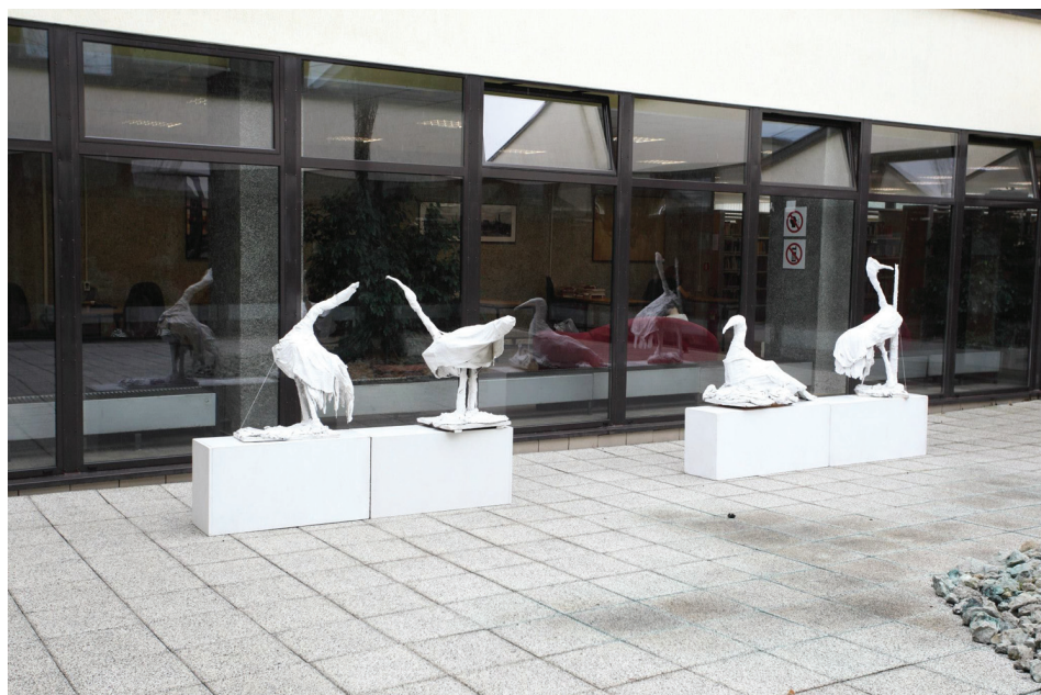
Il. 2. Wystawa S-potykanie z 2014 roku.

niepełnosprawnych. Pierwsza, zatytułowana S-potykanie , została przygotowana w roku 2014 z okazji 35-lecia Pracowni Rozwijania Twórczości Osób Niepełnosprawnych Katolickiego Stowarzyszenia Osób Niepełnosprawnych Diecezji Toruńskiej im. Wandy Szuman (il. 2). Kolejna prezentacja prac podopiecznych tego stowarzyszenia odbyła się w roku 2016 z okazji 1050. rocznicy chrztu Polski i nosiła tytuł Po Twoich śladach . W BU odbyło się już także siedem koncertów nauczycieli i uczniów Społecznego Ogniska Artystycznego działającego przy Toruńskim Towarzystwie Muzycznym. W grupie urzędów i jednostek samorządowych warto odnotować Urząd Miasta Torunia, Urząd Marszałkowski Województwa Kujawsko-Pomorskiego, Naczelną Dyрекcję Archiwów Państwowych oraz Instytut Pamięci Narodowej. Bardzo pręźnie działają także organizacje studenckie, przygotowując konferencje, spotkania, a także akcje o charakterze charytatywnym. Wielokrotnie BU była miejscem inicjatyw realizowanych przez Europejskie Stowarzyszenie Studentów Prawa ELSA Toruń, Niezależne Zrzeszenie Studentów UMK, Stowarzyszenie Wspierania Międzynarodowych Wymian Studenckich Erasmus Student Network, a także studenckie koła naukowe na Wydziale Prawa i Administracji czy na Wydziale Politologii i Studiów Międzynarodowych UMK. Wiele pokazów i stoisk promocyjnych organizowały podmioty komercyjne, prezentując usługi czy produkty adresowane do bibliotek, jak choćby wydawnictwa: ABE-IPS Sp. z o.o., Brill, Helion czy firmy: EBSCO,