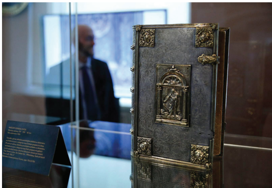
Il. 1. Wernisaż wystawy Nad złoto cenniejsze... Fot. Piotr Kurek.

Biblioteka Uniwersytecka w Toruniu chętnie aranżuje proponowane inicjatywy lub pozytywnie na nie odpowiada. Mają one różnorodny charakter: od wystaw, poprzez konferencje naukowe, spotkania autorskie, szkolenia, po prezentacje. Wiele przedsięwzięć organizuje, wykorzystując zbiory własne: najcenniejsze rękopisy, starodruki, grafiki, dzieła sztuki czy dokumenty życia społecznego, ukazujące życie i dorobek artystów polskich na obczyźnie, pracowników Uniwersytetu Mikołaja Kopernika i Uniwersytetu Stefana Batorego w Wilnie, jak również wydarzenia historyczne czy wybitne osobowości o znaczeniu regionalnym, ogólnopolskim lub międzynarodowym (Mikołaj Kopernik, Jan Paweł II, Tytus Hipolit Czeżowski, Jan Karski i in.). Jako przykład wymienić można wystawę: Nad złoto cenniejsze. Skarby Uniwersytetu Mikołaja Kopernika , przygotowaną w roku 2015 z okazji jubileuszu 70-lecia UMK wspólnie z Muzeum Okręgowym w Toruniu, a eksponowaną w Sali Królewskiej Ratusza Staromiejskiego (il. 1). Zaprezentowano wówczas po raz pierwszy wszystkie 15 ocalałych z 20 opraw wchodzących w skład Srebrnej Biblioteki księcia Albrechta Hohenzollerna i jego drugiej żony Anny Marii. Spośród ocalałych opraw – 12 stanowi najcenniejszą część zbiorów BU. Ekspozycję wzbogaciła prezentacja kodeksów rękopiśmiennych, iluminowanych inkunabułów i XVI-wiecznych druków oraz gotyckich i renesansowych opraw, również pochodzących z prywatnej oraz zamkowej