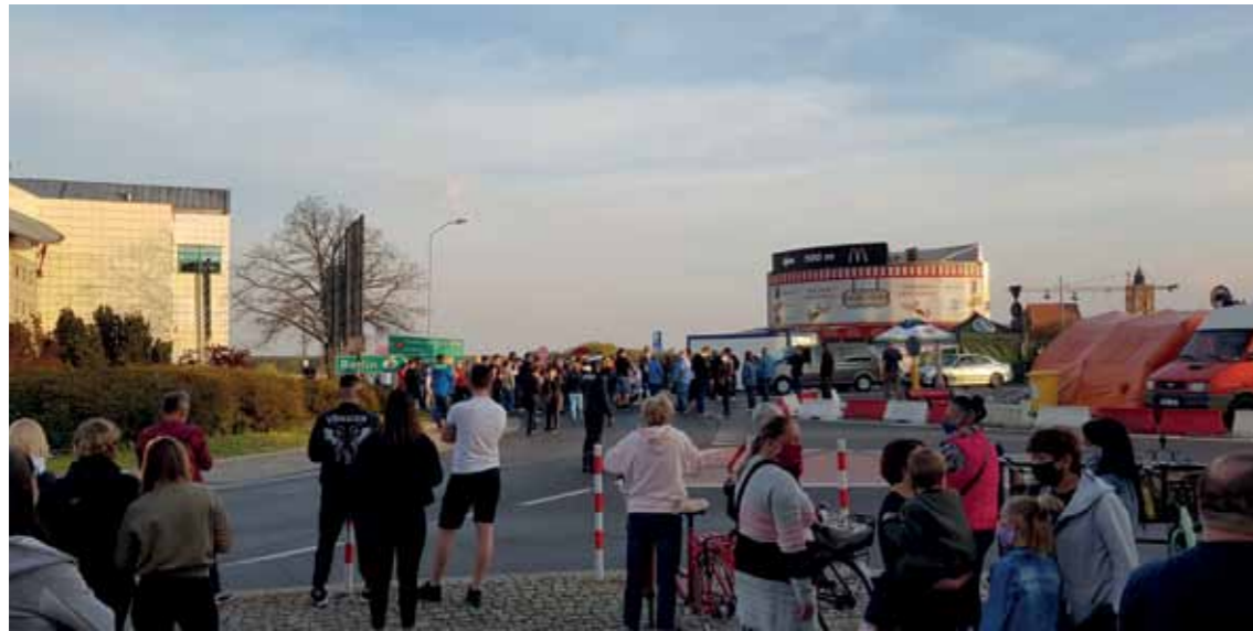
Figure: Protesters near the border bridge, Stubice, Poland