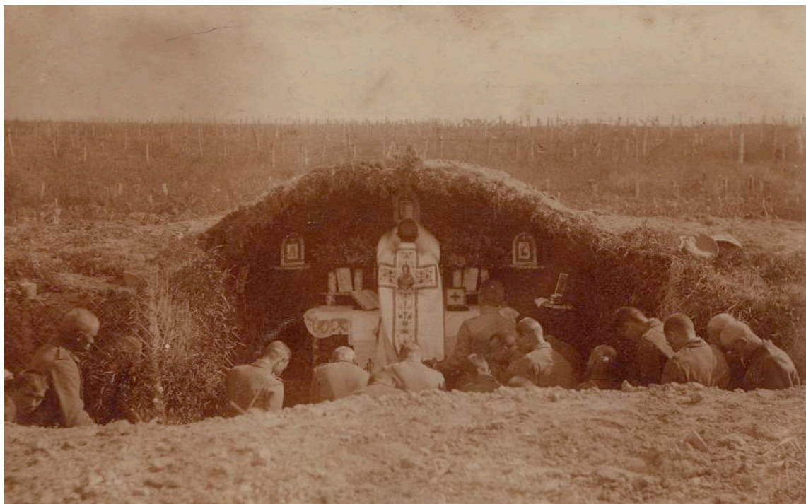
Ryc. 1. Fotografia wykonana w czasie I wojny światowej przedstawia zbudowaną przez żołnierzy armii niemieckiej kaplicę polową na linii frontu. Miejsce sakralne znajdowało się więc w miejscu w którym ofiarny charakter służby wojskowej był bardzo widoczny. W trakcie nabożeństwa kapłan ubrany w biały strój liturgiczny, kontrastował z szarymi uniformami żołnierzy i przedpołem pełnym zasieków. Żołnierze mimo niebezpieczeństwa jakim było zgrupowanie się w jednym miejscu, uczestniczyli w rytualnej mszy świętej na pierwszej linii.

państwach Europy duchowni nie byli zwolnieni ze służby wojskowej, nierzadko służyli w oddziałach liniowych, czasami jako sanitariusze, a czasami jako zwykli żołnierze. Mimo iż przypadki takowe sprzeciwiały się powołaniu kapłańskiemu i łamały liczne zakazy kościelne (ale nie państwowe), zdarzało się, iż księża walczyli z bronią w ręku i zabijali 105 . Jeden z francuskich księży opisywał jak jego kolega, ksiądz-żołnierz, podkraść się do linii niemieckiej i zabił nożem wartownika: „ To Francja błaga, żąda i rozkazuje. To, także głos najwznioślejszego braterstwa, który wzywa: bij [...] armia francuska nie umie ustępować ” 106 . W opisie tym charakterystyczne jest ustawienie na pierwszym miejscu kraju, narodu, który to tocząc wojnę sprawiedliwą, żąda i nakazuje złamanie świętych ślubów. Dylemat, czy jest się przede wszystkim księdzem, czy żołnierzem, rozwiązany został na korzyść państwa. Ksiądz po walce odprawiał w szpitalu mszę za zmarłego nieprzyjaciela: