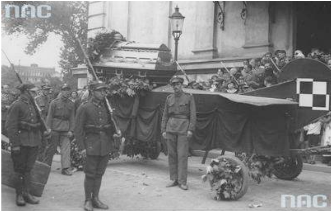
Narodowe Archiwum Cyfrowe, sygn. 1-W-411

Ryc. 12. Zdjęcie przedstawiające pogrzeb pilota Ludwika Pietraszkiewicza w Poznaniu (22.08.1932). Trumna na karawanie w kształcie kadłuba samolotu symbolicznie nawiązuje do broni w której służył zmarły, została przed chwilą wyniesiona z kościoła garnizonowego. Karawan otoczony przez regulaminową eskortę pogrzebową. Autor nieznan, NAC, Koncern Ilustrowany Kurier Codzienny - Archiwum Ilustracji, 1-W-411,