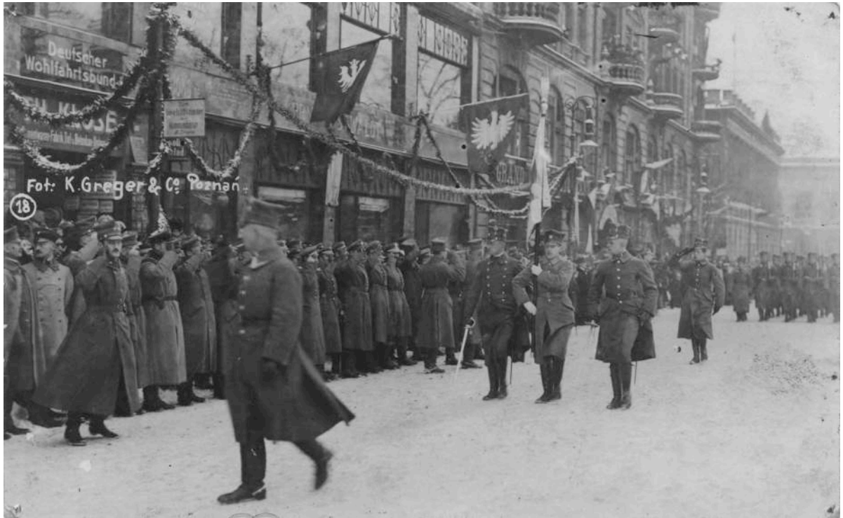
Ryc. 8. Przysięga na placu Wilhelmowskim w Poznaniu (26.01.1919). Zaprzysiężone oddziały defilują ulicami, poczet sztandarowy niosący poświęcony sztandar poprzedza defilujących żołnierzy. Ozdobione barwami narodowymi kamienice.