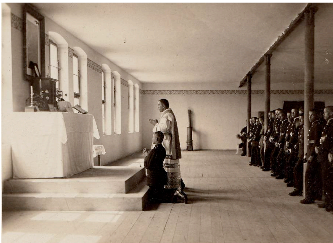
Ryc.4. Fotografia przedstawia niedzielną mszę w Korpusie Kadetów nr. 3 w Rawiczu. Kadeci uczestniczą w mszy stojąc. Widoczny improwizowany charakter pomieszczenia. Fotograf nieznany. Fotografia w zbiorze autora.

W roku 1930 nastąpiły znaczące zmiany w liczbie kaplic należących do parafii wojskowych OK VII. Parafia poznańska posiadała kaplicę w szpitalu okręgu nr VII, w Biedrusku, na Ławicy, w więzieniu śledczym, w oddziale zakaźnym szpitala okręgowego. Parafia gnieźnieńska miała kaplicę szpitalną, parafii leszczyńskiej podlegały kaplice w szpitalu i w Korpusie Kadetów w Rawiczu.