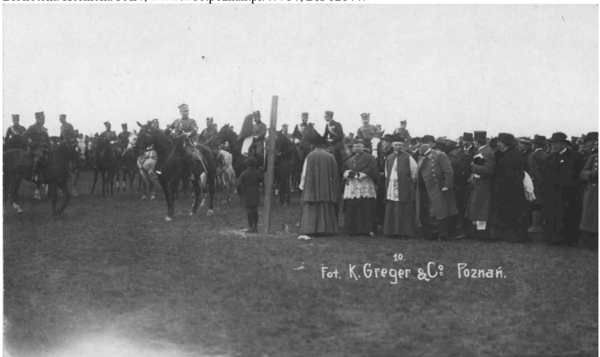
Ryc. 24. Uroczystości 3 maja na Ławicy (03.05.1919). Po mszy przedstawiciele władz cywilnych, kościelnych oraz wojskowych w oczekiwaniu na defiladę. Oficerowie dosiadają koni, co symbolizują ich status oficerski (stanowiąc zarazem nawiązanie do tradycji rycerskiej której koń był nieodłącznym elementem). Również widoczne jest tu uszeregowanie hierarchiczne, arcybiskup i duchowieństwo znajduje się w pierwszym szeregu, w pobliżu odbierającego defiladę gen. Dowbor-Muśnickiego. Defilada jest ceremonią należącą przede wszystkim do sfery wojskowej, więc najważniejszą rolę odgrywa tu głównodowodzący.