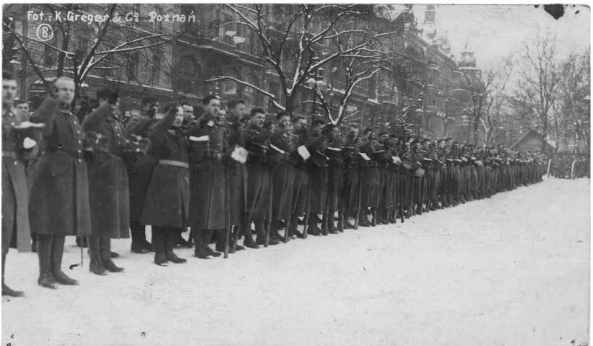
Ryc. 7. Fotografia przedstawia przysięgę wojsk wielkopolskich na placu Wilhelmowskim (26.01.1919). Uchwyciony moment zaprzysiężenia żołnierzy. Żołnierze stoją z odkrytymi głowami, w lewej ręce trzymając czapki, karabin u lewej nogi, prawa ręka uniesiona z wysuniętymi dwoma palcami skierowanymi ku niebu. Gest ten ma znaczenie symboliczne, wskazują bowiem na Boga, będącego świadkiem i gwarantem przysięgi.