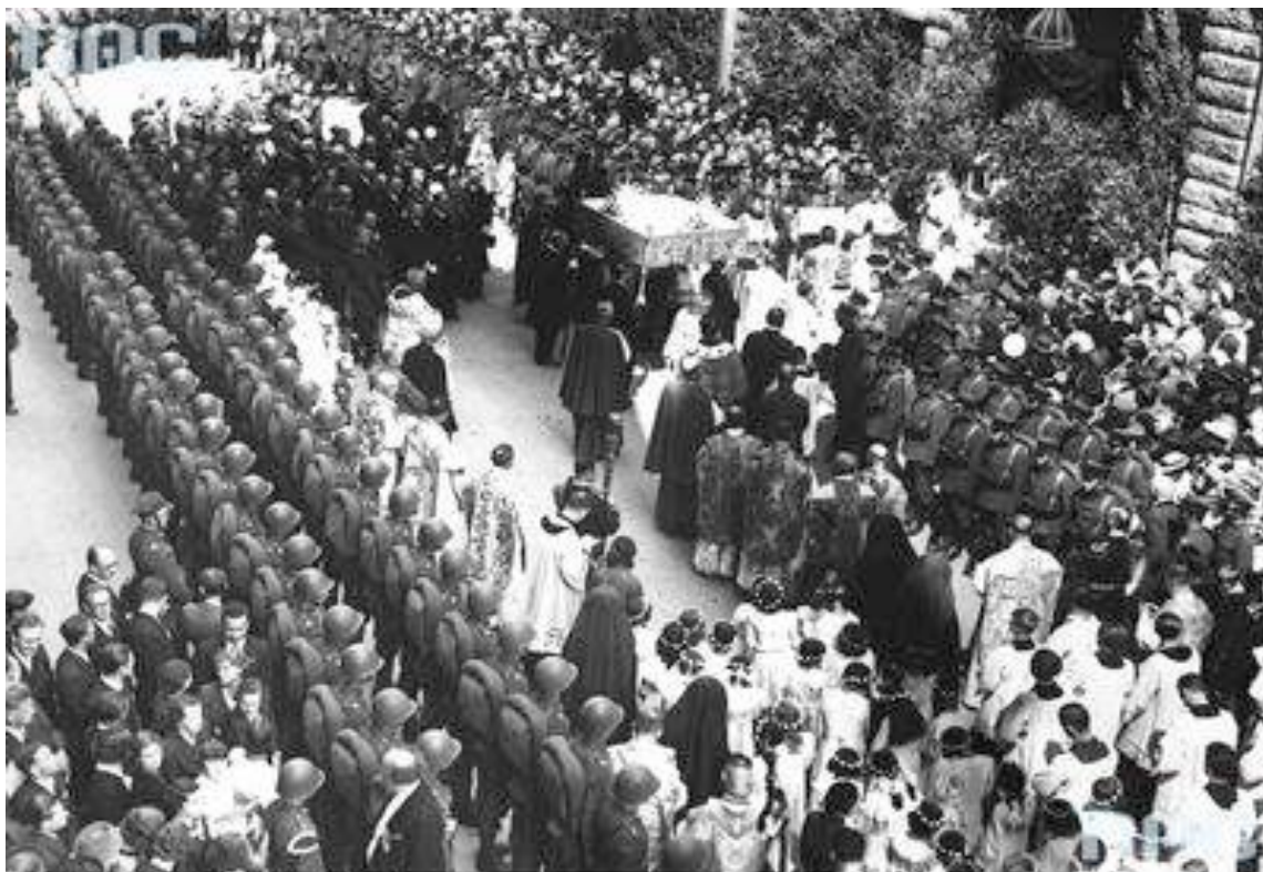
Naródzina Archiwum Cyfrowe, tygiel: 1-R-352-3

Ryc. 26. Procesja farna Bożego Ciała w Poznaniu (19.06.1938) ukazana na fotografii. Jeden z ołtarzy procesji kompania honorowa w hełmach, z plecakami i bronią ustawiona równolegle do ołtarza. Inni żołnierze odgradzają publiczność tworząc szpaler. W środku kordonu przed ołtarzem kapłani oraz przedstawiciele władz wojskowych, cywilnych i najznamienitsi obywatele. Autor nieznany, NAC, Koncern Ilustrowany Kurier Codzienny - Archiwum Ilustracji, 1-R-352-3