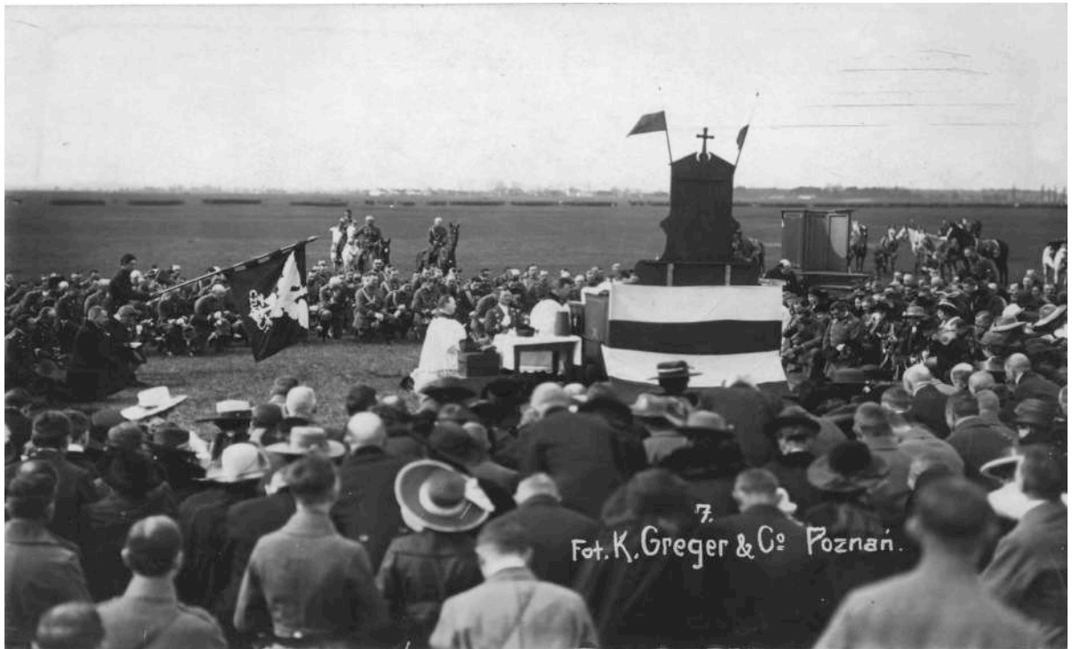
Ryc.23. Fotografia przedstawia obchody uroczystości 3 maja na Ławicy (03.05.1919). W trakcie nabożeństwa w momencie w którym należy okazać cześć sakramentowi poczet sztandarowy salutuje sztandarem. Żołnierze klęczą z odkrytymi głowami. Żołnierze na koniach nie zsiadają z nich. Z za ołtarzem znajdują się tłumy mieszkańców którzy przyszli uczestniczyć w uroczystościach.