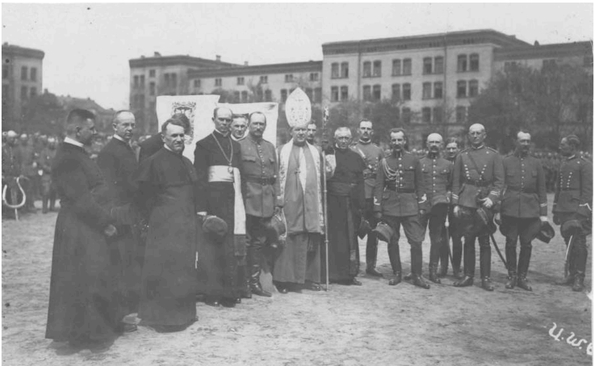
Ryc. 2. Wizyta biskupa polowego Galla w Poznaniu (14.05.1919). Biskup w stroju liturgicznym, w otoczeniu oficerów i kapelanów wojskowych wojsk wielkopolskich, mających w rękach charakterystyczne regulaminowe czapki wojsk wielkopolskich. Przy biskupie generał Dowbor-Muśnicki i dziekan Dykier.