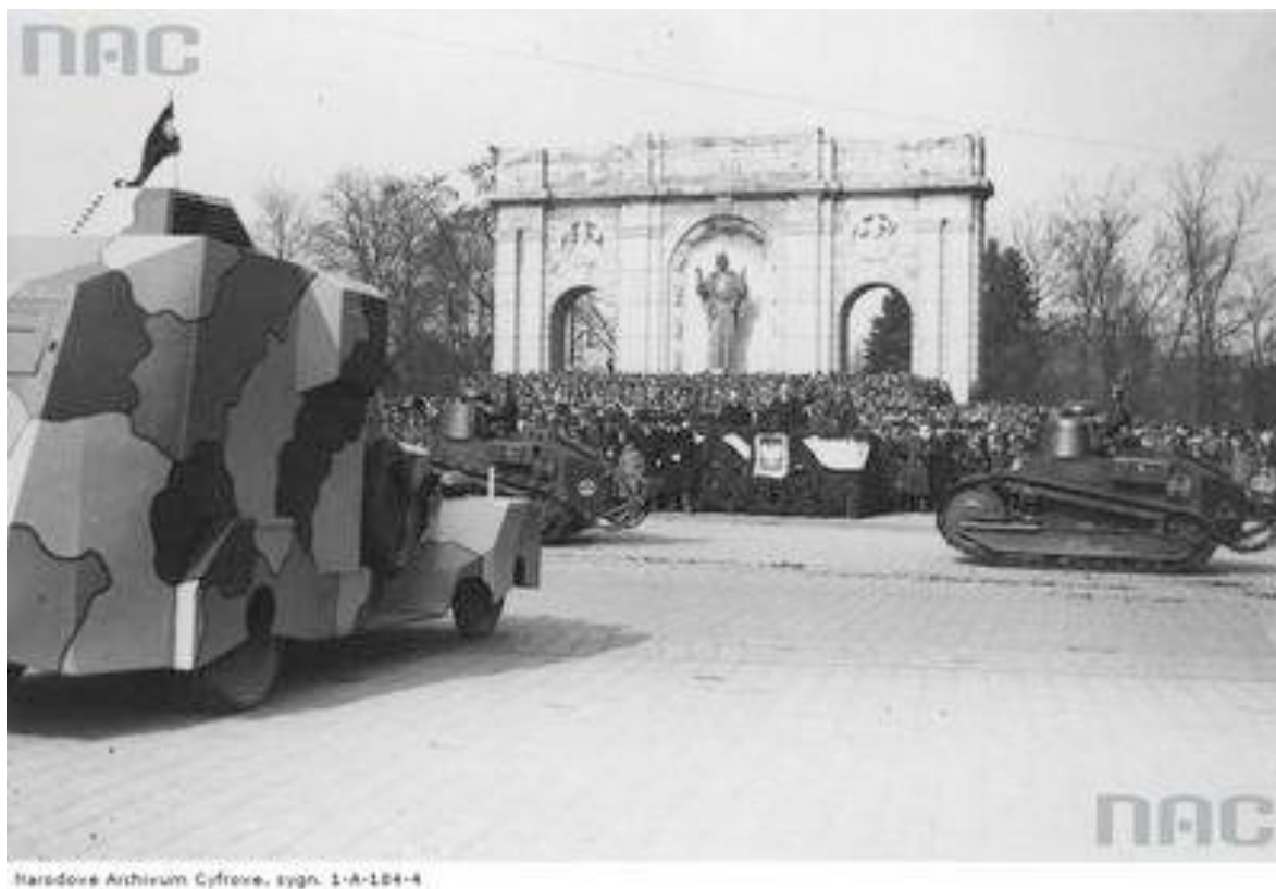
Ryc. 20. Fotografia przedstawia defiladę oddziałów garnizonu poznańskiego z okazji dnia imienin marszałka Józefa Piłsudskiego. Trybuna honorowa umieszczona przed pomnikiem Pomnik Najświętszego Serca Pana Jezusa w Poznaniu. Takie usytuowanie trybuny honorowej stwarza wrażenie, iż salutujące oddziały oddają cześć nie tylko dowódcy odbierającemu defiladę lecz także Chrystusowi.

Po mszy następował uroczysty apel, podczas którego odczytywano rozkaz okolicznościowy. Nierzadko odczytywano życzenia, jakie oddział wysyłał do solenizanta.