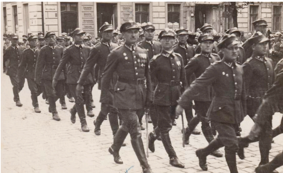
Ryc. 16. Przemarsz zwartego pododdziału z 58 pp. do kościoła garnizonowego w Poznaniu na niedzielną mszę świętą (1934). Podoficerowie przy szablach, z przypiętymi odznaczeniami. W tyle widoczna orkiestra pułkowa.