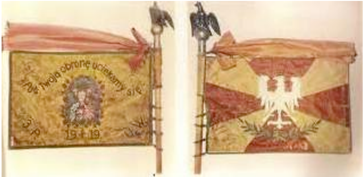
Ryc. 11. Sztandar 3 Pułku Ułanów Wielkopolskich (późniejszy 17 p.u.), zawierający wizerunek Matki Boskiej oraz skierowaną do niej antyfonę Pod Twoją obronę uciekamy się . Umieszczenie wezwania tego typu na weksylium oddziału stanowi prośbę, modlitwę o ochronę dla żołnierzy walczących pod tym sztandarem. Na stronie prawej sztandaru widoczne godło Polski umieszczone na czerwonym krzyżu maltańskim. Znaki sakralne zwiększają sakralność sztandaru wynikającą z jego poświęcenia. Napisy i wizerunek Matki Boskiej na sztandarze mógł wpływać negatywnie na odczucia służących w jednostce protestantów, nie uznających kultu świętych w tym także kultu maryjnego. Sztandar ten był użytkowany do maja 1939 roku kiedy to został zastąpiony nowym, regulaminowym sztandarem.

uosabiał ją. Przepisy określały, że sztandar był widowym znakiem uosabiającym Państwo Polskie, jest symbolem najwyższych wartości ducha i ciała, których Polska wymaga od swych żołnierzy 594 . Utrata znaku powodowała dyshonor dla jednostki i prowadziła do jej rozwiązania. W okresie II RP odpowiednie przepisy wojskowe precyzowały symbolikę na sztandarach wojskowych. Regulaminowe sztandary posiadały na płatach wyhaftowane słowa Honor i Ojczyzna , regulamin nie przewidywał umieszczenia tam słowa Bóg 595 . Jedynymi religijnymi odnośnikami znajdującymi się na sztandarach mogły być umieszczone w rogach wizerunki świętych 596 . Sztandary wojsk OK VII posiadały częstokroć takie wizerunki.