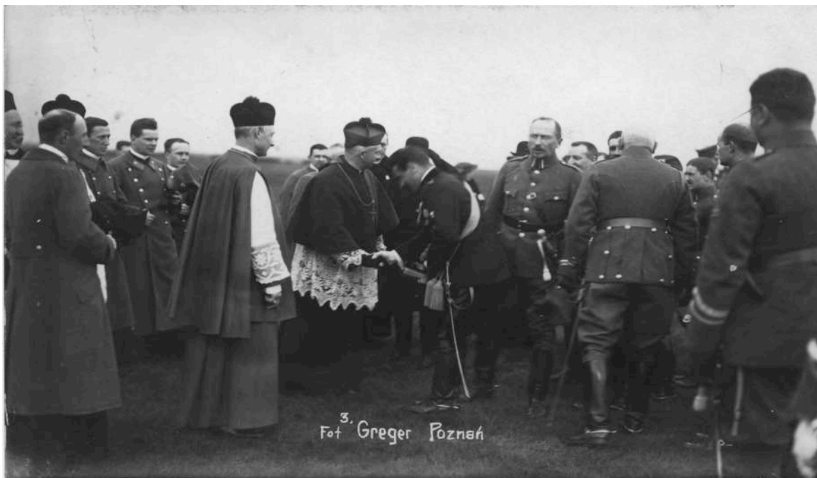
Ryc. 21. Fotografia przedstawia obchody uroczystości 3 maja na Ławicy (03.05.1919). Przybyły arcybiskup Dalbor wita się z przedstawicielami misji alianckiej. Trzeci od prawej głównodowodzący powstaniem gen. Dowbor-Muśnicki. Dostrzegalny pewien podział za arcybiskupem ustawiło się duchowieństwo, po prawej stronie za głównodowodzącym ustawili się oficerowie. Kapelani wojskowi ustawili się wśród duchowieństwa, odróżniają ich trzymane w dłoniach czapki wojskowe oraz płaszcze wojskowe narzucone na sutanny.