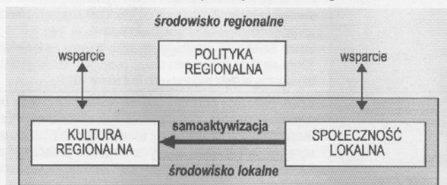
Diagram 2. Samoaktywizacja a kultura regionalna

2. Samoaktywizacja środowiska lokalnego także na podstawie lokalnych zasobów środowiska, stanowiąca wewnętrzna propozycja działania (diagram 2); prowadzi to do powstania silnych, małych środowisk lokalnych, a ich dorobek stanowi ważny element w procesie formowania się wspólnoty regionalnej.