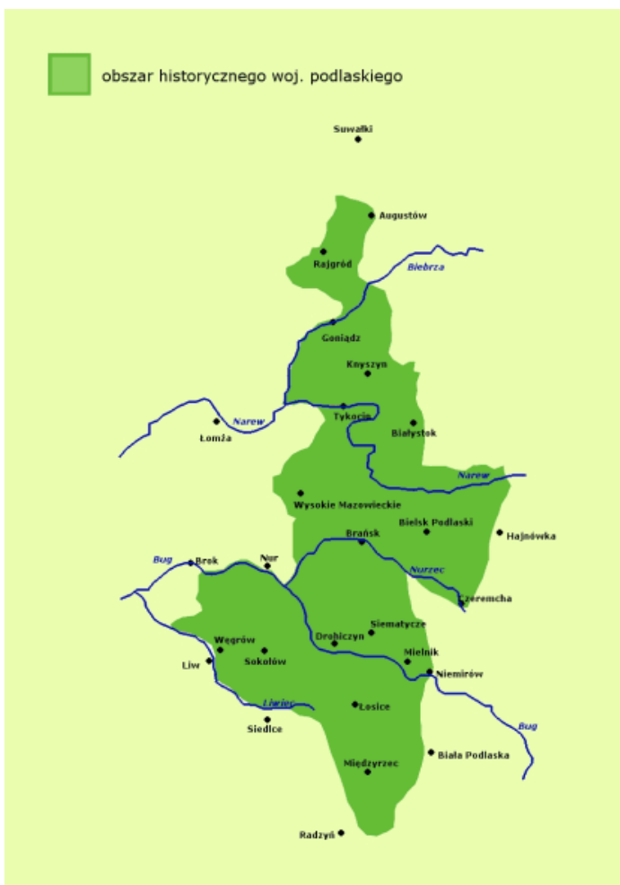
Mapa 1. Historyczne granice Podlasia

czy sporów na tle etnicznym. Po roku 1795 region został podzielony pomiędzy Prusy i Austrię, z granicą biegnącą wzdłuż Bugu. Każda z tych części miała od tej pory odmienne dzieje, co przyczyniło się do osłabienia poczucia wspólnoty pomiędzy ich mieszkańcami (Plit 2008: 8). W zaborze rosyjskim znalazło się wtedy tylko kilka niewielkich miasteczek. Po 1809 roku tereny położone na południe od Bugu weszły w skład Księstwa Warszawskiego, a po 1815 Królestwa Polskiego, z kolei obszary znajdujące się na północ od Bugu, głównie obwód białostocki, znalazły się we władaniu Cesarstwa Rosyjskiego 7 . Było to granica nie tylko polityczna, ale również mentalna. Tym, co dzieliło obie