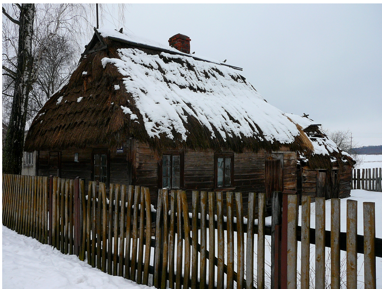
Najstarsza chata w Dubiczach, tzw. słomianka