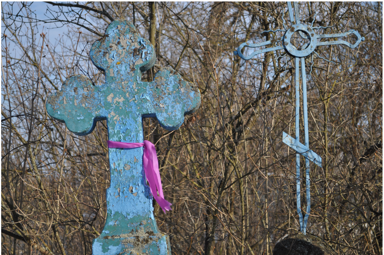
Krzyże cmentarne z przywiązaną wstążeczką