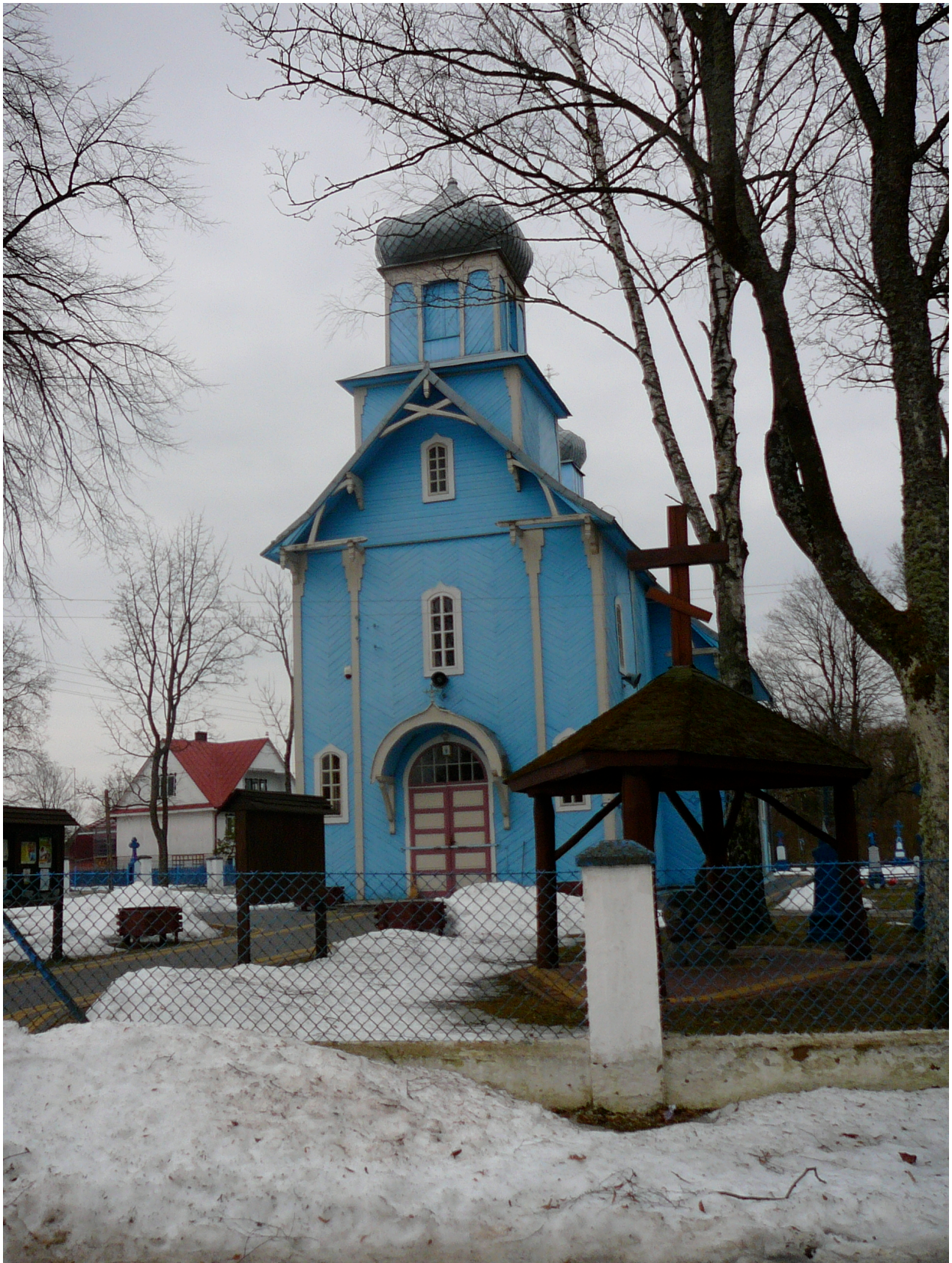
Cerkiew Prawosławna p.w. Opieki Przenajświętszej Marii Panny