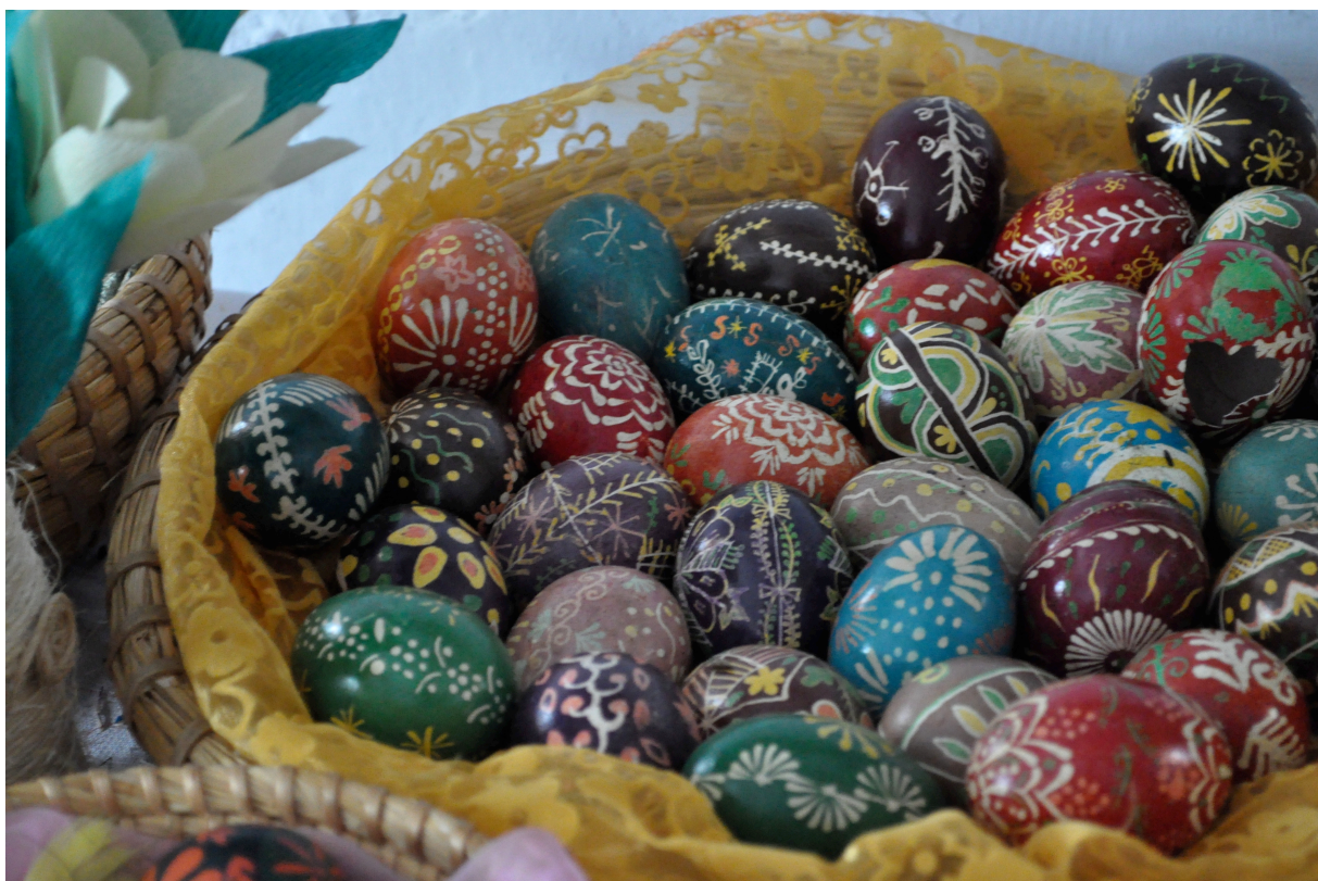
Ręcznie zdobione pisanki wielkanocne