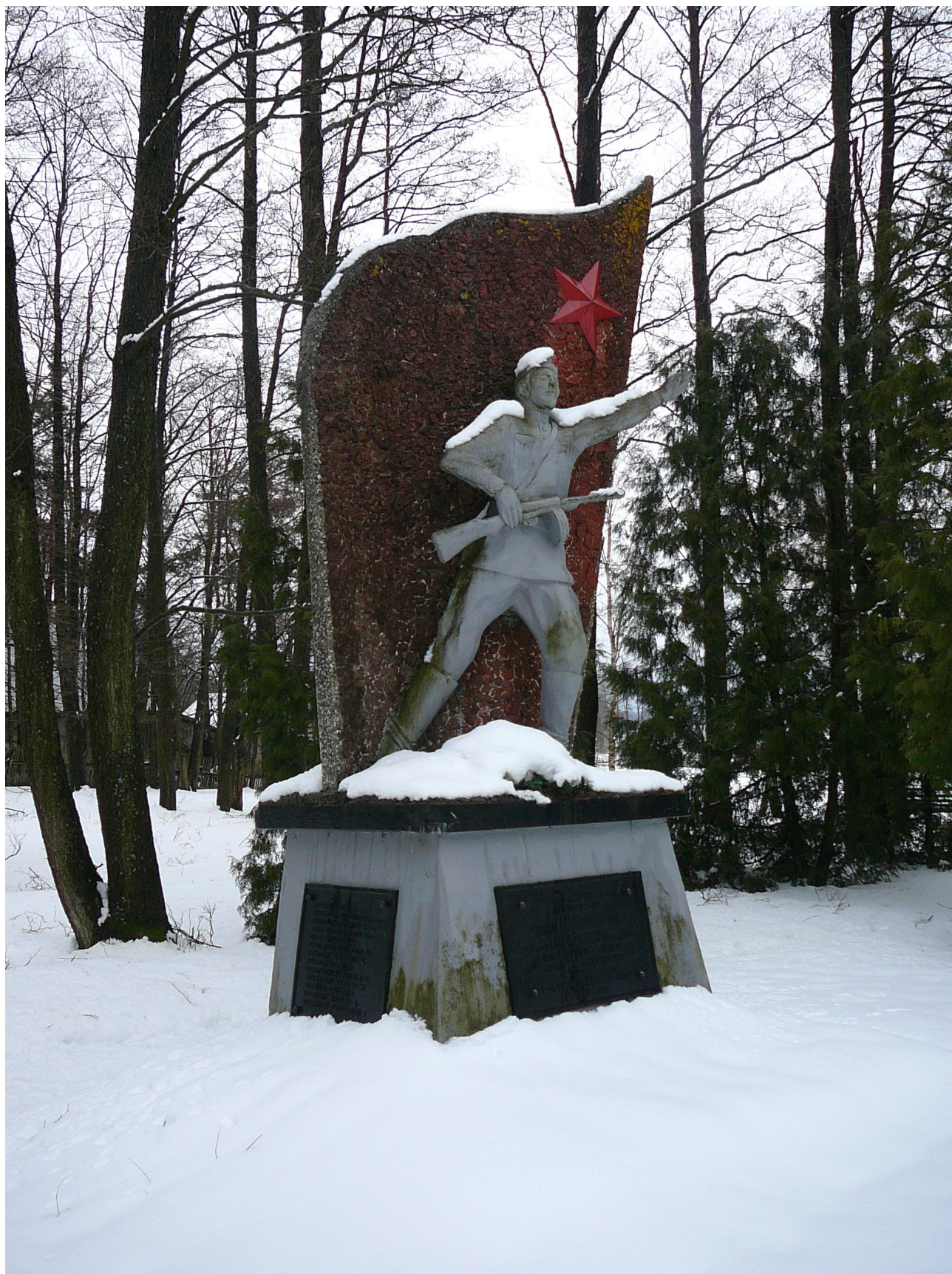
Pomnik żołnierzy Armii Czerwonej, Dubicze Cerkiewne, fot. Marta Rudnicka