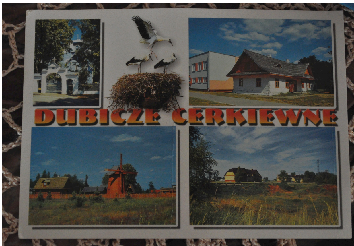
Pocztówka z Dubicz