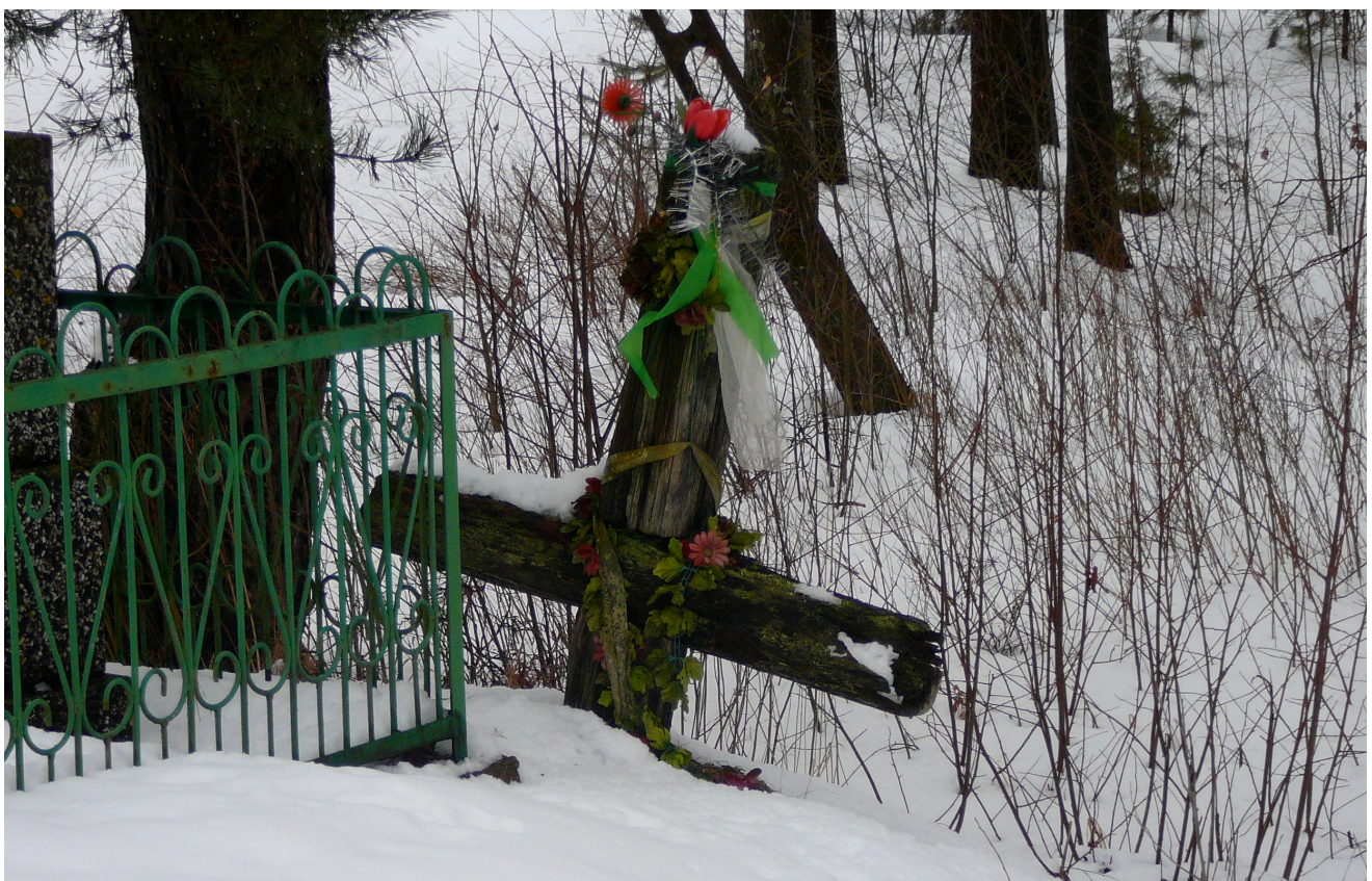
Stary krzyż przydrożny w towarzystwie współczesnego pomnika, fot. Marta Rudnicka