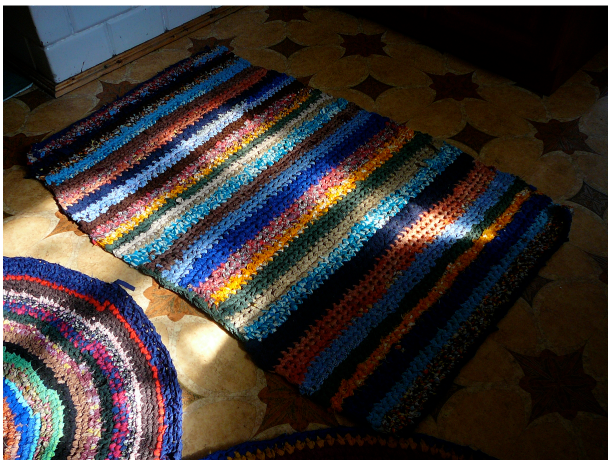
Dywaniki wyplatane ze szmatek, fot. Marta Rudnicka