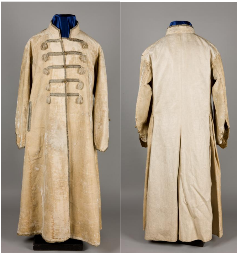
Il. 29 Delia [przód – tył ], uszyta wg projektu J. Matejki, XIX w., 310 x 128 cm, w zbiorach MNK, nr inw. MNK IX/4287

srebrzyste kwiaty, zapinany na guzy, z rozciętymi rękawami, obsyty srebrnym galonem (wykorzystany też w Holdzie pruskim w stroju Tęczyńskiego). Delia ta miała naśladować czuhy rosyjskie, zbytkowne szaty z rękawami do łokcia, a jej materiał przypominać włoską brokatełę z XVI wieku 336 . W lewej ręce Naszczokin trzyma futrzaną czapkę.