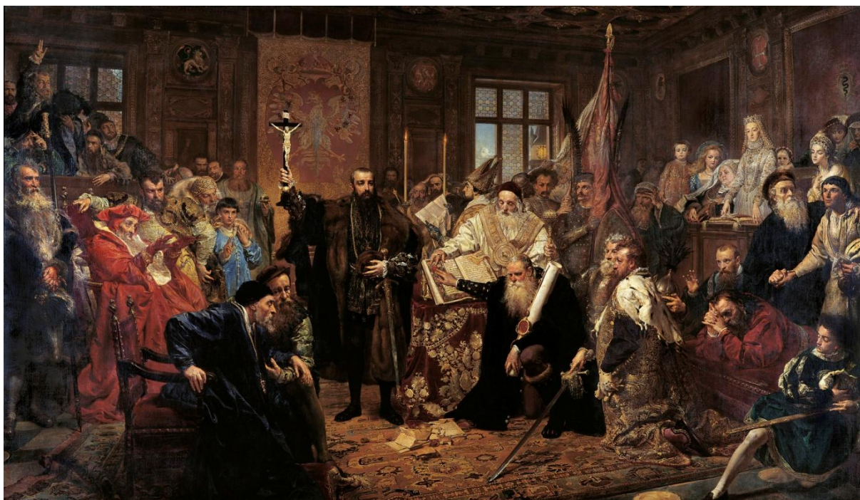
Il. 20 Jan Matejko, Unia Lubelska, 1869, w zbiorach MNW, nr inw. MP 4760

W roku 1869 ukończona została Unia lubelska , na pamiątkę trzechsetnej rocznicy tego wydarzenia. Uznana została za dzieło najbardziej poprawne według standardów akademickich. Inne tytuły obrazu to: Unia ; Sejm Lubelski ; Zygmunt August na sejmie w Lublinie ; Zygmunt August w Lublinie 1569 r. ; Przysięga w Lublinie . Namalowana jest olejem na płótnie o wymiarach 298 x 512 cm. Obecnie stanowi własność MNW (nr inw. MP 4760), a znajduje się w MNL jako depozyt (nr dep. 457) i można ją oglądać na Zamku. W kompozycji Matejko przedstawił końcowe etapy sejmiku w Lublinie – wezwanie króla Zygmunta Augusta do podpisania unii łączącej Koronę i Litwę oraz chwilę jej zaprzysiężenia 243 .