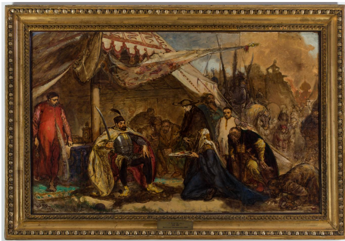
Il. 26 Jan Matejko, Batory pod Pskowem , szkic, 1869, w zbiorach MNP, nr inw. MNP Mp 56, fot. Pracownia Fotografii MNP

Szkic olejny pt. Stefan Batory pod Pskowem ( Batory pod Pskowem , MNP, nr inw. Mp 56) pochodzi z 1869 r. Wykonany jest na papierze o wymiarach 61,5 x 98,5 cm, naklejonym na płótno. Pozostawał w rękach rodziny Matejki do 1898 r., później w warszawskim salonie sztuki „Skarbiec” i u prywatnych właścicieli, w 1949 r. zakupiony do MNP. Układ kompozycyjny jest zbliżony do ostatecznej wersji tematu, zaznaczeni są tylko ważniejsi bohaterowie (co pewnie wynikało stąd, że Matejko pracując nad jakimś dziełem często dodawał kolejne postaci). Różnice są dość liczne, dotyczą mimiki, postaw, gestów, ubiorów i przedmiotów – np. Batory trzyma wzniesioną do góry szablę, na tacy leży opieczętowany dokument 313 .