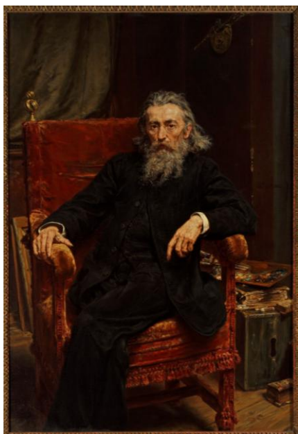
Il. 5 Jan Matejko, Autoportret, 1892, w zbiorach MNW, nr inw. MP 434