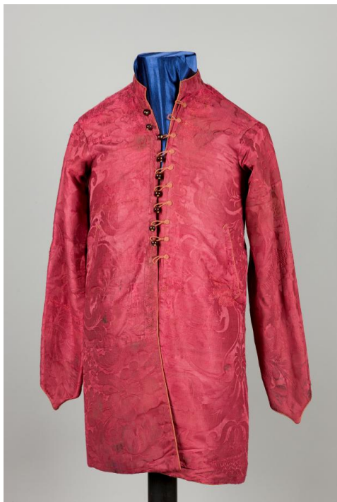
Il. 14 Żupan [przód ], XVIII w., 81,0 x 132,0 cm, w zbiorach MNK, nr inw. MNK IX-4019

Na prawo od Zamoyskiego namalował Matejko trzy kobiety, prawdopodobnie są to: Agnieszka Firlejowa, Anna Jagiellonka (ukazana z rękami złożonymi do modlitwy) oraz Katarzyna Ostrogska (ta, która wspiera czoło na ręce) 121 . Za taką wersją przemawia ich działalność religijna bądź powiązania z postacią ks. Piotra Skargi. Pierwsza z nich, Agnieszka z Tęczyńskich Firlejowa (1578-1644), to żona Mikołaja Firleja, wojewody krakowskiego. W młodości żyła w przyjaźni z królem Zygmuntem III i jego żoną Anną Hasburżanką (jako dwórka królowej pojechała z nią do Szwecji). Ufundowała klasztor karmelitański w Czernej, podejmowała dzieła dobroczynne, a ks. Skarga był przez pewien czas jej spowiednikiem. Zachowane obrazy przedstawiają ją w habicie zakonnym, podobnie ukazał ją Matejko.