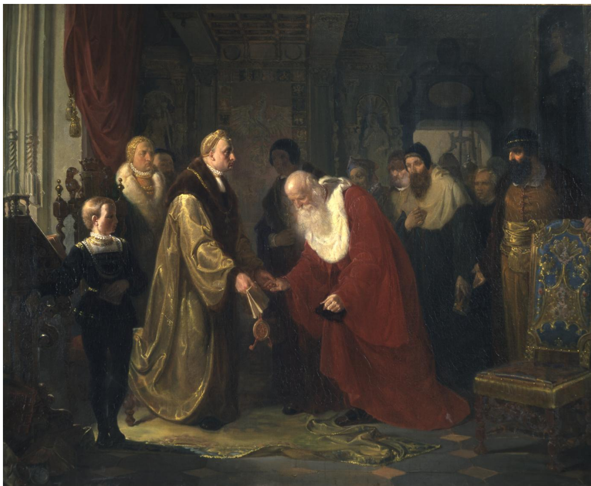
Il. 9 Jan Matejko, Zygmunt I nadający przywilej na szlachectwo akademikom krakowskim w roku 1535, 1858, w zbiorach Muzeum UJ w Krakowie