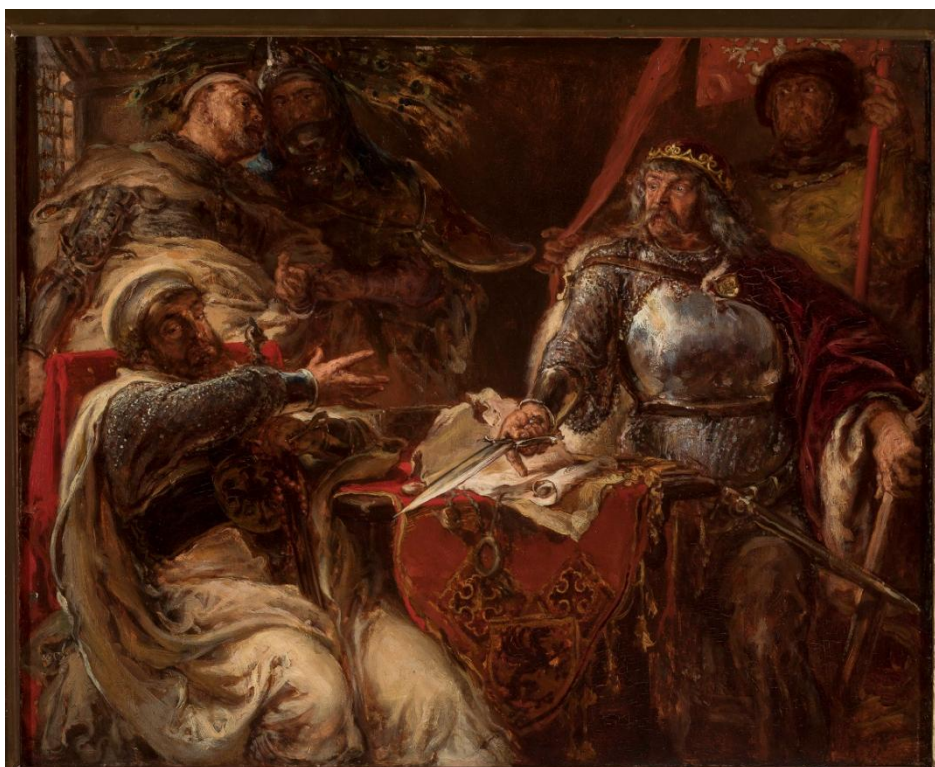
Il. 37 Jan Matejko, Król Władysław Łokietek zrywa układy z Krzyżakami , 1879, w zbiorach MNW, nr inw. 182520, fot. Krzysztof Wilczyński

Łokietek z wielkim mistrzem Karolem Lizenburgiem; Władysław Łokietek zrywa układy z Janem z Licenbura wielkim mistrzem krzyżackim w sprawie ziemi chełmińskiej i Pomorza; Zerwanie układów z Krzyżakami; Łokietek zrywa układ z mistrzem krzyżackim Karolem z Limburga; Łokietek zrywający układy z Krzyżakami na zjeździe w Brześciu Kujawskim w r. 1321 402 . Kompozycja namalowana jest na desce dębowej o wymiarach 33,5 x 39,5 cm, przechowywana w zbiorach Muzeum Narodowego w Warszawie (nr inw. 182520).