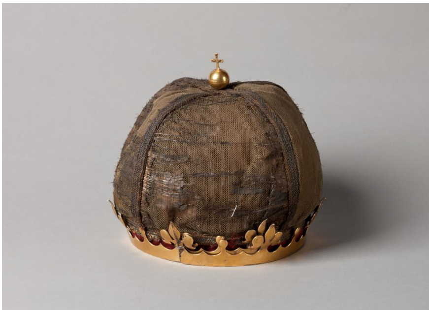
Il. 41 Korona grobowa Zygmunta I Starego, XVI w., wym. wys. 10 x śr. 19 cm, srebro złocone, tkanina złotolita, w zbiorach MNK, nr inw. MNK IX-3623