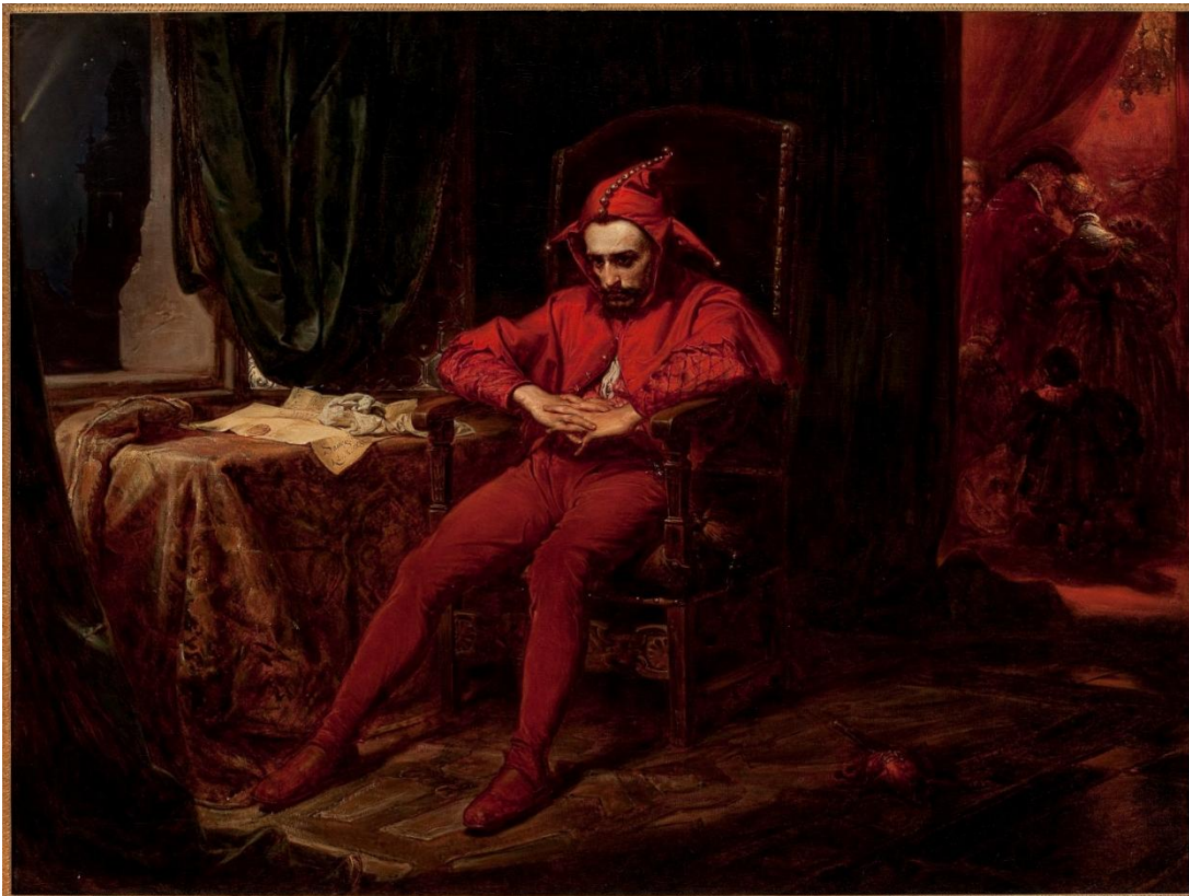
Il. 15 Jan Matejko, Stańczyk, 1862, w zbiorach MNW, nr inw. MP 433

W wymowę historiozoficzną dzieła wpisuje się także umiejscowienie księdza Skargi – przemawia jakby z poręczenia świętego biskupa Stanisława, stojąc na stopniach jego konfesji . Matejko, podobnie jak utożsamiał się z postacią zatroskanego o ojczyznę Stańczyka, tak też identyfikuje się w Kazaniu Skargi z postacią kapłana-proroka. Przesłanie płótna odpowiada schematowi winy i kary w dziejach Rzeczypospolitej, po których przychodzi czas na pokutę i odrodzenie. Późniejsze obrazy Matejki, jego słowa i działania zmierzające do pojednania z Rusinami pozwalają na wysnucie wniosków, iż zamiarem Matejki było również przypomnienie o konieczności podjęcia na nowo misji na wschodzie. Konsekwencją bowiem braku realizacji przez Polskę jej powołania jest aktualny los narodu. Wina dziejowa, która wybrzmiewa w Kazaniu Skargi , nawiązuje do poglądów mesjanistycznych – łączy się tutaj idea „Chrystusa narodów” i niewinnej ofiary z przekonaniem o odpowiedzialności narodu za upadek Polski (co jednak nie pomniejsza win zaborców) 135 .