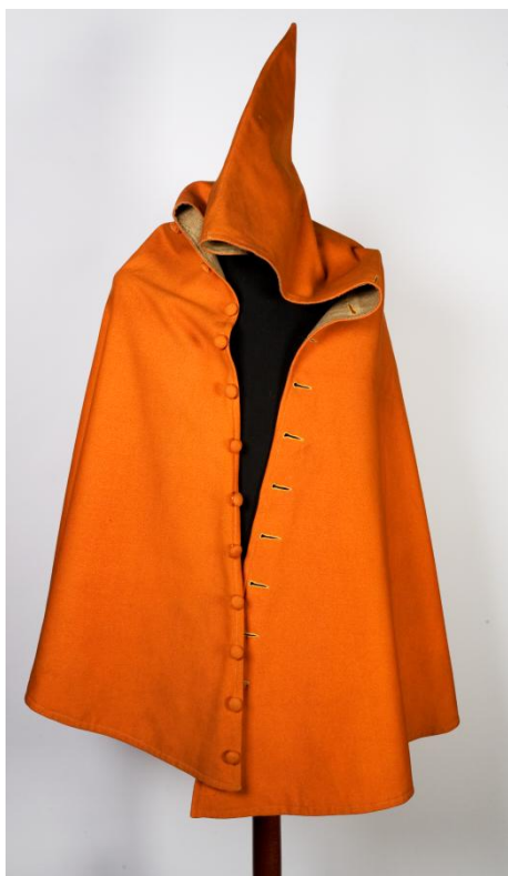
Il. 36 Pelerynka, w zbiorach MNK, nr inw. 4021

księcia szczecińskiego Kazimierza. Można dodać, iż zachowana pelerynka z pomarańczowego sukna (DJM, nr inw. IX-4021), z kapturem, wzorowana na kukli, posłużyła do uzupełnienia stroju wojownika w lewej dolnej części płótna, a półkolista krótka pelerynka z ok. 1869 r. (DJM, nr inw. IX-4020), z zielonego aksamitu i wykończona złotym sutaszem, ukazana została w ubiorze rycerza leżącego za Janem Żiżką. Futrzana czapka lisowczyka (DJM, nr inw. IX-4073) przedstawiona została jako nakrycie głowy litewskiego bądź ruskiego wojownika, natomiast XIX-wieczny czepiec żydowski z bawełnianej lamy i złotej koronki (DJM, nr inw. IX-4218) stał się nakryciem głowy bohatera z arkanem 391 .