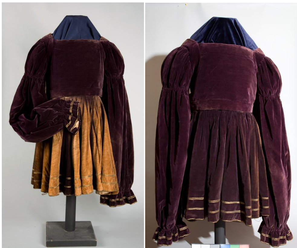
II. 42 Sajjan – spódnica i bluza [przód – tył], XIX w., w zbiorach MNK, nr inw. MNK IX-4108/a,b

mankietem ze zbiorów Matejki – DJM, nr inw. IX/4127). Nakrycie głowy Fryderyka II składa się ze złotej główki (malowanej na podstawie XVII-wiecznej jarmułki żydowskiej , haftowanej srebrną nicią – DJM, nr inw. IX/4228) i czerwonego otoka. Na nogach książę ma złote pończochy i tzw. trzewiki Zygmunta Augusta (DJM, nr inw. IX/4345), wzorowane na modzie renesansu 487 .