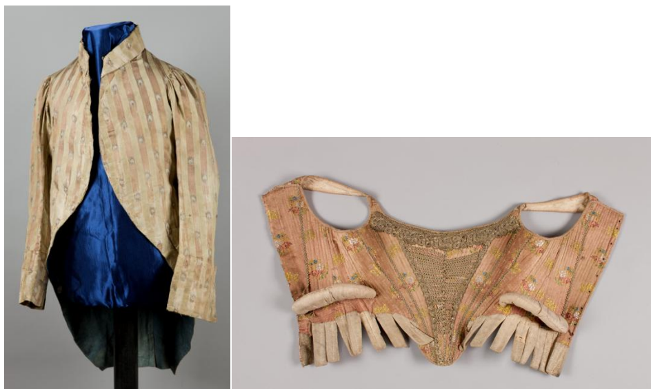
II. 49 Frak [przód], XVIII w., 85 x 94 cm, w zbiorach MNK, nr inw. MNK IX/4283

Pozostała część stroju króla nie wzbudza zastrzeżeń – choć Stanisław August zazwyczaj przyodziewał mundur Szkoły Rycerskiej, to habit á la française wykonany z kremowego, prążkowanego jedwabiu w srebrne listki, w jakim Matejko namalował monarchę, stanowi klasyczny przykład mody końca XVIII w. Był to męski ubiór wierzchni popularny na zachodzie Europy, ze ściętymi połami, długi do kolan, stanowiący komplet z krótką kamizelką, pończochami i spodniami typu culotte (wąskie, sięgające kolan). Strój malowany przez mistrza pochodził z lat 90. XVIII w. (DJM, nr inw. IX-4283) i wykorzystany został kilkakrotnie w Konstytucji 586 .