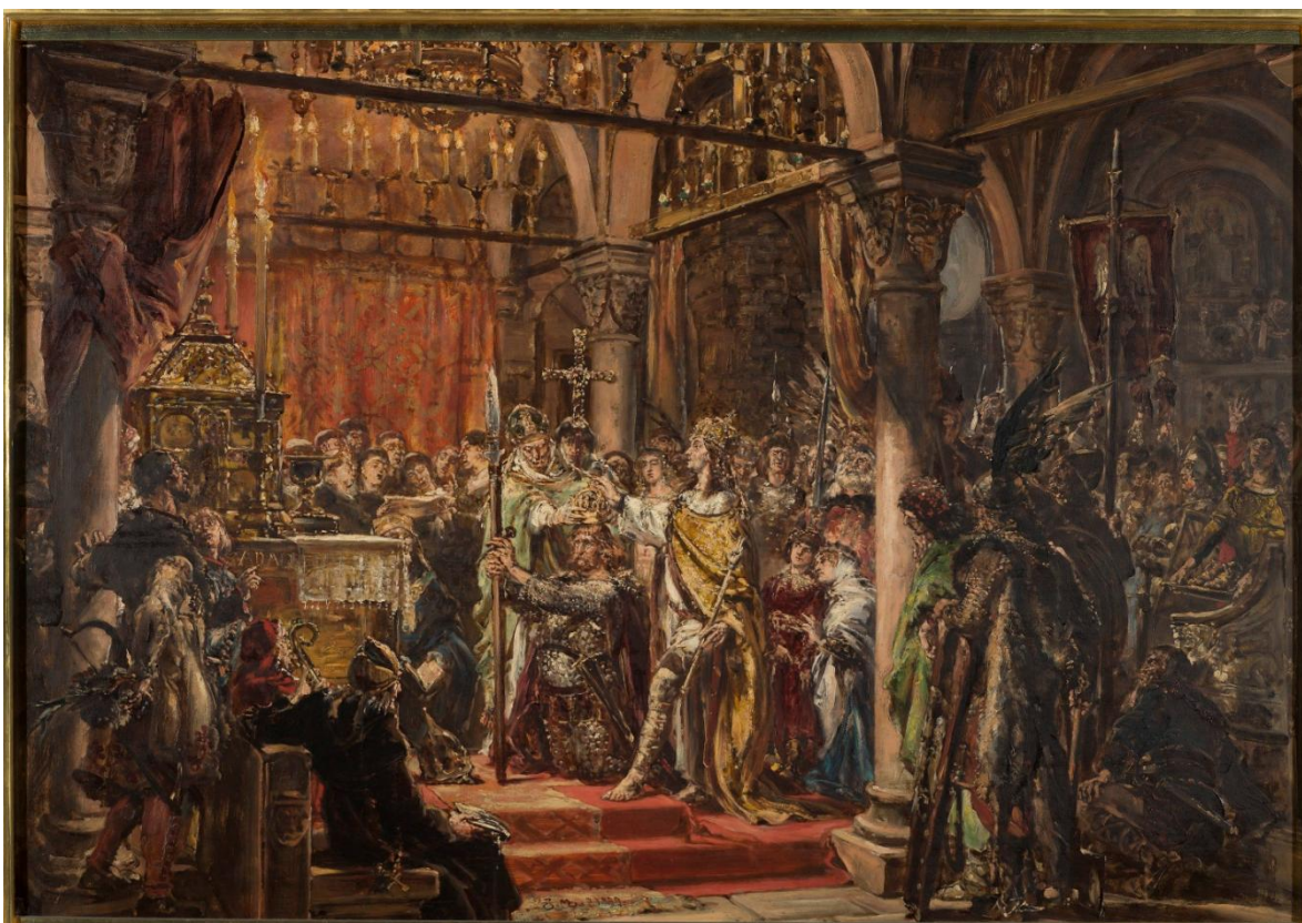
Il. 53 Jan Matejko, Koronacja pierwszego króla R.P.1001 , z cyklu „Dzieje Cywilizacji w Polsce”, 1889, w zbiorach MNW, nr inw. MP 5060

Drugi szkic z cyklu „Dziejów” nosi tytuł: Koronacja pierwszego króla r.p. 1001 (czasem spotykany jako: Pierwsza koronacja; Koronacja Bolesława Chrobrego w Gnieźnie ). Namalowany został w 1889 r. na desce dębowej o wymiarach 71 x 105 cm. Należy do zbiorów MNW – nr inw. MP 5060 (d. 127393). Kolejny etap rozwoju cywilizacji w Polsce związał Matejko z pielgrzymką Ottona III do grobu św. Wojciecha, koronacją Bolesława Chrobrego oraz utworzeniem metropolii w Gnieźnie 676 .