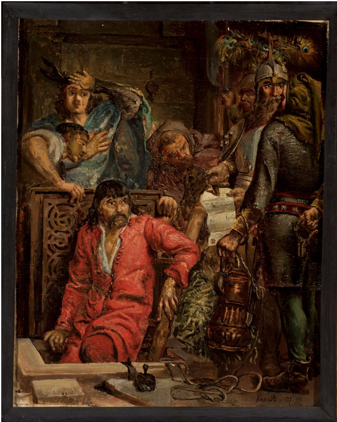
Il. 30 Jan Matejko, Maćko Borkowic (malarz, kopia), 1877, w zbiorach MNW, nr inw. MP 2561

Postać Maćka Borkowica przywodzi na myśl w pierwszej kolejności wydarzenia związane z konfederacją rycerską zawiązaną przez możnowładców wielkopolskich w 1352 r. i skierowaną przeciwko panowaniu starosty. Borkowic jako starosta poznański oraz niejaki Przeclaw z Gułtów jako starosta kaliski zostali przez króla Kazimierza odwołani ze swoich stanowisk. Następnie monarcha powołał Wierzbietę z Panewic na jedynego starostę dla obszaru całej Wielkopolski. Konfederacja zawiązana w 1352 r., na której podpisali się m.in. odwołani starostowie i w której uczestniczyły najsilniejsze rody wielkopolskie (Awdańcowie,