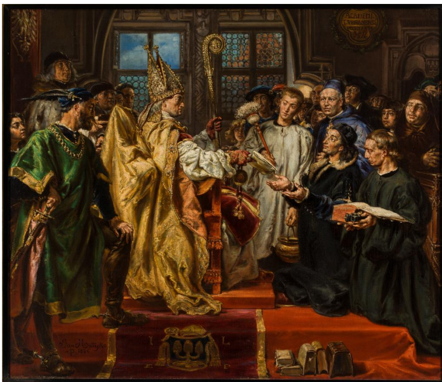
Il. 45 Jan Matejko, Założenie Akademii Lubrańskiego w Poznaniu , 1886, w zbiorach PTPN, nr inw. MNP Mp 57

1886 roku, wykonany został techniką olejną na płótnie o wymiarach 105 x 126 cm. W literaturze napotkać można tytuły: Poświęcenie Akademii Lubrańskich w Poznaniu ; Biskup Lubrański zakłada Akademię Duchowną w Poznaniu ; Założenie Akademii Lubrańskiej w Poznaniu 544 . Znajduje się on w Muzeum Narodowym w Poznaniu, aczkolwiek jest własnością Poznańskiego Towarzystwa Przyjaciół Nauk (nr inw. MNP Mp 57). Tematem dzieła jest podniosłe wydarzenie z 1519 roku – moment utworzenia Akademii Lubrańskiego poprzez wręczenie przez biskupa dokumentu erekcyjnego.