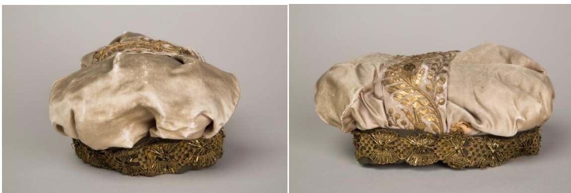
Il. 44 Mitra, XIX wiek, 12 x 26 cm, w zbiorach MNK, nr inw. MNK IX-4233

Natomiast malując strój dwórki towarzyszącej księżniczce Predysławie Matejko wykorzystał mitrę książęcą ze swoich zbiorów (DJM, nr inw. IX/4233) – uszytą z liliowego atłasu, który uformowany jest w dwie bufy, a pośrodku przesyty szeroko złotą nicią; z czarnym wełnianym otokiem, ozdobiony koronką (malarz zmienił w obrazie kolory mitry) 539 . Ponadto pomiędzy głównymi bohaterami obrazu rozmieszczone są postaci drugorzędne – są to wojowie tworzący drużynę Chrobrego, żołnierze i strażnicy tworzący załogę Kijowa, słudzy Predysławy czy ciekawscy mieszkańcy miasta obserwujący wjazd polskiego władcy z blanków muru.