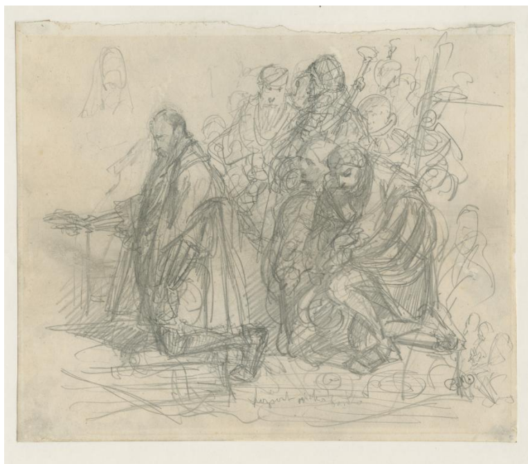
Il. 40 Jan Matejko, Szkic do "Holdu pruskiego", w zbiorach MNP, nr inw. MNP Gr 553

Hold pruski to kompozycja będąca owocem wieloletniej pracy, rozmyślań i przygotowań Matejki. Pierwszy zamysł pojawił się w głowie malarza już w latach młodości. Głównym źródłem inspiracji i wiedzy historycznej była w tym przypadku Kronika Marcina Bielskiego . Matejko chciał, by jego obraz wywarł wrażenie na odbiorcach, by niósł konkretne przesłanie. Pokazuje to także historia z cesarską wizytą w domu artysty w 1880 r., kiedy malarz świadomie i wbrew zaleceniom krakowskich polityków przyozdobił salon obrazami pokazującymi potęgę dawnej Polski, w tym szkicem Holdu pruskiego 440 .