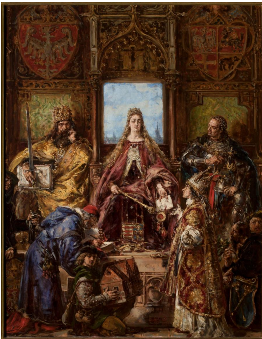
Il. 55 Jan Matejko, Założenie Szkoły Głównej przeniesieniem do Krakowa ugruntowane R.P.1361-1399-1400, z cyklu „Dzieje Cywilizacji w Polsce”, 1888, w zbiorach MNW, nr inw. MP 3896

przeniesione do zakupionych gmachów w centralnej części Krakowa, przy dzisiejszej ulicy św. Anny i ulicy Jagiellońskiej 713 .