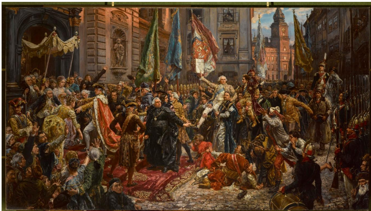
Il. 48 Jan Matejko, Konstytucja 3 maja 1791 , 1891, w zbiorach Zamku Królewskiego w Warszawie – Muzeum, nr inw. ZKW/1105

roku) 572 . Różnorodność odczuć i ocen przypisywana ówczesnym odbiorcom Konstytucji znalazła swoje odzwierciedlenie również w treści matejkowskiego dzieła.