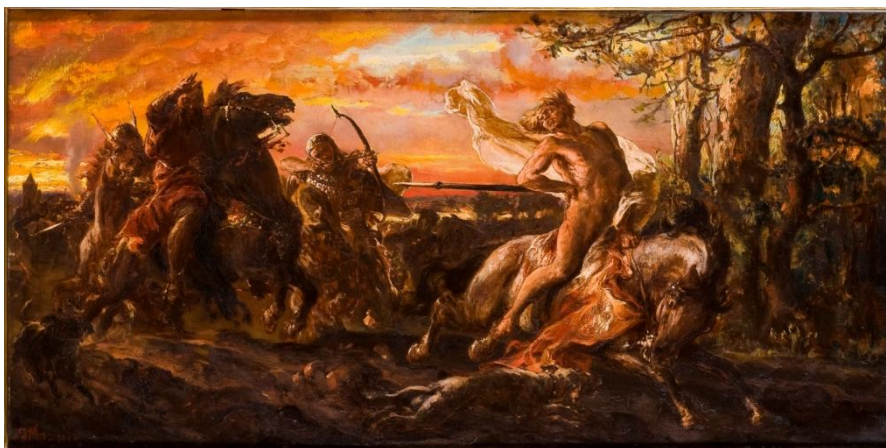
Il. 39 Jan Matejko, Zabicie Leszka Białego w Gąsawie, 1880, w zbiorach MNG, nr inw. MNG/SD/16/M, fot. Pracownia Fotografii

W roku 1880 Jan Matejko powrócił do tematu podjętego kilkanaście lat wcześniej (1866), podczas malowania szkicu Sejm w Gąsawie . Powstał wówczas obraz pt. Zabicie Leszka Białego w Gąsawie (inne tytuły dzieła to: Śmierć Leszka Białego ; Zabicie Leszka Białego konno uciekającego z łaźni w Gąsawie ). Kompozycja wykonana jest farbą olejną na desce o wymiarach 30 x 66 cm; przechowywana jest w zbiorach Muzeum Narodowego w Gdańsku (nr inw. MNG/SD/16/M) 424 . Obraz przedstawia tragiczne konsekwencje zjazdu w Gąsawie w 1227 r. – zamordowanie księcia Leszka Białego przez rycerzy Świętopełka.