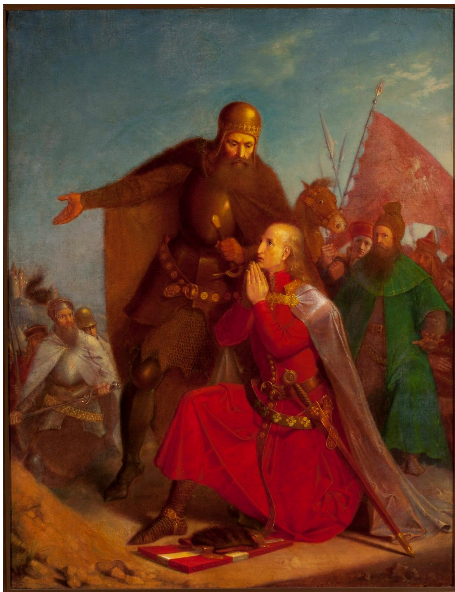
Il. 8 Jan Matejko, Władysław Jagiełło z Witoldem modlący się przed bitwą pod Grunwaldem , 1855, w zbiorach MNW, nr inw. MP 1218

Obraz Władysław Jagiełło i Witold modlący się przed bitwą pod Grunwaldem pochodzący z 1855 r. stanowił pierwszą malarską wizję tematu bitwy pod Grunwaldem, która znajdzie swoje ukoronowanie w wielkoformatowym dziele z 1878 r. Namalowany został na płótnie o wymiarach 79,5 x 62 cm. Inne tytuły dzieła to: Jagiello przed bitwą ; Błogosławieństwo Władysława Jagiełły ; Jagiello z Witoldem ; Władysław Jagiełło modlący się przed bitwą pod Grunwaldem ; Władysław Jagiełło z Witoldem modlący się przed bitwą . Matejko ofiarował obraz bliskiej mu rodzinie Serafińskich z Nowego Wiśnicza. W rękach spadkobierców znajdował się do 1953 r., następnie został zakupiony do zbiorów Muzeum Narodowego w Warszawie (nr inw. MP 1218) 41 .