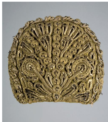
Il. 11 Czepiec, XVIII wiek, 15 x 10 cm, w zbiorach MNK, nr inw. MNK IX-4213, fot. Pracownia Fotograficzna MNK

Na obrazie Matejki królowa przedstawiona jest w fotelu tronowym, w stroju renesansowym – czarno-złotej sukni z głębokim dekoltem i białymi mankietami oraz w narzuconej na suknię czarnej szubie, włosy ma ujęte w złotą siatkę (zwaną crinale ), także charakterystyczną dla renesansowej mody. Namalowana była na podstawie dwudzielnego, złotego czepca żydowskiego wykonanego z koronki szychowej (DJM, nr inw. IX/4213; wykorzystany ponownie w stroju Piotra Opalińskiego w Holdzie pruskim ). Dekolt sukni wzorowany był na innym żydowskim czepcu (stanowiącym własność prywatną, zachowało się jego studium z roku 1857). Elementy stroju mógł artysta wzorować na płaskorzeźbie pochodzącej z 1534r. i przedstawiającej małżonków Przybyłów (którą malarz szkicował – DJM, nr inw. IX/4251), ubiór królowej znany jest także z portretu królowej Bony autorstwa Lucasa Cranacha (ok. 1556), choć nie ma pewności, czy Matejko widział to dzieło 77 .