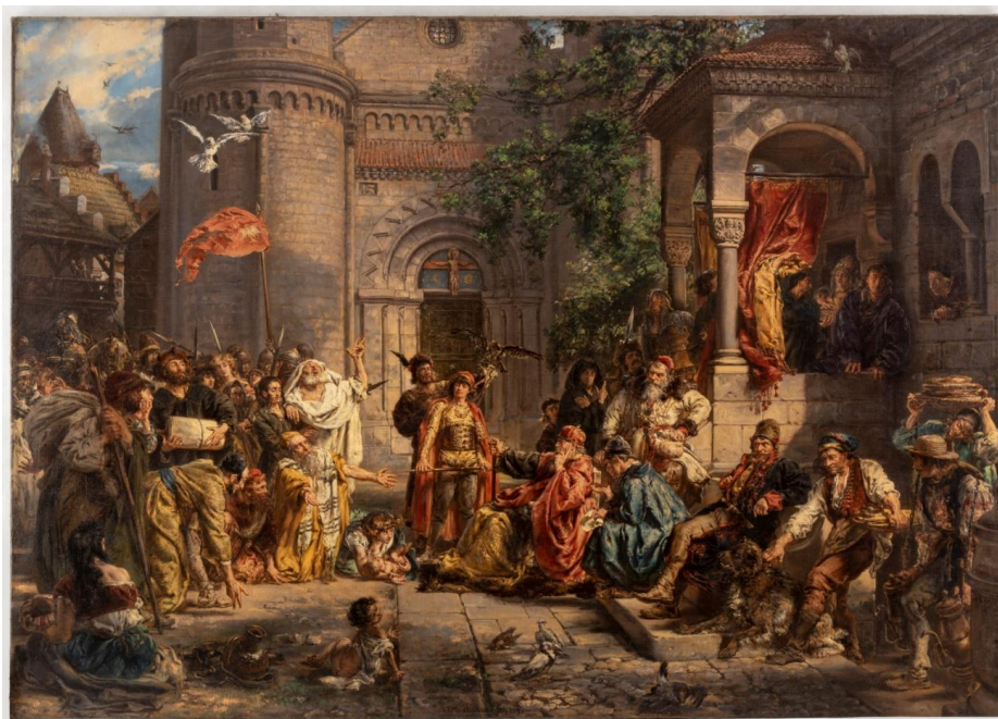
Il. 54 Jan Matejko, Przyjęcie Żydów do Polski , 1889, w zbiorach MNL, nr inw. S/Mal/799/ML

Trzeci szkic „Dziejów cywilizacji w Polsce” to Przyjęcie Żydów r.p. 1096 , pochodzący z 1889 r. Namalowany jest na płótnie o wymiarach 76 x 112 cm. Inne tytuły szkicu to: Przyjęcie Żydów do Polski w r. 1096 ; Przyjęcie Żydów do Polski za Władysława Hermana ; Sprowadzenie Żydów . Obraz należy do zbiorów MNW – nr inw. MP 133 MNW (d. 127394). Ten trzeci szkic z cyklu doczekał się realizacji w postaci dzieła pełnego formatu. Obraz ukończony nosi tytuł: Przyjęcie Żydów w Polsce (bądź: Przyjęcie Żydów do Polski ; Przyjęcie Żydów przez Władysława Hermana ; Przyjęcie Żydów do Polski w roku 1096 ). Namalowany został w 1889 r. farbą olejną na płótnie o wymiarach 140,5 x 199 cm (obecnie w ramie: 183 x 255 cm). Należy do zbiorów Muzeum Narodowego w Lublinie, nr inw. S/Mal/799/ML. Szkic i wersja końcowa dzieła różnią się drobnymi tylko szczegółami 690 .