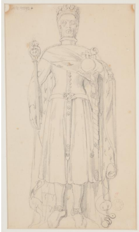
Il. 35 Jan Matejko, Studium postaci Władysława Jagiełły z nagrobka króla w katedrze na Wawelu, 1855-1860, rysunek, ołówek, w zbiorach MNK, nr inw. MNK IX-1482

Mężczyzna upadający na ziemię u stóp Witolda to Konrad VII Biały starszy (po 1396-1452), książę oleśnicko-kozielski. Wychowany był na dworze krakowskim, później uczył się rycerskiego rzemiosła w Prusach, będąc gościem Zakonu. Pod Grunwaldem walczył po stronie Krzyżaków. W czasie bitwy wzięty do niewoli, wykupiony z niej został w czerwcu 1411 r. przez Zakon Krzyżacki. W kolejnych latach życia uczestniczył w walkach zarówno po stronie polskiej (np. w 1414 r. walczył przeciwko Krzyżakom, w 1442 r. uczestniczył w bitwie pod Legnicą), jak i przeciwko niej (w 1416 r. zawarł antypolskie porozumienie z wielkim mistrzem, w 1423 r. sprzymierzył się z książętami śląskimi, Zakonem i Zygmuntem Luksemburskim przeciw Polsce) 386 .