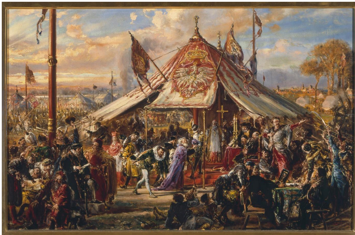
Il. 57 Jan Matejko, Potęga Rzeczypospolitej u zenitu , z cyklu „Dzieje Cywilizacji w Polsce”, 1889, w zbiorach MNW, nr inw. MP 5057, fot. Piotr Ligier

powstała być może pod koniec 1888 r., albo w styczniu bądź lutym 1889 r., kiedy powstawały szkice odnoszące się do początków cywilizacji 812 .