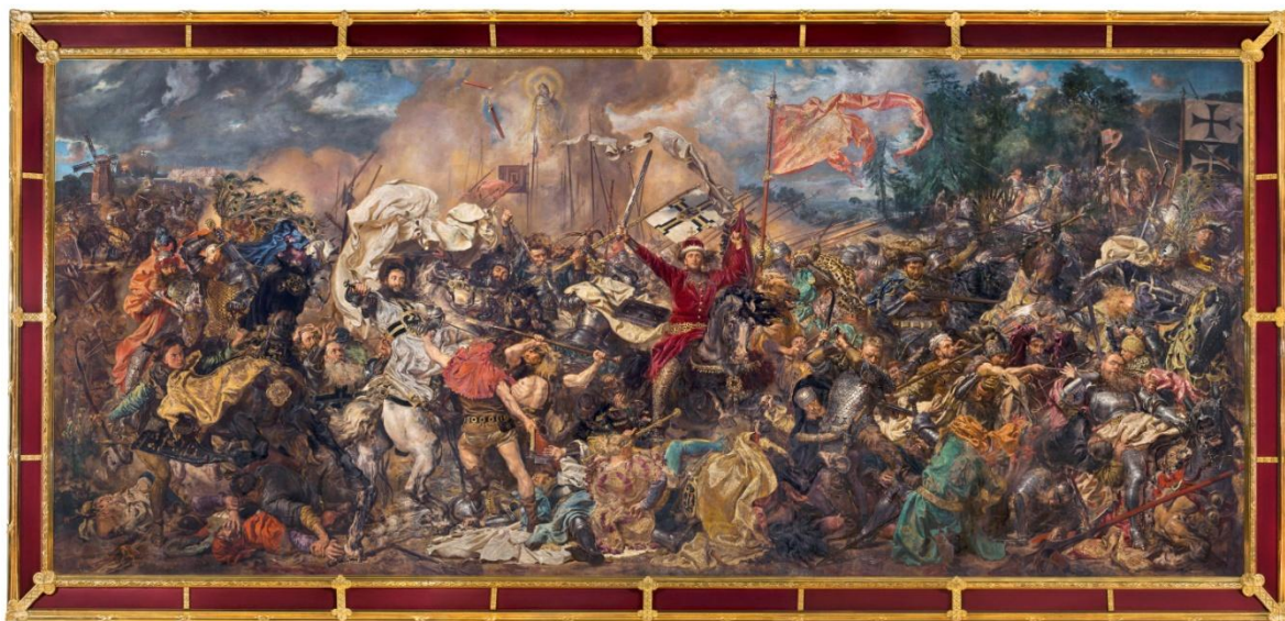
II. 33 Jan Matejko, Bitwa pod Grunwaldem , 1878, w zbiorach MNW, nr inw. MP 443

Tematyka batalistyczna cieszyła się w XIX wieku długo niesłabnącą popularnością, zajmując istotne miejsce także w twórczości krakowskiego mistrza 353 . Ogromne wymiary płótna pozwoliły na stworzenie wielkiego widowiska, przedstawienie nie tylko zacieklej walki, lecz zarazem spektakularnego sukcesu wojsk zjednoczonych wokół narodu polskiego – „wymowa kłębowiska zwartych w śmiertelnym uścisku ciał ludzkich i koni została złagodzona ukazaniem blasku chwały i potęgi rycerstwa (wszak wojna była także szansą na pokazanie swoich umiejętności, waleczności czy bogactwa), przepychu wspaniałych strojów i barw, pięknych zbroi i kunsztownej broni, podniosłej atmosfery zwycięstwa” 354 .