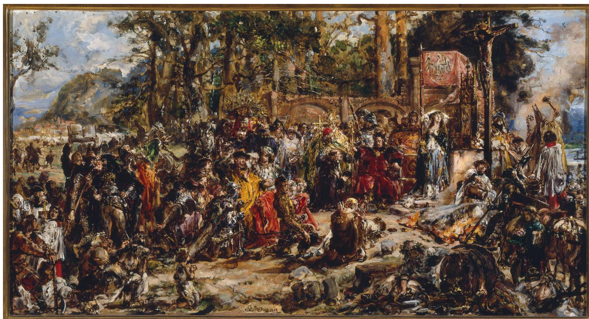
Il. 56 Jan Matejko, Chrzest Litwy, z cyklu „Dzieje Cywilizacji w Polsce”, 1888, w zbiorach MNW, nr inw. MP 442

Szkic przedstawia syntezę działań Władysława Jagiełły związanych z procesem chrystianizacji Litwy, a rozpoczętych podczas wyprawy królewskiej na Litwę w r. 1387. Fundamentem dla tej działalności była unia polsko-litewska w Krewie (1385), małżeństwo Jagiełły z Jadwigą i jego koronacja na króla Polski. Jednocześnie chrzest Litwy stanowi konsekwencję cywilizacyjnego przełomu, jakim dla Polski było założenie akademii krakowskiej i możliwy dzięki temu rozkwit nauki i kultury. Chrystianizacja Litwy, podobnie jak wcześniej zajęcie i chrystianizacja Rusi (stanowiące temat VI szkicu „Dziejów” – Powtórne zajęcie Rusi. – Bogactwo i oświata. R. P. 1366 ), wpisują się w misję cywilizacyjną Polski 793 .