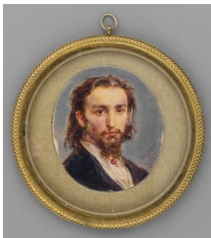
Il. 2 Jan Matejko, Autoportret Jana Matejki, 1867, w zbiorach MNW, nr inw. Min.589