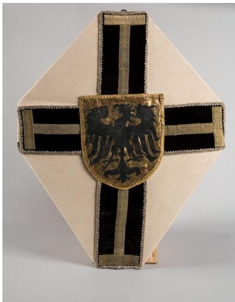
Il. 34 Krzyż wielkiego mistrza krzyżackiego zrobiony wg projektu Matejki (z Kroniki Długosza), XIX wiek, 71 x 58 cm, w zbiorach MNK, nr inw. MNK IX-4257

Jedną z najstaranniej potraktowanych przez Matejkę postaci jest Ulryk (Ulrich) von Jungingen (zm. 1410), od 1407 r. wielki mistrz Zakonu Krzyżackiego, pod Grunwaldem dowodzący wojskami krzyżackimi. Malarz pieczołowicie odtworzył strój wielkiego mistrza. Właściwie typowy ubiór rycerza Zakonu Krzyżackiego na obrazie Bitwy pod Grunwaldem nosi jedynie on. Ulryk von Jungingen odziany jest w zbroję wzorowaną na renesansowej, nie ma na głowie hełmu, a na zbroję założoną ma białą tunikę herbową , niezszytą po bokach, bez rękawów, z krzyżem wielkiego mistrza na piersi – jakim był czarno-złoty krzyż z czarnym orłem (malowany wg kroniki Długosza; krzyż taki, naszyty na tarczę z białego materiału, sporządzony zgodnie z projektem Matejki przed 1878, zachował się w DJM, nr inw. IX-4257), jakkolwiek krój tej tuniki bardziej przypomina obszerne stroje z XIII niż XV stulecia 383 .