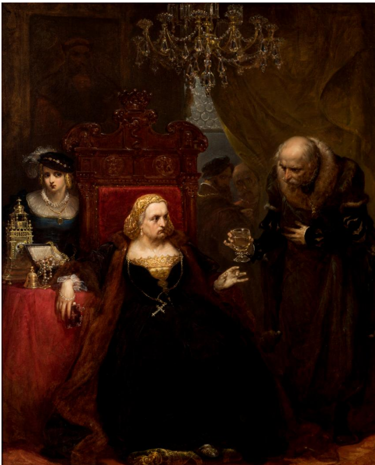
Il. 10 Jan Matejko, Otrucie królowej Bony, 1859, w zbiorach MNK, nr inw. MNK II-a-1321

Do obrazów malowanych w stylu genre historique należy Otrucie królowej Bony z 1859 r. Dzieło malowane jest techniką olejną na płótnie o wymiarach 78 x 63 cm. Inne tytuły dzieła to: Otrucie Bony – królowej Polski ; Otrucie królowej Bony w Bari we Włoszech ; Otrucie królowej Bony przez jej lekarza Antoniego z Maceraty . Obraz znajduje się w zbiorach Muzeum Narodowego w Krakowie (nr inw. MNK II-a-1321). Przedstawia moment podania Bonie kielicha z trucizną przez Antoniego z Maceraty. Świadcami tragicznego wydarzenia jest dwórka królowej i dwaj mężczyźni.