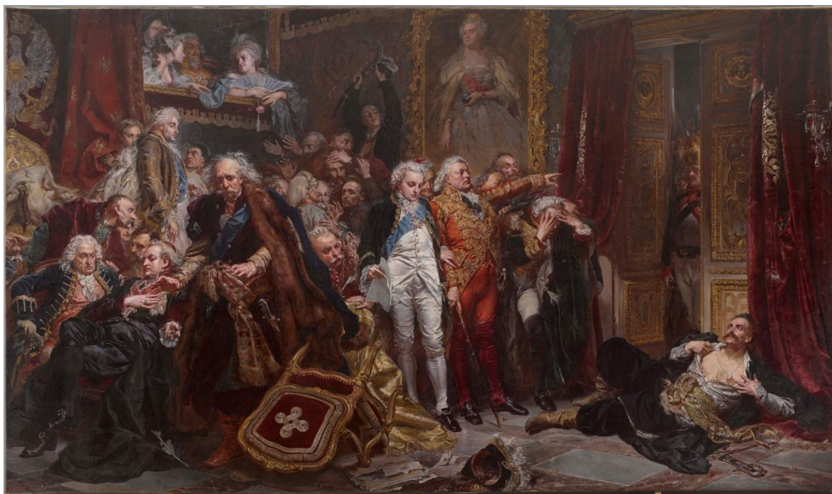
Il. 17 Jan Matejko, Rejtan. Upadek Polski, 1864-1866, w zbiorach Zamku Królewskiego w Warszawie – Muzeum, nr inw. ZKW/1048

Po Kazaniu Skargi (omówionym pod poz. 7) kolejnym wielkoformatowym dziełem Matejki był Rejtan – Upadek Polski (1866), znajdujący się obecnie w zbiorach Muzeum Zamku Królewskiego w Warszawie (nr inw. ZKW/1048). Inne tytuły dzieła to: Rejtan na sejmie warszawskim 21 kwietnia 1773r. , Rejtan na sejmie warszawskim , Sejm warszawski , Sejm Ponińskiego . Obraz namalowany jest farbą olejną na płótnie o wymiarach 282 x 487 cm 144 . Rejtan stanowił niejako kontynuację rozrachunkowej myśli zawartej w Kazaniu Skargi , w przeciwieństwie jednak do sukcesu Skargi , łączonego z uznaniem w Matejce narodowego malarza historycznego, Upadek Polski potraktowany został przez polskich odbiorców (urazonych w swej narodowej dumie) bardzo krytycznie, czego owocem będzie namalowany przez rozgoryczonego artystę Wyrok na Matejkę .