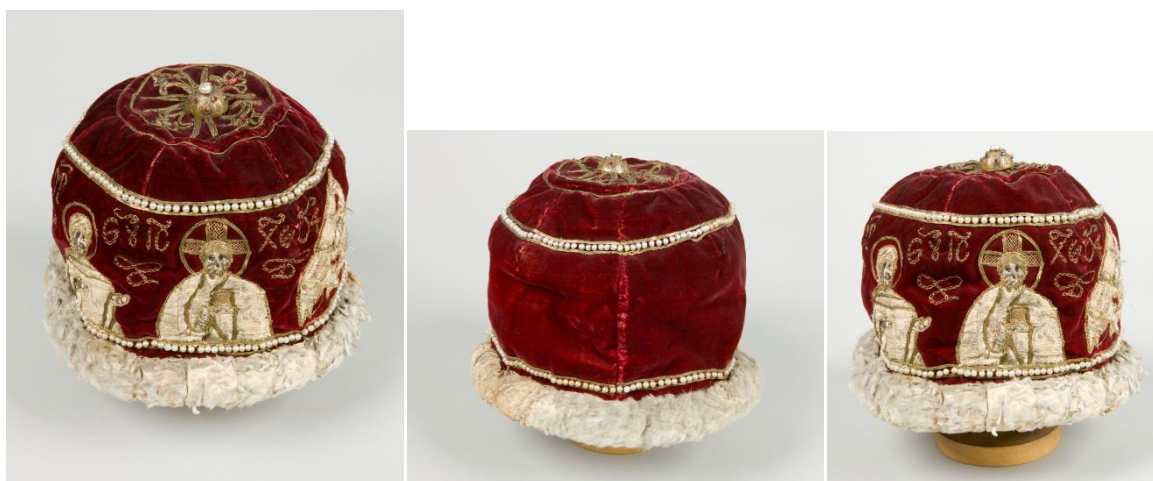
Il. 28 Czapka, XIX w., 22,0 x 32,0 cm, w zbiorach MNK, nr inw. MNK IX-4234

W pierwszym rządzie poselstwa klęczy władca połocki Cyprian . Podaje królowi Batoremu tacę z chlebem i solą, która ma być symbolem zawieranego pokoju. Chociaż klęczy przed polskim monarchą jako pokonany, władca Cyprian zachowuje postawę pełną powagi i godności. Matejko namalował jego strój z wielką pieczołowitością. Władca Cyprian ma na głowie mitrę uszytą z czerwonego aksamitu, obszytą wokół białym futrem, ozdobioną wyhaftowanymi złotą nicią wizerunkami cherubinów i świętych. Mitra taka została uszyta dla Matejki wg jego projektu, wykonanego w oparciu o Starożytności państwa rosyjskiego autorstwa Fiodora Sołncewa (DJM, nr inw. IX/4234) – wzorem była mitra wielkksiążęca albo arcybiskupia z soboru św. Zofii w Nowogrodzie (malarz wykorzystał ją także w Grunwaldzie i kompozycji Bolesław Chrobry ze Światopełkiem przy Złotej Bramie ). Władca połocki ubrany jest we wzorzystą kape – tu wzorem była kapa z XVIII w., wykorzystywana w liturgii Kościoła katolickiego 335 .