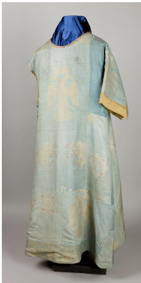
Il. 32 Suknia [dalmatyka], XVIII w., 224 x 118 cm, w zbiorach MNK, nr inw. MNK IX/4268

Malując obraz Śmierć Przemysława w Rogoźnie , Matejko dołożył starań, aby podkreślić majestat króla – zaskoczony prawdopodobnie we śnie władca nie miał na głowie korony ani zdobnych szat. Przemysł II przedstawiony jest w trakcie walki wewnątrz zamkowej komnaty, w ręku ma ułamany miecz, lecz mimo przewagi i bliskiego już sukcesu wroga, próbuje jeszcze stawiać opór – tym bardziej, że ochronić chce swoją żonę i córeczkę, stojące za jego plecami.