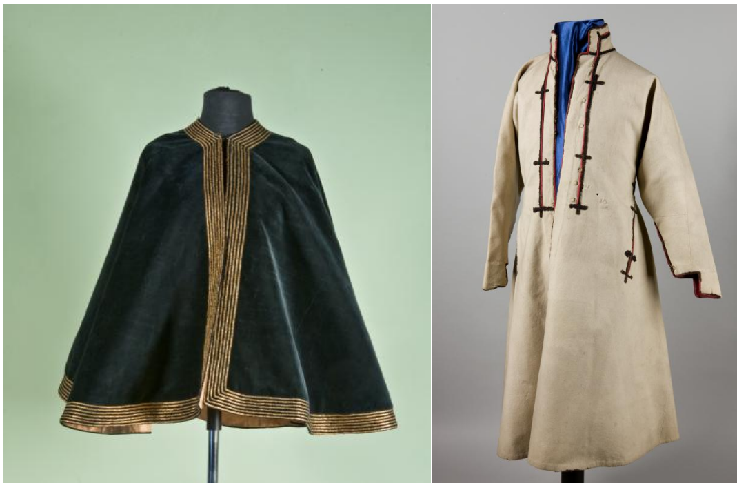
Il. 23 Peleryna, XIX wiek, 75 x 135 cm, w zbiorach MNK, nr inw. MNK IX-4020, fot. Pracownia Fotograficzna MNK

Jan Kostka (ok. 1529-1581) był dworzaninem i sekretarzem królewskim, później podskarbisem ziem pruskim, kasztelanem gdańskim, wojewodą sandomierskim. Jako znawca sprawy pruskiej i kwestii morskich stanął na czele Komisji Morskiej, brał także udział w tworzeniu floty wojennej. Kandydaturę Jana Kostki na króla Polski wysuwano dwukrotnie (1574, 1575) 280 . Jego ciemny ubiór uzupełniony jest krótką aksamitną pelerynką w kolorze ciemnej zieleni (DJM, nr inw. IX/4020), wykończoną wzdłuż brzegu bordiurą ze złotego sutaszu (na tej pelerynce wzorował się malarz także komponując strój pазia) 281 .