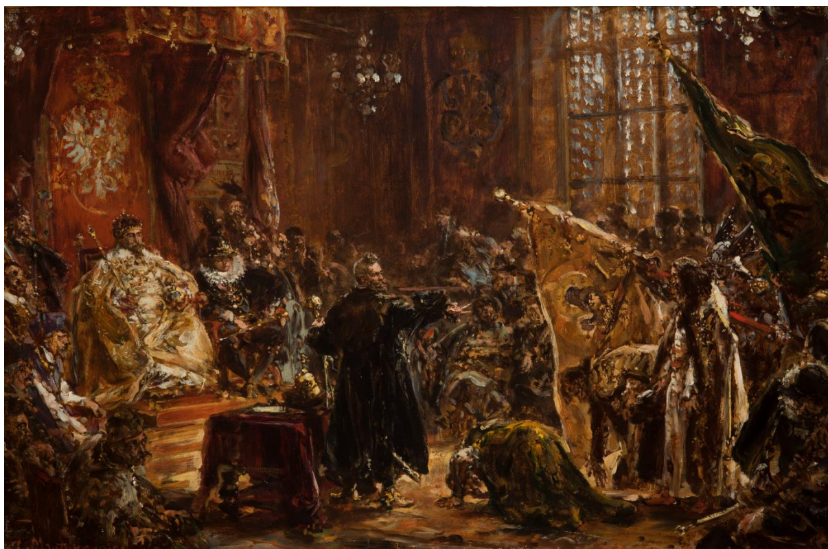
Il. 51 Jan Matejko, Carowie Szujscy na sejmie warszawskim , 1892, w zbiorach MNK, nr inw. MNK IX-1, fot. Karol Kowalik

wziętego do niewoli cara Wasyla Szujskiego i braci jego oraz zdobyte sztandary w r. 1611 oraz Żółkiewski stawiający cara Wasyla Szujskiego z braćmi na sejm w Warszawie wobec króla Zygmunta III i Władysława IV 611 . Porównanie dwóch wersji obrazu wykonanych w odstępie 39 lat – na początku i u schyłku jego artystycznej kariery – pozwala dostrzec jak znacząco rozwinął się talent artysty i jak bardzo na przestrzeni lat zmienił się styl jego malarstwa.