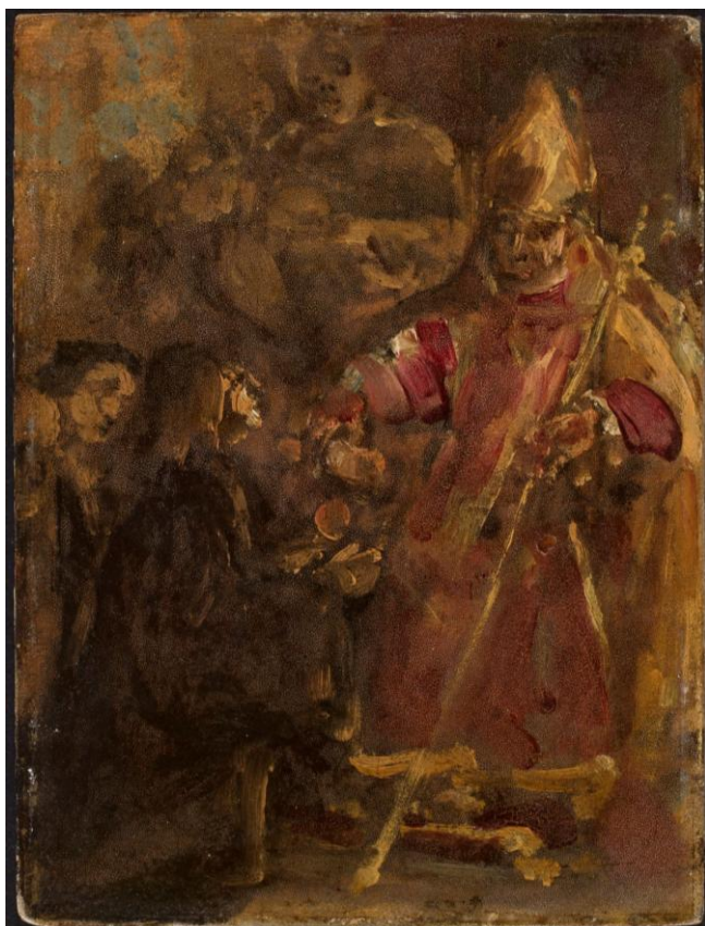
Il. 46 Jan Matejko, Biskup Lubrański zakłada Akademię Duchowną w Poznaniu , szkic, 1886, w zbiorach MNW, nr inw. MP 1249, fot. Krzysztof Wilczyński

Poznaniu; Biskup Lubrański funduje Akademię Poznańską; Biskup Lubrański zakłada Akademię w Poznaniu; Biskup Lubrański zakłada seminarium w Poznaniu ) z 1886 r., namalowany został na tekturze o wymiarach 23,8 x 17,8 cm. Znajduje się on w MNW (nr inw. MP 1249), został zakupiony od Bogdana Gorzkowskiego w 1939 r. Szkic ten wykonany był w pionowym formacie, przedstawia głównych bohaterów – Jana Lubrańskiego i Jana ze Stobnicy. W ostatecznej wersji obrazu Matejko zmienił jednak układ kompozycyjny 549 .