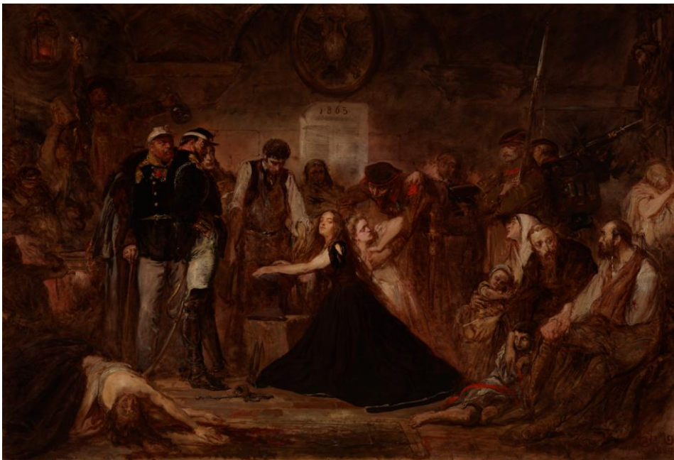
Il. 1 Jan Matejko, Zakuwana Polska, 1864, w zbiorach MNK, nr inw. MNK-MKCz XII-453