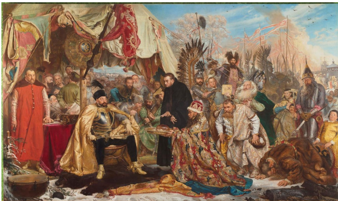
Il. 25 Jan Matejko, Stefan Batory pod Pskowem, 1872, w zbiorach Zamku Królewskiego w Warszawie – Muzeum, nr inw. ZKW/1047

Batory pod Pskowem stanowi historiozoficzną wizję stworzoną przez Matejkę. Jest syntezą wydarzeń związanych z: wyprawami wojennymi króla Stefana Batorego przeciwko państwu moskiewskiemu w l. 1579-1581, walką o Inflanty, poselstwem moskiewskich bojarów po zdobyciu Wielkich Łuków, oblężeniem Pskowa, prośbą o pokój cara Iwana IV Groźnego (wniesioną z wykorzystaniem pośrednictwa papieża Grzegorza XIII), pertraktacjami pokojowymi, rozejmem zawartym w 1582 r. Malarz połączył te wydarzenia w jedną wizję. Obraz przedstawia bojarów moskiewskich proszących króla o pokój pod Pskowem – choć monarcha nie był tam wówczas obecny, pokój zawarto w Jamie Zapolskim, a delegacja bojarów podążała za królem z początkiem 1581 r., lecz nie prosiła wtedy o zawarcie pokoju.