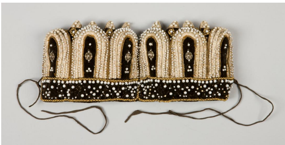
Il. 43 Bindy żydowskie [sterntichel], XIX w., 15,0 x 32,0 cm, w zbiorach MNK, nr inw. MNK IX-4236

Księżna Anna przedstawiona jest jako starsza kobieta. Jej korona została namalowana na wzór dwóch par połączonych bind żydowskich . Bindy, stanowiące uzupełnienie kobiecego czepca, wykonane są z czarnego aksamitu, na kształt zaokrąglonych długich zębów, ozdobione koralikami i łańcuszkiem. Pochodziły z XIX w. i należały do zbiorów Matejki (DJM, nr inw. IX/4236). Artysta wykorzystał je także w innych dziełach w roli korony ślubnej ( Ślub Kazimierza Jagiellończyka z Elżbietą Austriaczką ) i diademem książęcego ( Św. Kinga , 1892) 503 .