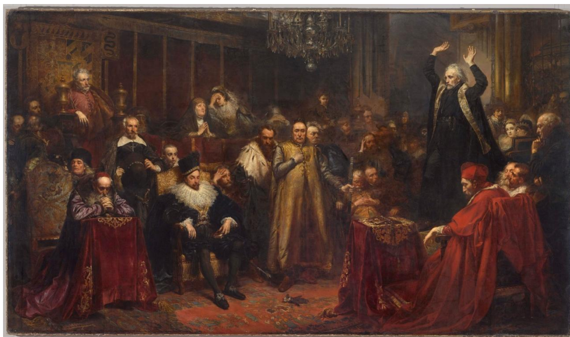
II. 12 Jan Matejko, Kazanie Skargi, 1862-1864, w zbiorach Zamku Królewskiego w Warszawie – Muzeum, nr inw. ZKW/2048

Pierwszym wielkoformatowym dziełem Jana Matejki było Kazanie Skargi , malowane w latach 1862-1864 w pracowni artysty przy ulicy Krupniczej, przy wykorzystaniu sztalugi sporządzonej według „własnego pomysłu”. Obraz wykonany został techniką olejną na płótnie o wymiarach 224 x 397 cm. Obecnie znajduje się w Muzeum Zamku Królewskiego w Warszawie (nr inw. ZKW/2048) w ekspozycji stałej Galerii Malarstwa Polskiego 89 . Najważniejszym motywem obrazu są Kazania sejmowe i wygłoszona przez księdza Piotra Skargę przepowiednia o upadku Rzeczypospolitej. Podobnie jak w późniejszych wielkich historycznych płótnach, tak i tutaj ujawnia się specyficzna cecha twórczości malarza polegająca na łączeniu w jednej scenie wielu wątków składających się na proces dziejowy – w rzeczywistości nie miał miejsca sejm obradujący w przedstawiony na obrazie sposób 90 .