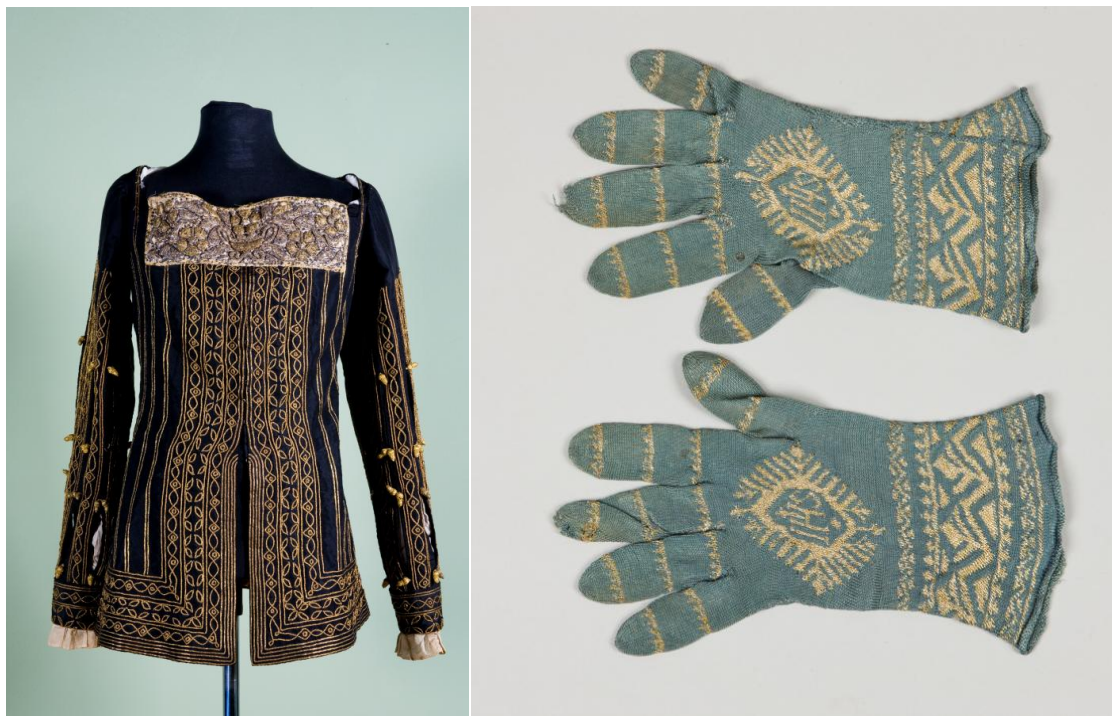
Il. 21 Kaftan męski, XIX w., z naszytą żydowską atarą XVII/XVIII w., 72,0 x 132,0 cm, w zbiorach MNK, nr inw. MNK IX-4119