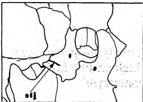
Rys. 1. Lokalizacja szczeliny tylno-jarzmowej (st) na czaszce

-jarzmowy formuje się w rezultacie niecałkowitego wrośnięcia wyrostka jarzmowego kości skroniowej w wycięcie kości jarzmowej w okresie prenatalnym. O ile szew poprzeczny kości jarzmowej obserwuje się bardzo rzadko, to szew tylnojarzmowy względnie częściej i w szerokim zakresie wahań międzypopulacyjnych. Fakt ten czyni szew tylnojarzmowy cechą wysoce wartościową w badaniach populacyjnych w antropologii etnicznej. KOZINCEV [1984] przeanalizował różnice międzypopulacyjne, dymorfizm płciowy, różnice wynikające z wieku osobnika i asymetrię w częstości występowania szwu tylnojarzmowego na czaszce, a także związek tej cechy z kranjologicznymi wartościami metrycznymi na materiale 2166 czaszek z różnych grup etnicznych.