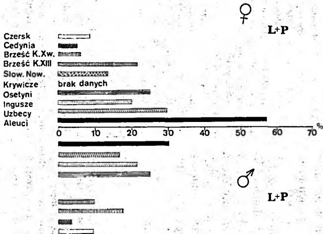
Rys. 4. Częstość występowania szwu tylnego-żarzmowego po stronie lewej i prawej łącznie w każdej z pld