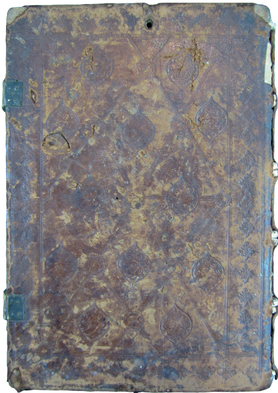
Ryc. 1. Archiwum Archidiecezjalne w Gnieźnie, rękopis, sygn. MS 1020, oprawa – dolna okładzina.