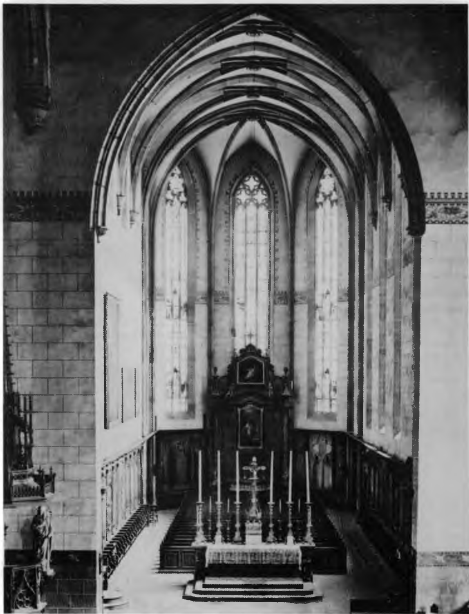
3. Colmar, Dominicains. L'intérieur du choeur. (D'après Roland Recht, op. cit.)