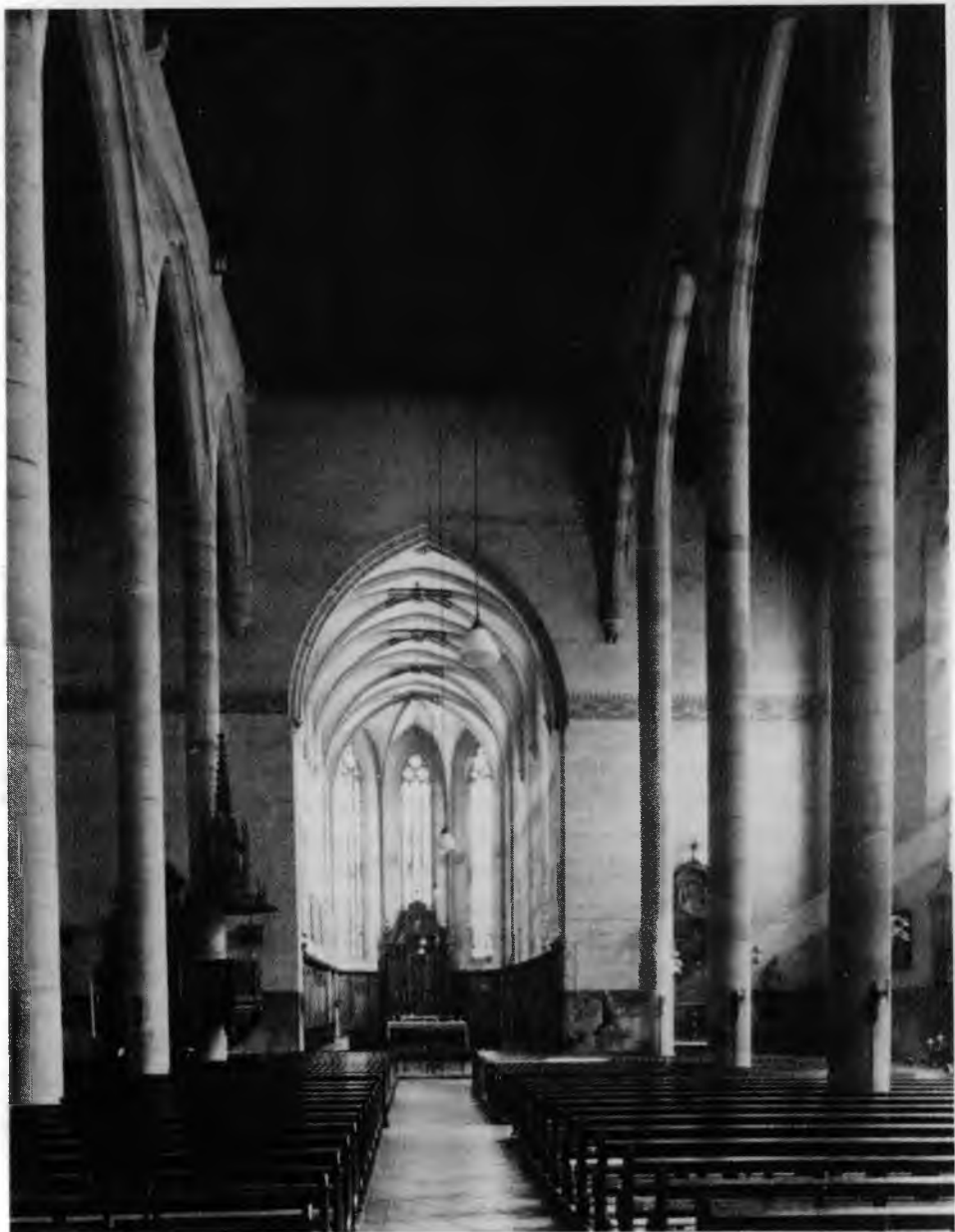
1. Colmar, Dominicains, Vue de la nef vers l'est. (D'après Norbert Nußbaum, Deutsche Kirchenbaukunst der Gotik , Köln 1985)

Les arcades entre la nef et les bas-côtés sont aussi plus hautes des murs extérieurs des bas-côtés. Vu cette proportion de la hauteur des murs encerclants et de ceux qui sont entre les vaisseaux, les bas-côtés ne pou-