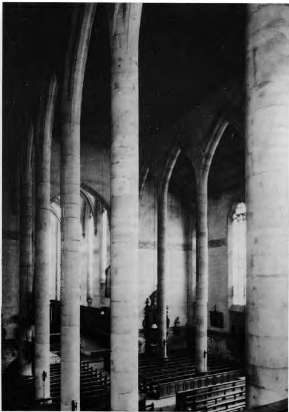
4. Colmar, Dominicains. L'intérieur de la nef. (D'après Roland Recht, op. cit.)