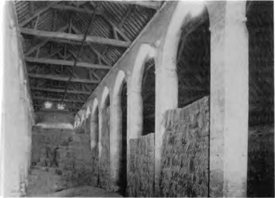
7. Vaulerent, Vue intérieure de la grange (D'après Walter Horn, Ernest Born, op. cit.)

nité sont traitées comme ennemi de l'esprit 22 , elles possèdent dans le sens ecclésiologique une valeur positive, elles servent à l'élargissement de l'Église. Le verbe acervo – ramasser, réunir, aggrandir – fait explicitement appel aux connotations ecclésiologiques. Ainsi le rapport le Christ/l'Église exprime la relation union/pluralité.