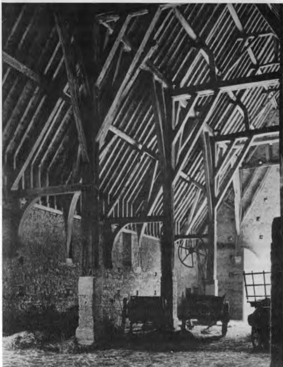
8. Parçay Meslay (Indre-et-Loire), Vue intérieure de la grange cistercienne (D'après Walter Horn, Ernest Born, The Plan of St. Gall , Berkeley-Los Angeles-London 1979)

à l'organisation médiévale de la réalité, désignée par la formule ora et labora divisant la société en oratores et laboratores . De la tradition indoeuropéenne est repris le troisième élément bellatores , ceux qui