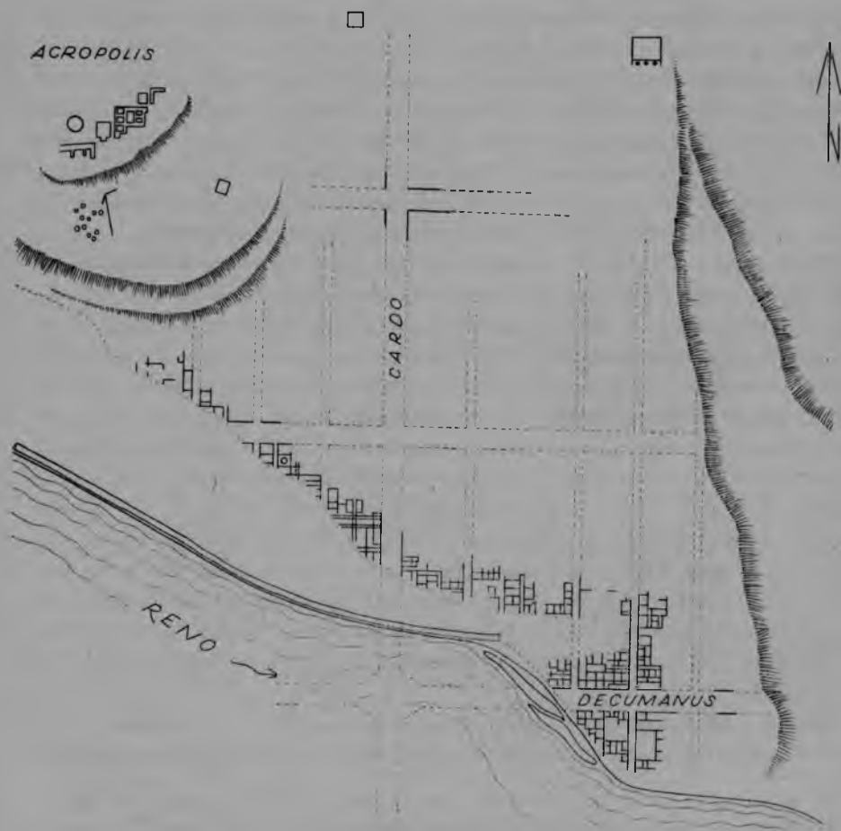
Ryc. 3. Marzabotto (północne Włochy). Miasto etruskie typu hippodamejskiego (według J. Heurgon, Życie codzienne Etrusków... oprac. A. Niesiołowska-Wędzka)

Z elementów nas interesujących należy wymienić sytuowanie miast na stoku o ekspozycji południowej lub wschodniej, regularna siatka ulic, dzieląca teren zabudowy na bloki o proporcjach zbliżonych do kwadratu lub częściej wydłużonego prostokąta, podzielone na jednakowe działki. Zarys murów był dostosowany do rzeźby terenu, a miasto podzielone na strefy o określonym