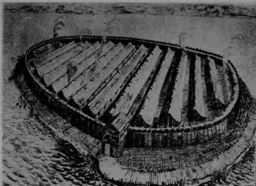
Ryc. 1. Biskupin, woj. bydgoskie. Rekonstrukcja grodu „typu biskupińskiego” (według W. Hensla, Polska starożytna... )

W obrębie do tej pory odkopanych grodów nie natrafiono jeszcze na żadne budynki, których rozmiary czy wyposażenie w wyraźny sposób wyróżniałyby się sugerując, że stanowiły one własność jakiejś jednostki wybijającej