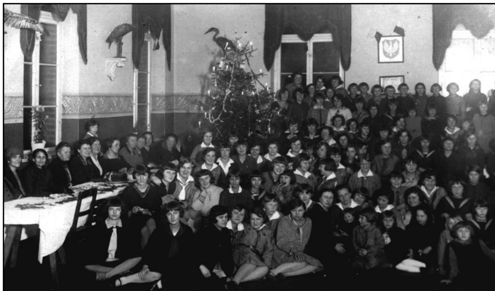
Oplątek w szkole przy ul. Ogrodowej.

szkoły mieściły się przy ulicy Sienkiewicza, trzy zaś w budynku szkoły ewangelickiej przy Placu Kościuszki 35 .