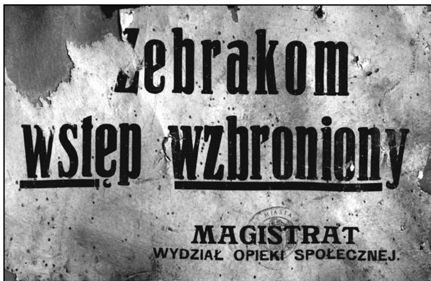
Tabliczka „Żebrakom wstęp wzbroniony” z pieczęcią Magistratu Miasta Pleszewa.

stratu było zaś zabezpieczenie sklepów i innych lokali przemysłowych od chodzenia przez żebraków 59 .