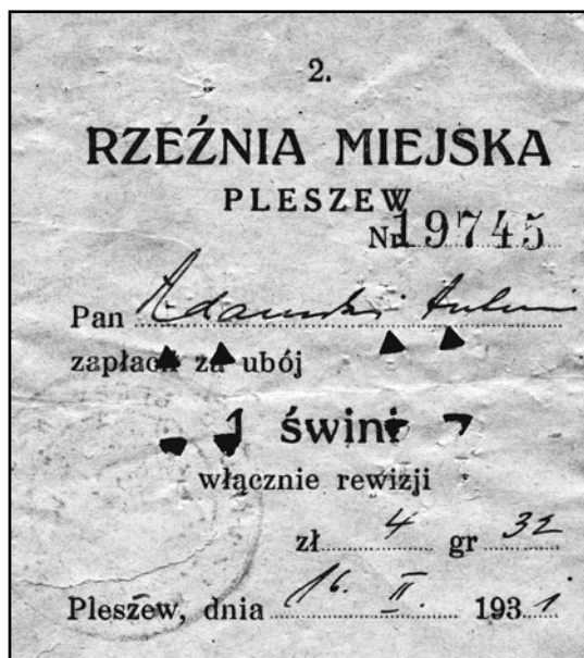
Potwierdzenie zapłaty za ubój w pleszewskiej rzeźni z roku 1931.

podatki. W sierpniu 1920 roku podatek za psa podwórzowego wynosił 15 mkp, drugiego podwórzowego – 30 mkp, luksusowego – 100 mkp, a za każdego następnego luksusowego psa – 150 mkp. Natomiast w grudniu 1921 dzierżawa za używanie cel więziennych w ratuszu wynosiła 6.000 mkp rocznie. Miasto czerpało również dochody z podatku gruntowego, budynkowego, od wyszynków i drobnej sprzedaży trunków, od oświetlenia elektrycznego w lokalach z wyszynkiem alkoholu, od lokalu, od zbytku mieszkaniowego, od prawa polowania, hotelowego, od samochodów, od publicznych zabaw i rozrywek, opłaty targowe, opłaty za wodę, straż ogniową, opłaty w rzeźni, połączenia wodociągowe i kanalizacyjne, czyszczenie ulic. Koszt utrzymania chorego w zakładzie św. Józefa oscylował na poziomie 8 mkp dziennie (lipiec 1920 rok). Z uwagi na wysoką inflację, stawki podatków, opłat, dzierżaw itp. ulegały częstym zmianom. Kompetencje do zmian posiadała rada miejska na wniosek magistratu.