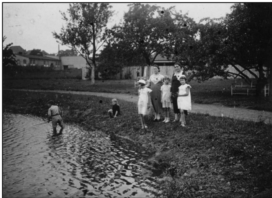
Lata trzydzieste XX wieku. Staw rybny w ogrodzie miejskim przy ul. Ogrodowej.

Pojawiały się również propozycje by w parku miejskim zbudować dwutorową kręgielnię (koszt wybudowania oszacowano na 4.639,26 zł.). Do przedsięwzięcia