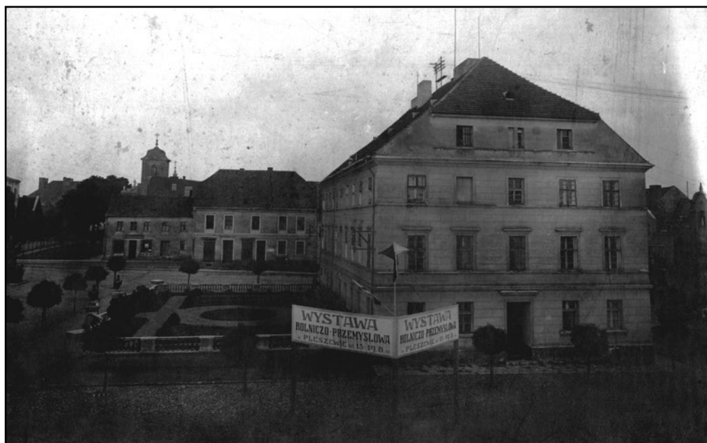
Rok 1925. Pleszewski Rynek wraz z ratuszem. Zdjęcie przedstawia Rynek po przebudowie – wyburzone zostały stare domy, które znajdowały się przed ratuszem, zaś miejsce lip zajęły posadzone w roku 1922 akacje.

12 marca 1925 roku przyjęto koncepcję przebudowy Placu Kościelnego, zaś 16 kwietnia 1928 roku podjęto decyzję o rozebraniu pomnika wojny francusko-pruskiej na Placu Wolności 106 . Pojawił się również pomysł, przedstawiony na posiedzeniu rady w dniu 10 października 1930 roku, by przeznaczyć jakiś plac w mieście pod budowę pomnika w rocznicę Dziesięciolecia Zwycięskiego Odparcia Najazdu Rosji Sowieckiej. Na kolejnym posiedzeniu, w dniu 7 listopada rada nie zaaprobowwała tego pomysłu 107 .