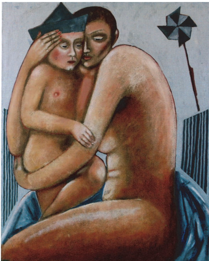
Ryc. 4. Alicja Raczkiewicz, Dzieciństwo D. Kichote , 2004. Za: Don Kichot. Współczesna próba interpretacji , Katalog wystawy w Galerii Dominika Rostworowskiego (14 X–6 XI 2004 r.), Kraków 2004

Freud? nadopiekuńcza matka – nadwrażliwe dziecko, dziecko–rycerzyk/ papierowy kapelutek/ hełm z tektury Don Kichota, dziecko niechące dorosnąć – Piotruś Pan? – dziecko, symbol bezbronności, naiwnego spojrzenia?