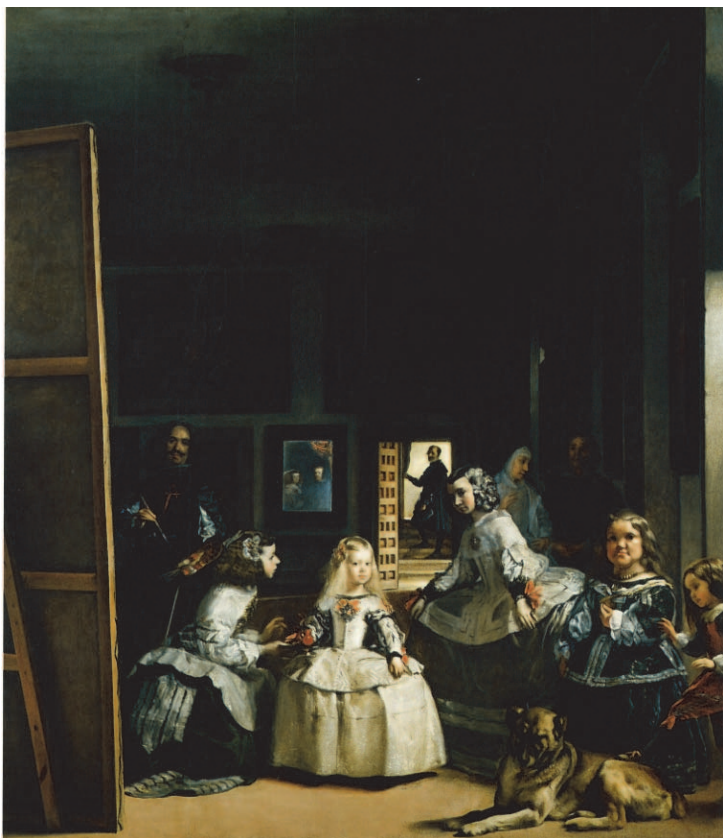
Ryc. 1. Diego Rodríguez de Silva y Velázquez, Panny dworskie (Las Meninas) , 1656.

w konstrukcji metaprzestrzeni literackiej u Cervantesa i metamalarskiej u Velázquez, o czym tak pisze Riley: