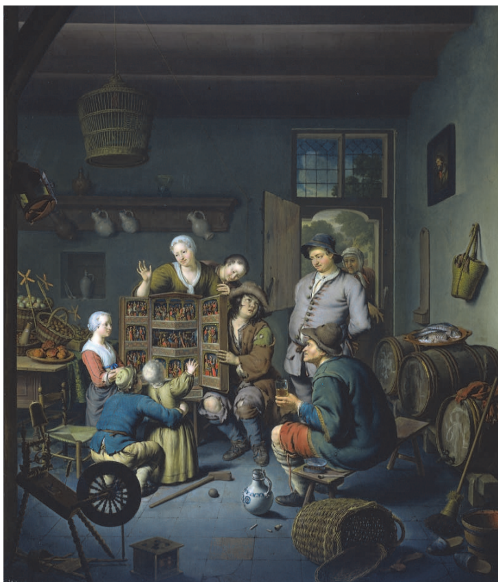
Ryc. 2. Willem van Mieris, Retablo (De rarekiek) , 1718.

Chciałabym pokazać tu jeszcze jeden, mniej znany, obraz holenderskiego malarza, Willema van Mierisa, o którym dowiedziałam się od krakowskiego niderlandysty, komparatysty i historyka sztuki, Piotra Oczuki.