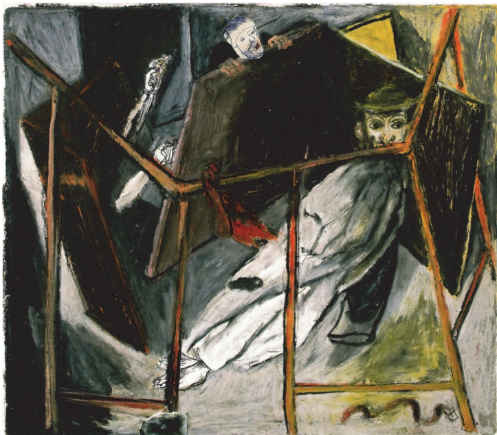
Ryc. 5. Grzegorz Bednarski, Don Kichote uwięziony , 2004. Za: Don Kichot. Współczesna próba interpretacji , Katalog wystawy w Galerii Dominika Rostworowskiego (14 X–6 XI 2004 r.), Kraków 2004

Uwięziony, okrutnie potraktowany, oszukany? Don Kichote uwięziony w klatce (pod koniec tomu I), a miało być tak zabawnie, czyż nie tak, Doroto? Księżniczko Mikomikono? W oczach i szaleństwo, i bezsilność, i niezrozumienie/ beznadzieja/ alienacja/ niewola/ wyrzucenie poza wspólnotę, która nie akceptuje inności?