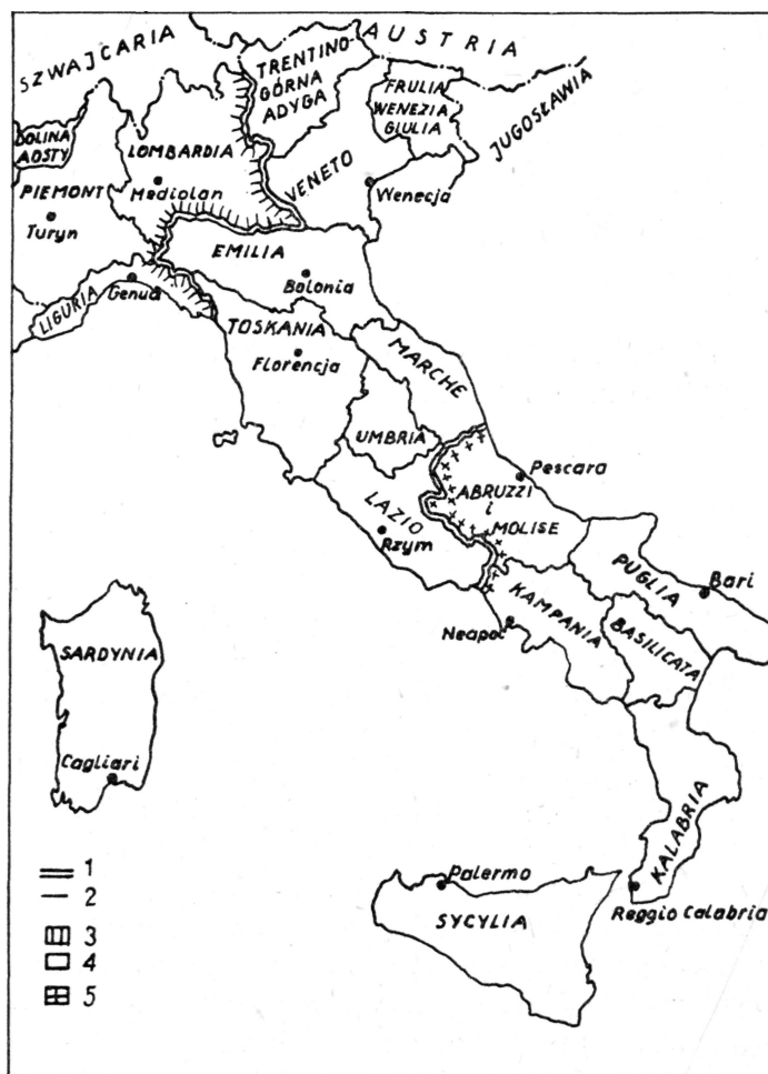
Ryc. 1. Regiony gospodarcze i administracyjne Włoch 1 — Granice regionów gospodarczych; 2 — Granice regionów administracyjnych; 3 — Włochy pń.—zach.; 4 — Włochy pń.—wsch.; 5 — Włochy pń. i wyspy (Mezzogiorno)

1. Warunki naturalne są pomyślniejsze na Północy. Lepsza gleba i jej większy obszar znajduje się na Północy. Na Południu 85% powierzchni stanowią góry, a 15% niziny, na Północy 74% powierzchni stanowią góry, a 26% niziny. Gleba w dolinie rzeki Pad jest urodzajna, natomiast na Południu wyjałowiona. Co więcej, lepszy klimat istnieje na Północy, łagodniejszy i nie tak upalny jak na Południu. Północ jest też lepiej wyposażona w energię wodną niż Południe. Dużą rolę odegrało to, co prof. Milone nazwał sprzyjającym położeniem geograficznym Północy. Łatwiejsze i tańsze połączenia z Europą zachodnią sprzyjało życiu gospodarczemu 1 .