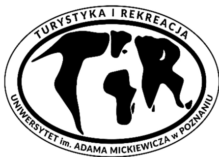
Ryc. 1. Logotyp kierunku turystyka i rekreacja