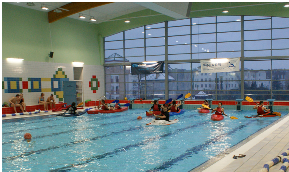
Ryc. 4. Warsztaty poświęcone turystyce kajakowej podczas VIII Dni Turystyki, fot. G. Borkowski 2010

Podczas Dni Turystyki pojawiały się też szczególne atrakcje, takie jak jazda za bytkowym tramwajem (rok 2005), ścianka wspinaczkowa (w latach 2012, 2015, 2016), byk rodeo (rok 2016), koncert szantowy (rok 2010) oraz zorbing (2010).