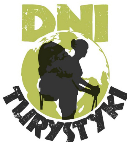
Ryc. 2. Logotyp Dni Turystyki