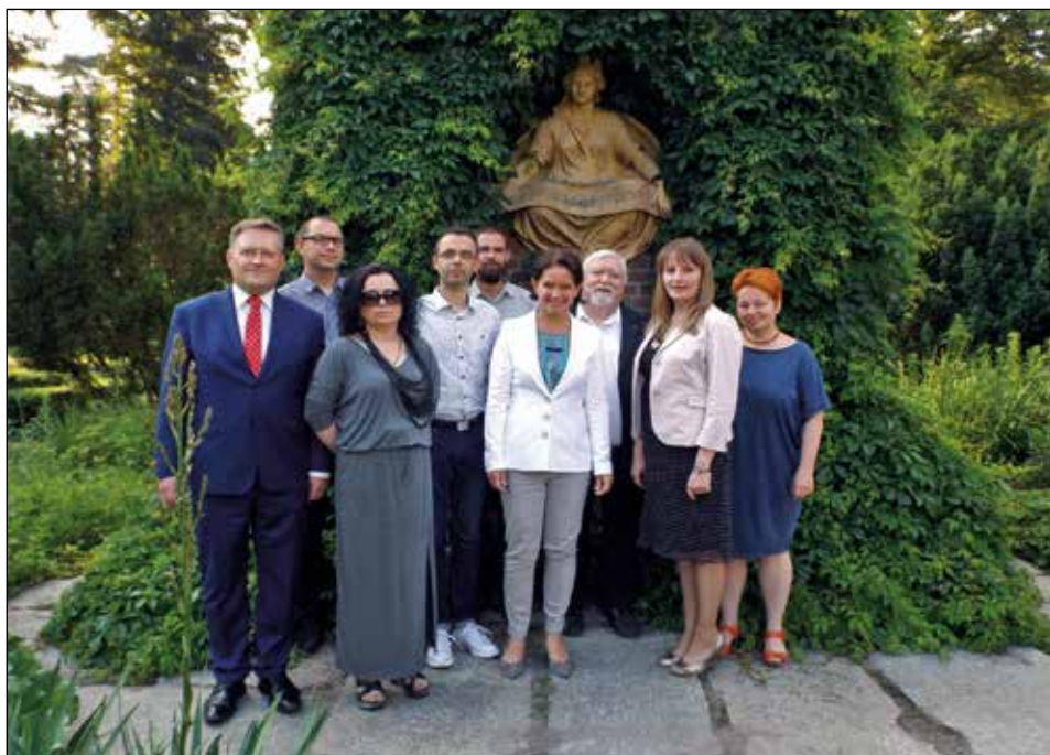
Fot. 9. Zakład Historii Wychowania w czerwcu 2017 roku