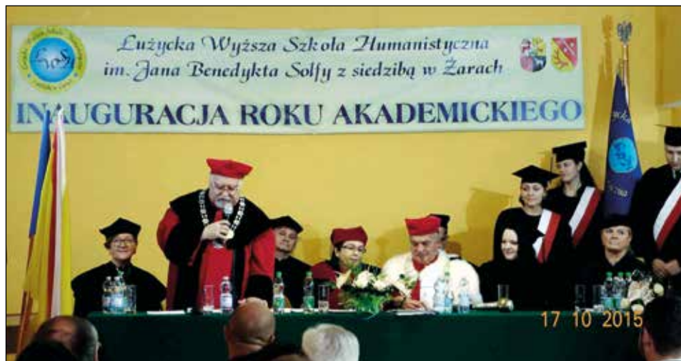
Fot. 12. Inauguracja roku akademickiego w Łużyckiej Wyższej Szkole Humanistycznej w Żarach

a także zaspokajającymi często tzw. odroczone potrzeby edukacyjne w odniesieniu do tego poziomu kształcenia. Duża część słuchaczy niepublicznych szkół wyższych nie podjęłaby w ogóle studiów, gdyby w najbliższym ich środowisku nie było uczelni [...]» 80 .