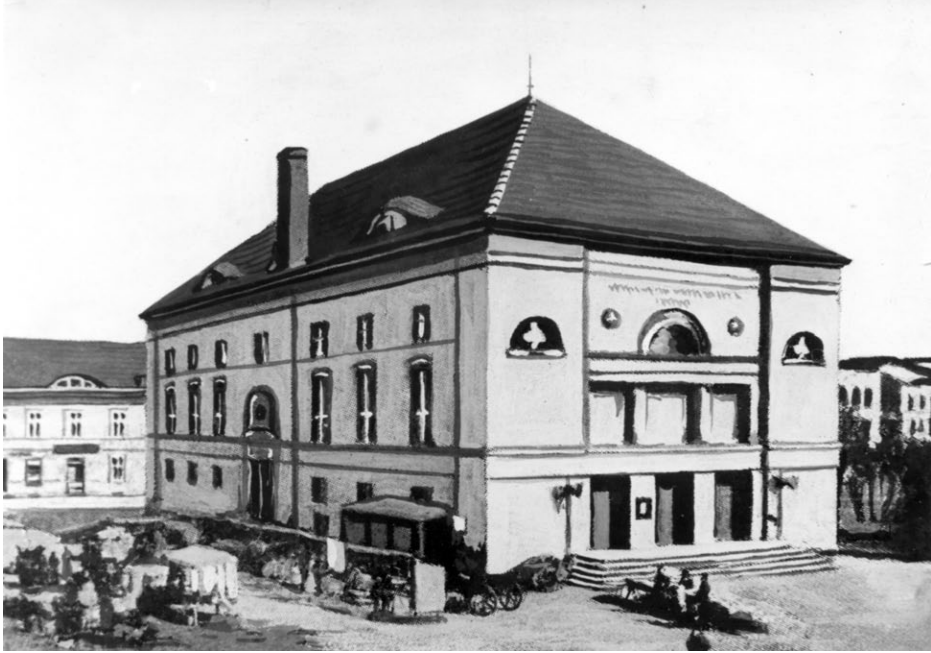
Ryc. 2. Gmach Teatru Miejskiego w zachodniej części pl. Wilhelmowskiego (dzisiaj pl. Wolności) oddany do użytku w 1804 r., w 1874 r. budynek zamknięto ze względu na zły stan techniczny