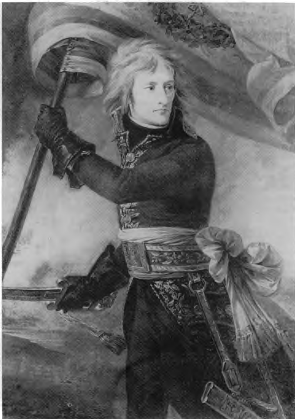
19. Jean-Antoine Gros, Napoleon na moście Arcole , 1796-1801. Musée National du Château. Wersal