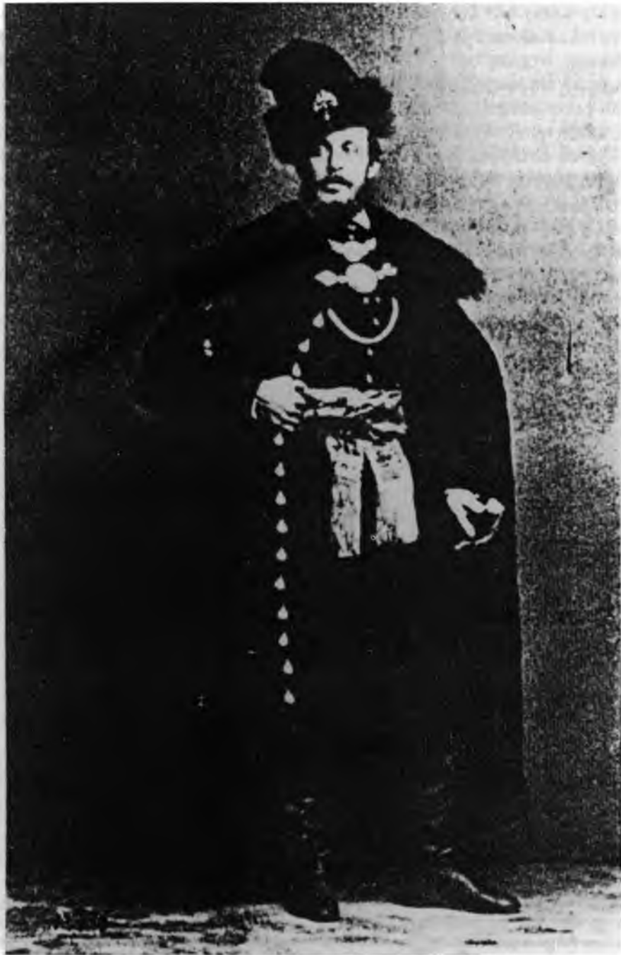
9. Jan Działyński, fotografia, 1864