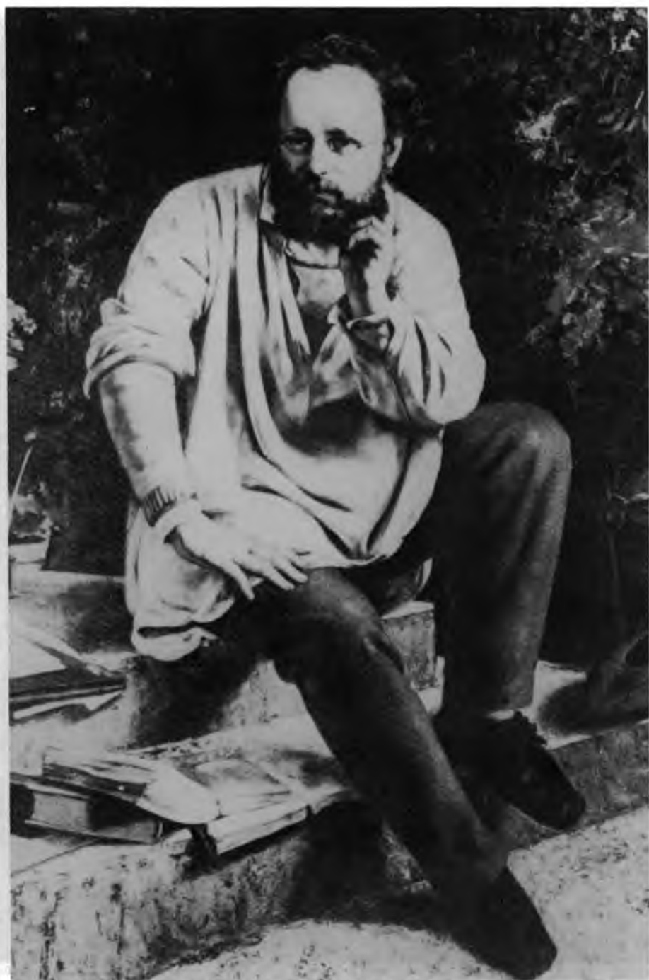
4. Gustaw Courbet, Proudhon w 1853 roku , 1865. fragm. Musée du Petit Palais, Paryż