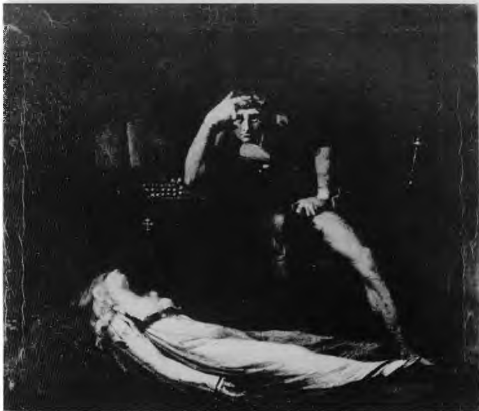
26. Johan Heinrich Füssli, Ezzeli i Meduna , 1779. Sir John Soane's House and Museum, Londyn

między ciemną czeluść lochu, tworzącą obramowanie dla postaci Ugolina, i jasny pas muru we wzajemnym stosunku szerokości zbliżonym do rozwiązania partii namiotu i pejzażu na obrazie Rodakowskiego. Obecność tych analogii poprzez wizualną sugestywność, zmusza do tropienia zależności 42 .