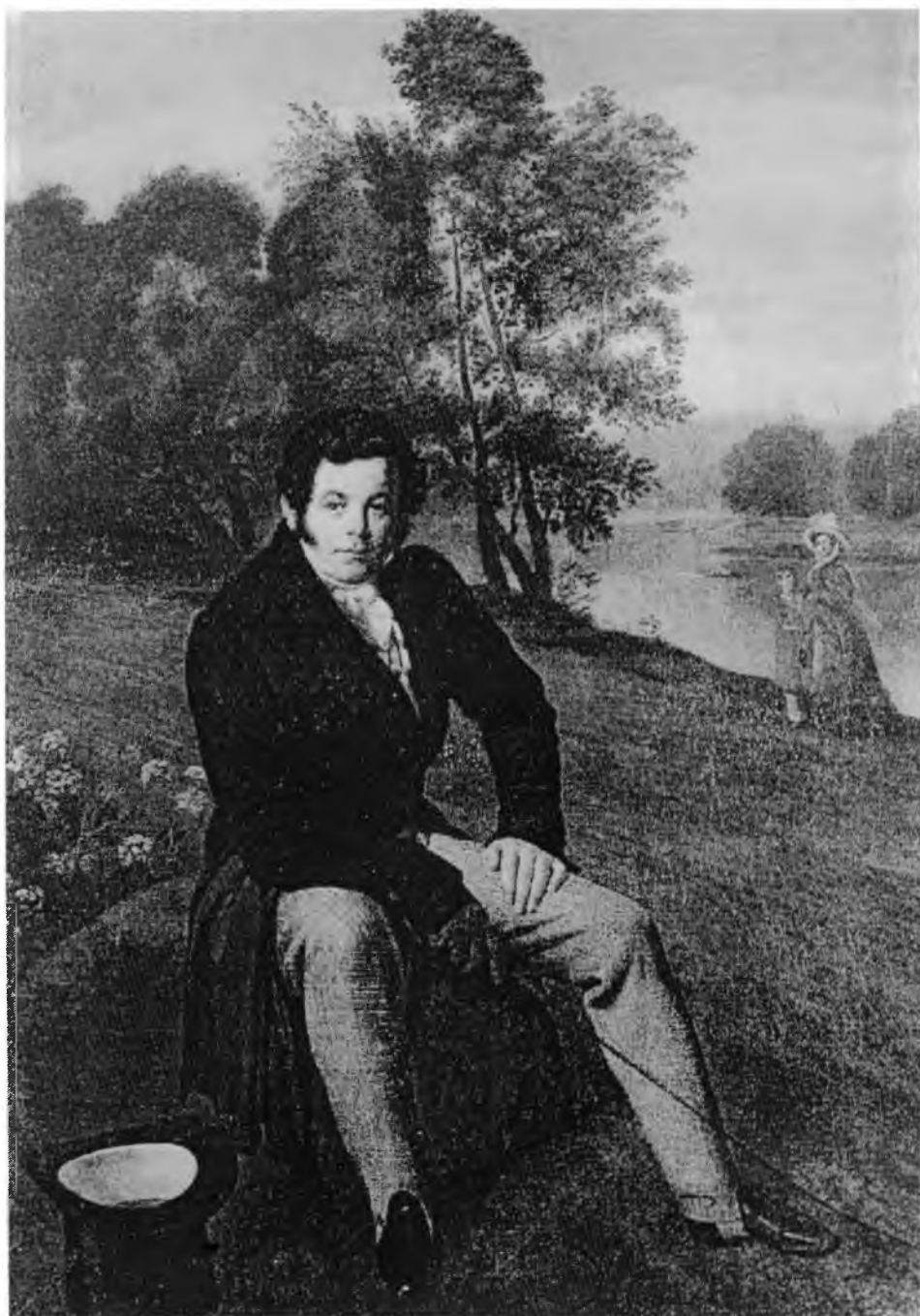
5. Orest Kiprensky, Portret Generala Karola Albrechta , 1827. Muzeum Rosyjskie. St. Petersburg