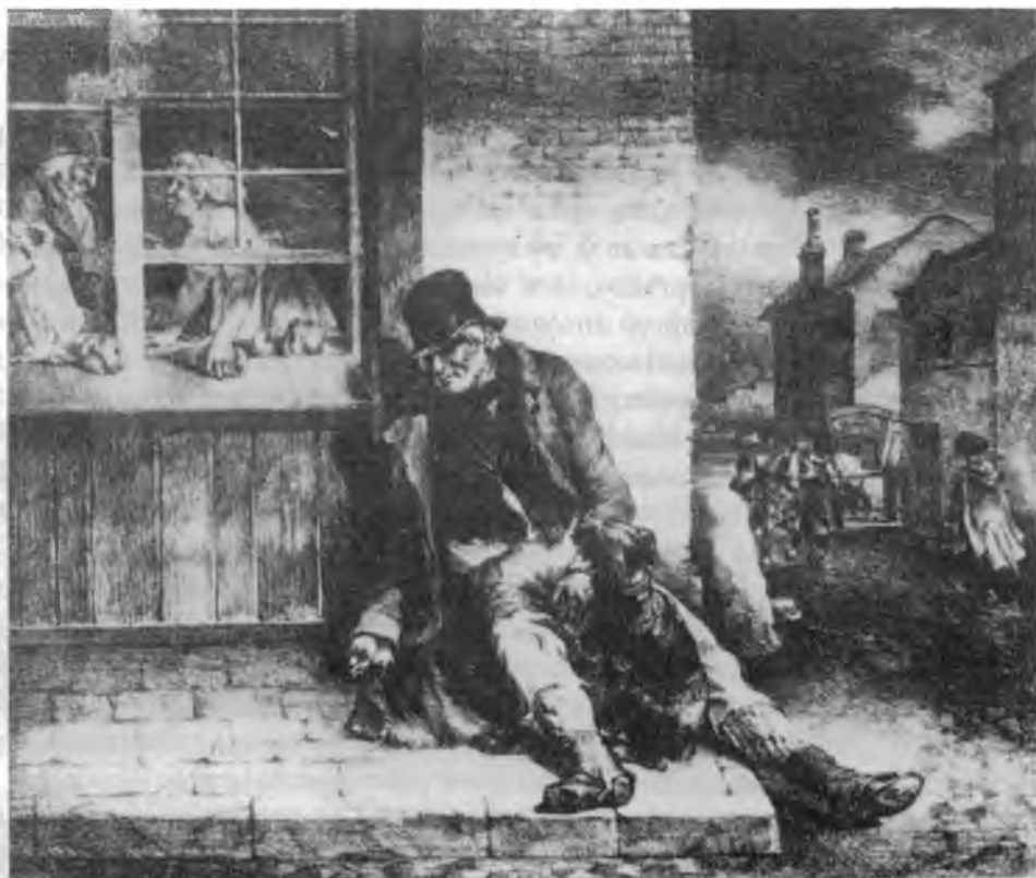
28. Theodore Géricault, Sceny angielskie , 1820

prostowaną nogą płynnie, po lekkim łuku przechodzącą w szpic buta. Drugą wspiera na chodniku, który u Rodakowskiego „przekształca się” w skałę – jego jakby nieociosaną, nieobrobioną wersję. Analogicznie do skały chodnik ucina się prostopadłe tuż za końcem buta, pozostawiając niewielki pas ziemi przed dolną granicą pola obrazowego. Rys podobieństwa uwidacznia się także we wpisaniu prawej nogi postaci, jej boku, a dalej kołnierza płaszcza i skosu parapetu okiennego we wspólną diagonalę, co w lekturze płaszczyznowej „przytwierdza” postać do budynku – odpowiadającego strukturze namiotu na obrazie Rodakowskiego. Zespołu podobieństw dopełnia znany już narzucony na ramiona postaci płaszcz z rozłożonym obszernym kołnierzem, rozchylony na piersiach i spływający szeroką połą w lewo, oraz podziały w obrębie nóg na fragmenty ubioru skrywające uda i kolana, łydki i stopy. Tworzą one zbieżności, których – jak sądzę – nie tłumaczą jedynie realia kostiumologiczne.