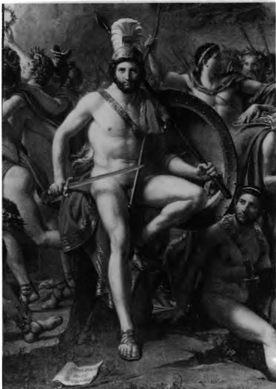
3. Jacques Louis David, Leonidas w Termopilach , 1810, fragm. Musée du Louvre. Paryż