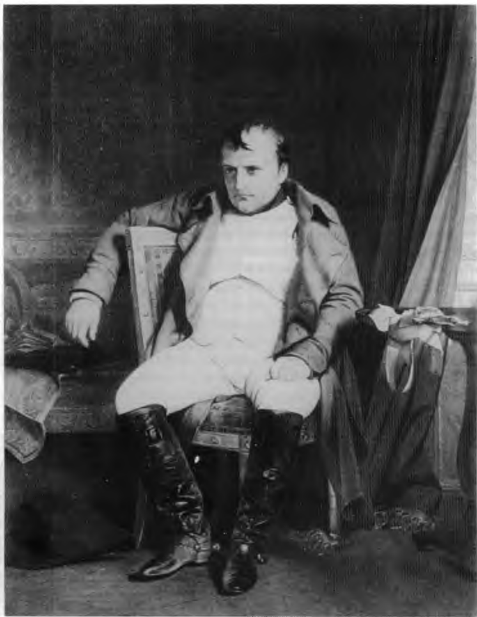
12. Paul Delaroche, Napoleon w Fontainebleau , 1845. Museum der Bildenden Künst, Lipsk

sób wpisania postaci w kadr obrazu, do pewnego stopnia także nastrój niemal półmroku, powodowany umiejscowieniem jednego ze źródeł światła po prawej stronie, tak, że pada od tyłu zza przesłony. Sposób zachowy-