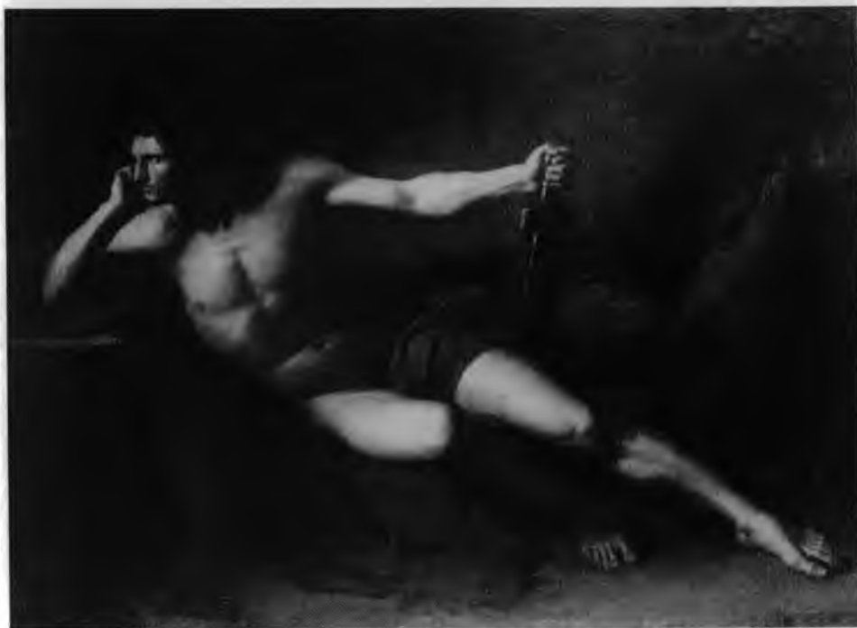
14. François-Xavier Fabre, Akt akademicki , 1789. Kolekcja prywatna

Płodność myśli Brötjego ujawnia się wyraźnie w przypadku porównania przedstawienia z zastaną konwencją obrazowania. Z jednej strony układ, jaki Rodakowski nadaje postaci Generała, mógł być wynikiem przekształceń pozostającego w dyspozycji artysty konwencjonalnego repertuaru póź, pochodzącego z praktyki studiów akademickich. Typowe dla tej praktyki realizacje tworzą kategorię analogii obrazowych równo-