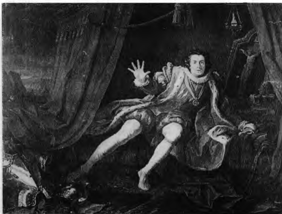
27. William Hogarth, Garrick jako Ryszard III , 1745. Walker Art Gallery. Liverpool