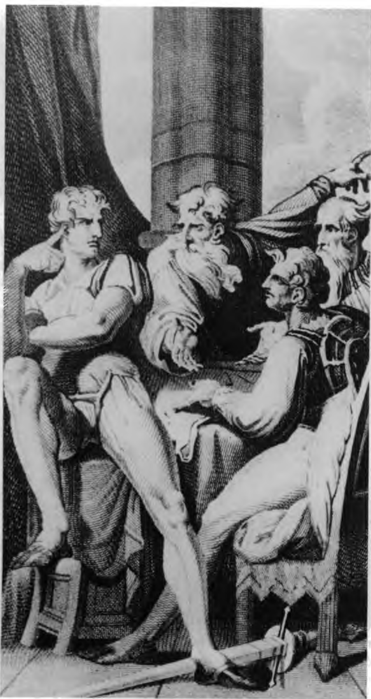
23. Johan Heinrich Füssli, Iliada , 1805