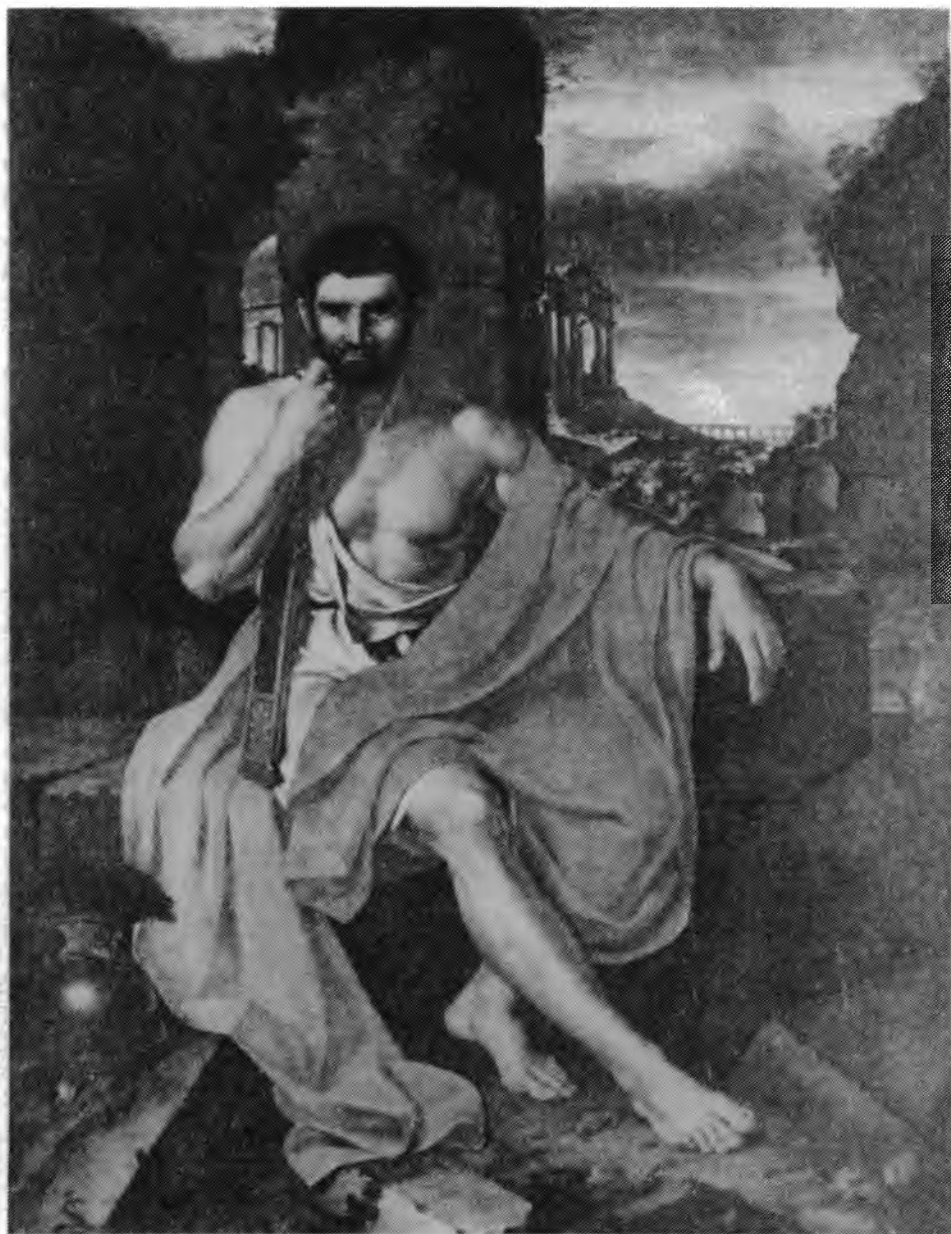
2. John Vanderlyn, Mariusz na ruinach Kartaginy , 1807. M.H. de Young Museum. San Francisco

Żaden z przytoczonych przykładów nie wykazuje przekonującego wizualnego podobieństwa z Portretem Dembińskiego w aspektach wykraczających poza wspólnotę ikonograficzną, choć należałoby uważniej przyj-