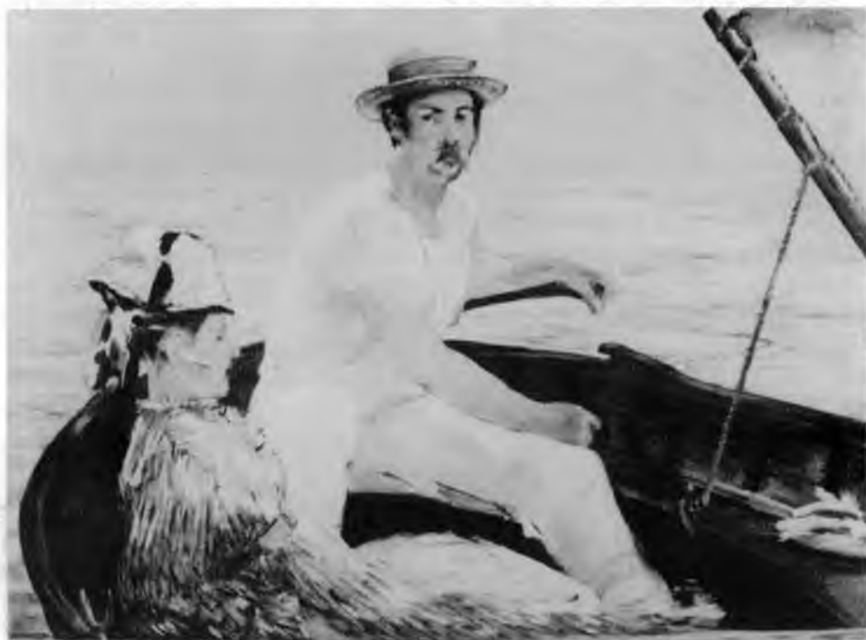
6. Edward Manet, W łódce , 1874. Metropolitan Museum. Nowy Jork

cyjonalnych 16 . Powołana relacja międzyobrazowa, oparta na wizualnym podobieństwie może zostać uznana za wynik intencji artysty, rozumianej jako celowy zamiar, na mocy świadomej decyzji, podczas gdy „podobieństwo wizualne zestawianych w jeden ciąg obrazów (ciąg motywów – M.H.) nie implikuje ich genetyczno-intencjonalnego związku, choć go nie wyklucza” 17 . O ile ze względu na wizualne podobieństwo w zarysowaną powyżej kilkoma przykładami tradycję „zadumanej postaci” wpisuje się na przykład postać Pierra Proudhona z portretu Gustawa Courbeta z 1865 r. (il. 4), tak Dembińskiego ze względu na ułożenie ciała postaci, rozstawienie nóg i wsparcie wysuniętej w bok lewej ręki, zestawić można z jednej strony z obrazem Oresta Kiprenskiego z 1827 roku, z drugiej