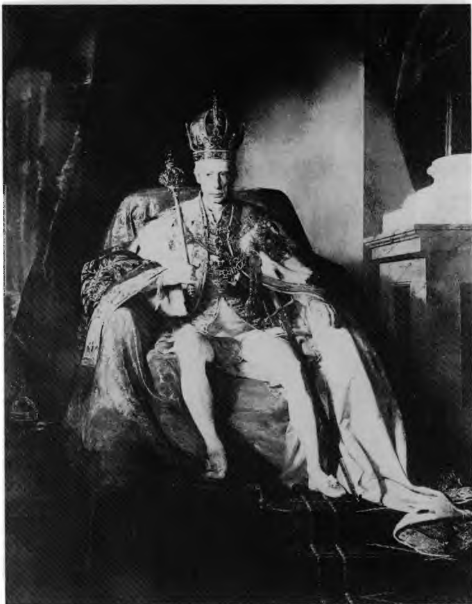
24. Friedrich von Amerling, Franz I. Cesarz Austrii , 1832, Kunsthistorisches Museum, Wien

Dialog z obrazem Amerlinga wywołuje zarazem nowy sposób zachowywania się postaci. Użytecznej inspiracji dla jego ostatecznego obrazowego ukształtowania się mogły dostarczyć ryciny Füsslego, na których postacie