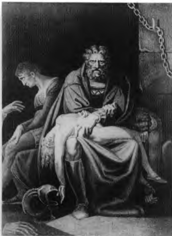
25. Johan Heinrich Füssli, Ugolino z synem w więzieniu , 1806. Kunsthhaus, Zurich