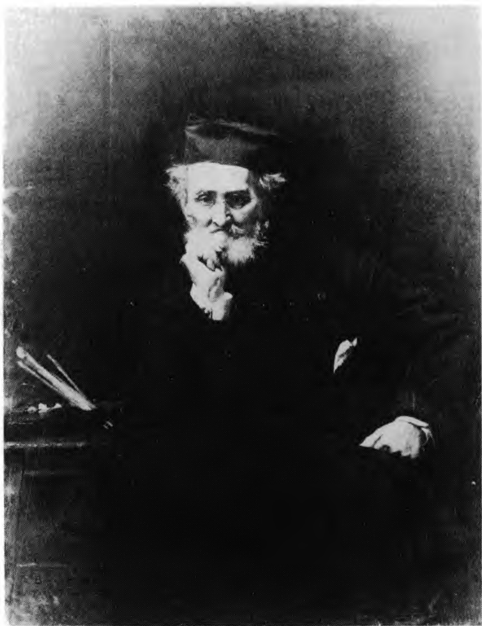
8. Leon Bonnat, Portret Léona Cognieta , 1880. Musée d'Orsay, Paryż