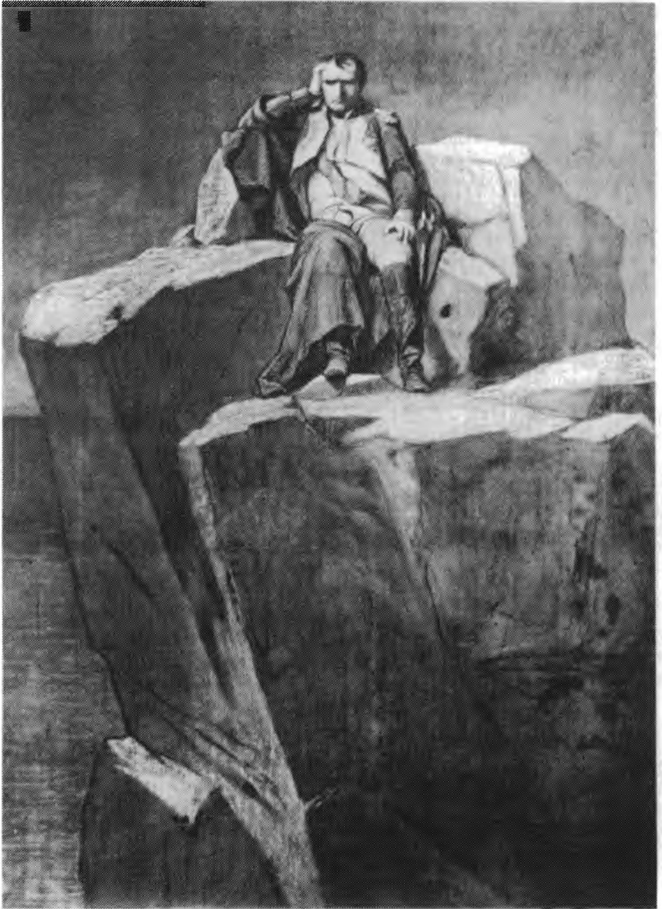
18. Paul Delaroche, Napoleon na wyspie św. Heleny , 1855 (nieistniejący)