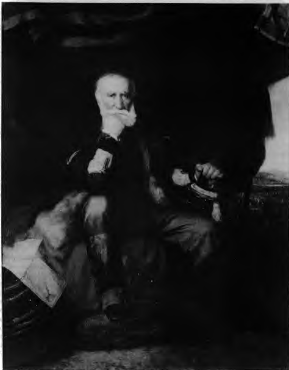
1. Henryk Rodakowski, Portret generała Henryka Dembińskiego , 1852. Muzeum Narodowe w Krakowie

Założeniem moim jest zainicjowanie w każdej z części tekstu typu analizy do pewnego stopnia niezależnego od przyjętego w pozostałych. Proces interpretacyjny winien być postrzegany jako jak gdyby przebiegający równoległe po trzech torach, co oznacza de facto przyzwolenie na do-