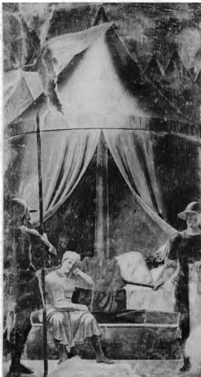
20. Piero della Francesca, Sen Konstantyna , fragm. malowidel Legenda św. Krzyża , 1466, S. Francesco, Arezzo