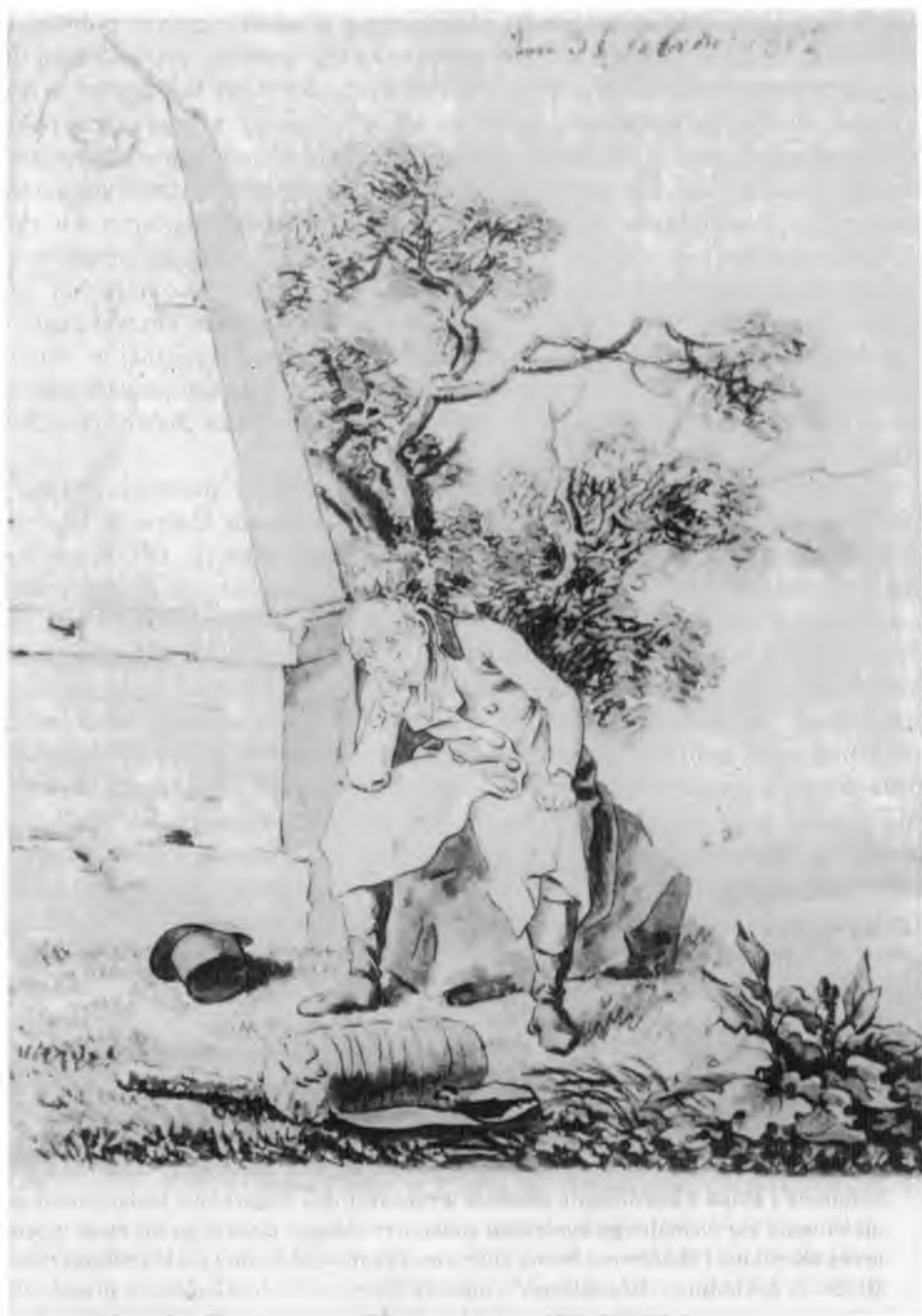
17. Caspar David Friedrich, Wędrowiec przy słupie milowym , 1802, Staatliche Graphische Sammlung, Monachium