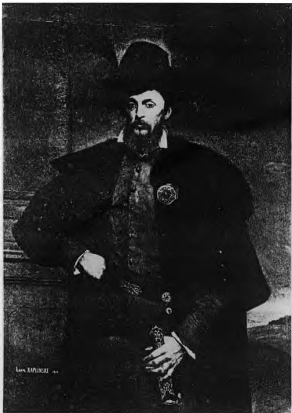
7. Leon Kapliński, Portret Jana Działyńskiego , 1864. Muzeum Narodowe w Poznaniu