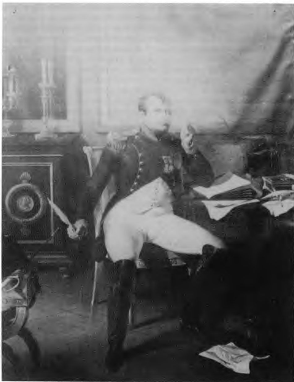
11. Louis Janet-Lange, Abdykacja Napoleona w Fontainebleau , 1844, Musée des Beaux-Arts, Tours

tem efekt odwrotny niż obraz Rodakowskiego w którym to, co ogólne, jest dostrzeżone w tym, co szczególne. Z obrazem Delaroche'a, należącym do typu „wodza rozpamiętującego stratę”, wiąże Dembińskiego zbliżony spo-