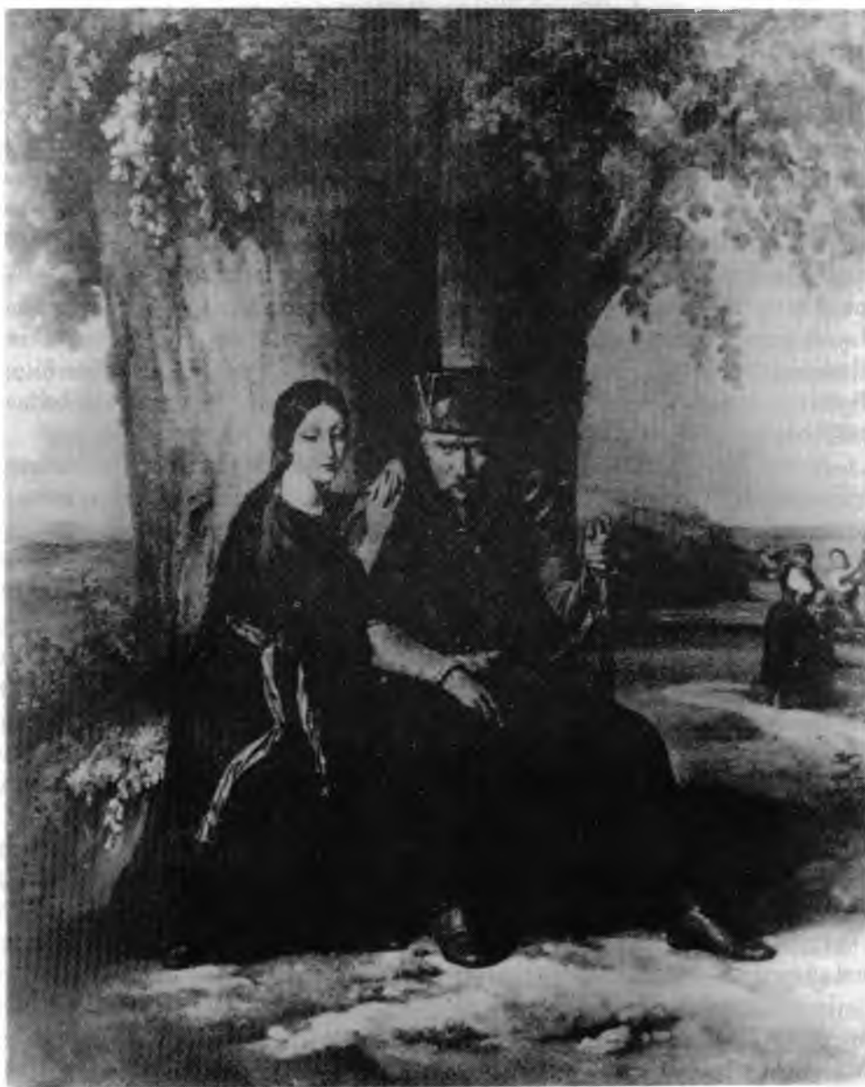
29. Józef Simmler, Maria i Miecznik , 1855, Muzeum Narodowe w Warszawie

wiązuje w sposobie upozowania postaci, Malczewski, co podkreślano od początku, zdołał utrwalić typ polskiego szlachcica-rycerza ziemianina, „który – jak pisał L. Siemieński – w chwili uderzającego weń nieszczęścia z wielką godnością i smutkiem cichym a niezmiernym dźwiga brzemię