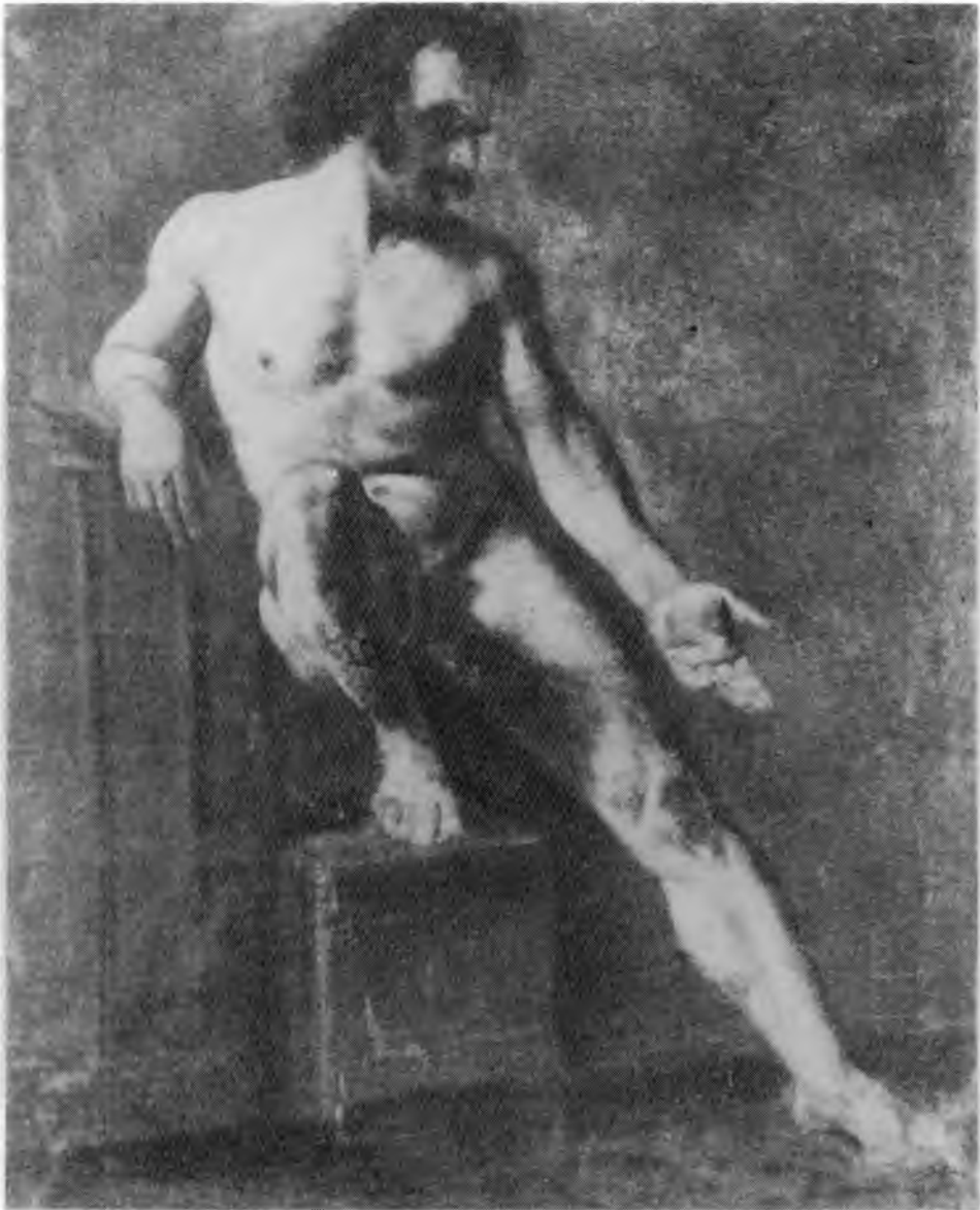
13. Theodore Géricault, Studium nagiego mężczyzny . Muzeum Narodowe w Warszawie

sposobów pojmowania, w kręgu logiki doświadczeń pozaobrazowych. Cechą znamioną dzieł sztuki jest to, że mimo upływu wieków zachowują dla oglądu nieustanną aktualność, zarówno w tym, jak się jawią, jak w tym, co stwierdzają. O tej ich ważności „wiemy” przed i poza wszelkim racjonalnym wyjaśnianiem –