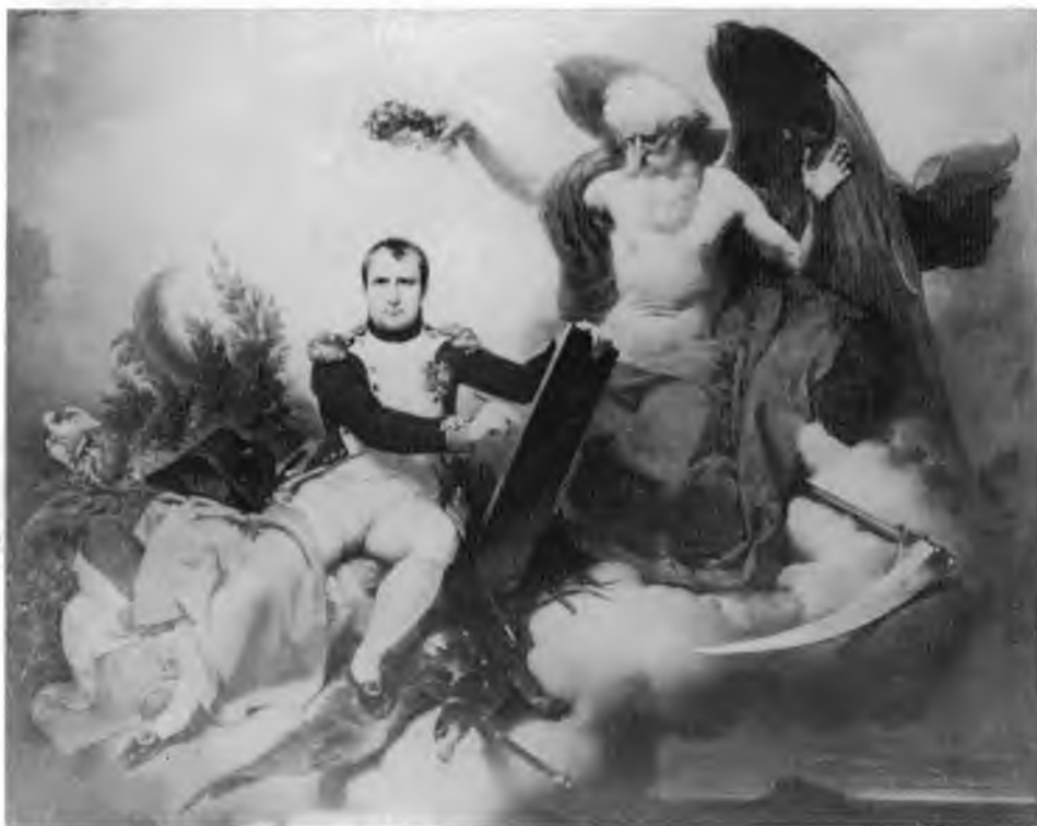
10. Jean-Baptiste Mauzaisse, Alegoria Napoleona , 1835, Musée National du Château. Malmaison

„Wódz” na obrazie Mauzaisse’a zasiada w podobny, tyle że odwrócony sposób, co Dembiński, przy czym górną część ciała skierowuje w przeciwną niż nogi stronę. Ujęcie to, wykorzystywane w najróżniejszych wątkach ikonograficznych, od postaci świętych, przez postaci wojskowych po postaci satyrów, swoją podatność zawdzięcza możliwości łączenia dwóch stron obrazu, przenoszenia narracji z jednej na drugą. Zarówno ujęcie pozycji, jak środki osadzające przedstawienie w określonej tradycji ikonograficznej, w tym przypadku jest to tradycja „triumfalna” określone zostały w sposób jednakowy i skonwencjonalizowany. Tworzą tym samym konstrukcję alegoryczną w rozumieniu Goethego 21 , w której artysta, wychodząc od ogólnej idei, poszukuje dla jej przedstawienia odpowiedniego szczegółu, co prowadzi do alegorii, gdzie to, co szczególne, posiada jedynie status przykładu dla ogólnego. Przedstawienie osiąga za-