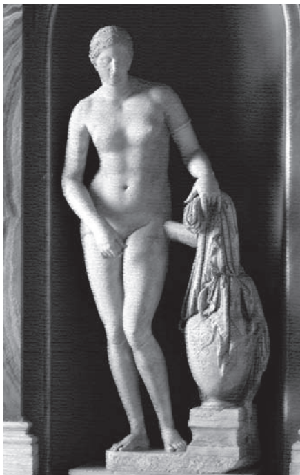
II. 1. Tzw. Wenus Colonna, rzymska kopia Afrodyty Knidyjskiej Praksytelesa, Watykan, Musei Vaticani, nr inw. 812, wys. 2,05 m, fot. E. Bugaj, rys. M. Markiewicz