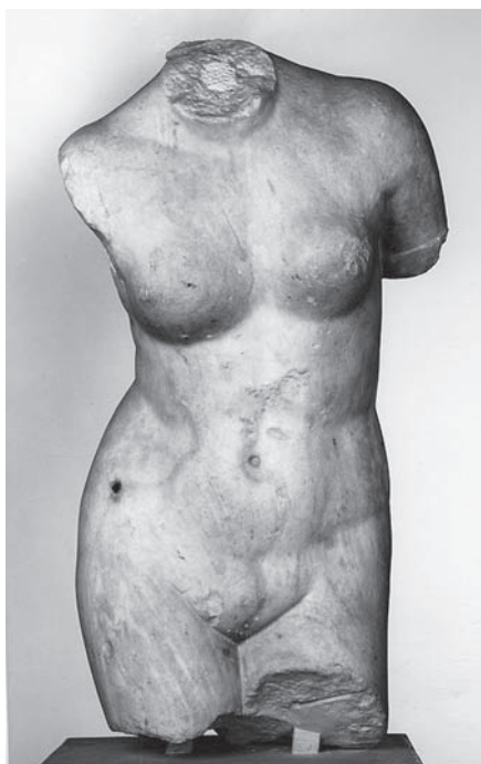
II. 2. Tors Afrodyty z Knidos Praksytelesa, rzymska kopia greckiego oryginału, Bruksela, Musées Royaux d'Art et d'Histoire, nr inw. A1405, zachowana wys. 93 cm