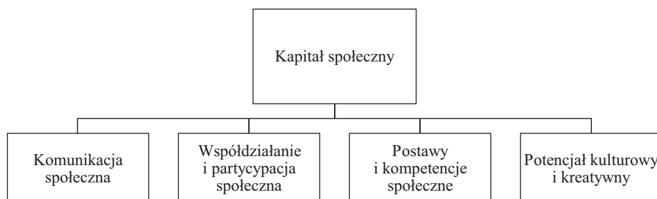
Rys. 2. Obszary kapitału społecznego