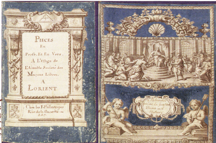
(Pieces En Prose, Et En Vers, A L'Usage de L'Aimable Societé des Maçons Libres)

1* Karpowicz A, Geneza i zawartość kolekcji druków masońskich Biblioteki