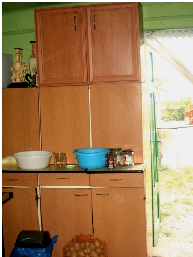
18. LETNIA KUCHNIA