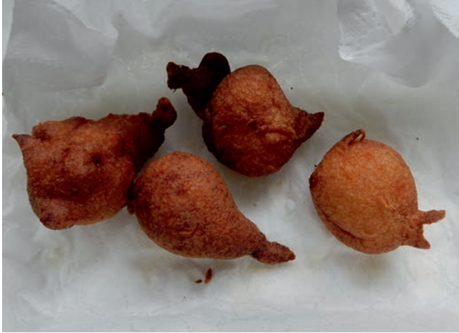
13. RACUCH; RUCHANKI