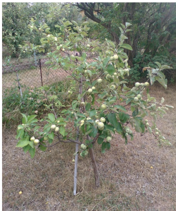
10. JABŁOŃ – DRZEWKO; PAPIERÓWKA