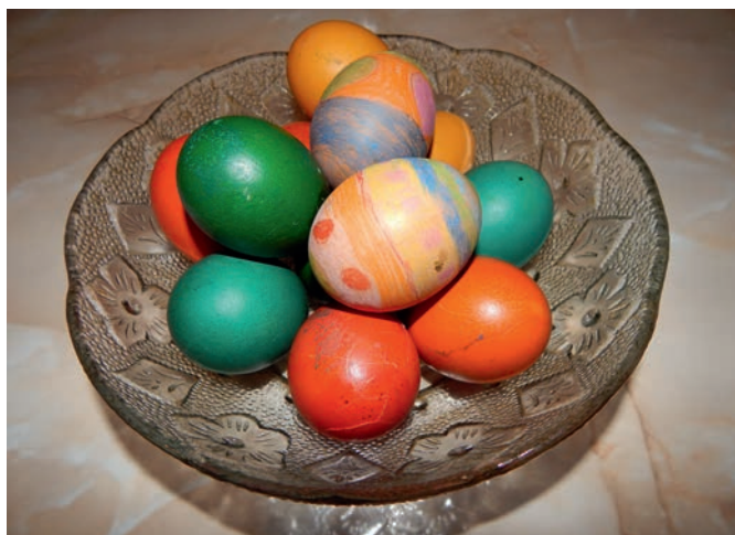
20. KRASZANKA; MALOWANKA; PISANKA