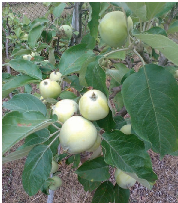
9. JABŁOŃ – OWOCE; PAPIERÓWKA