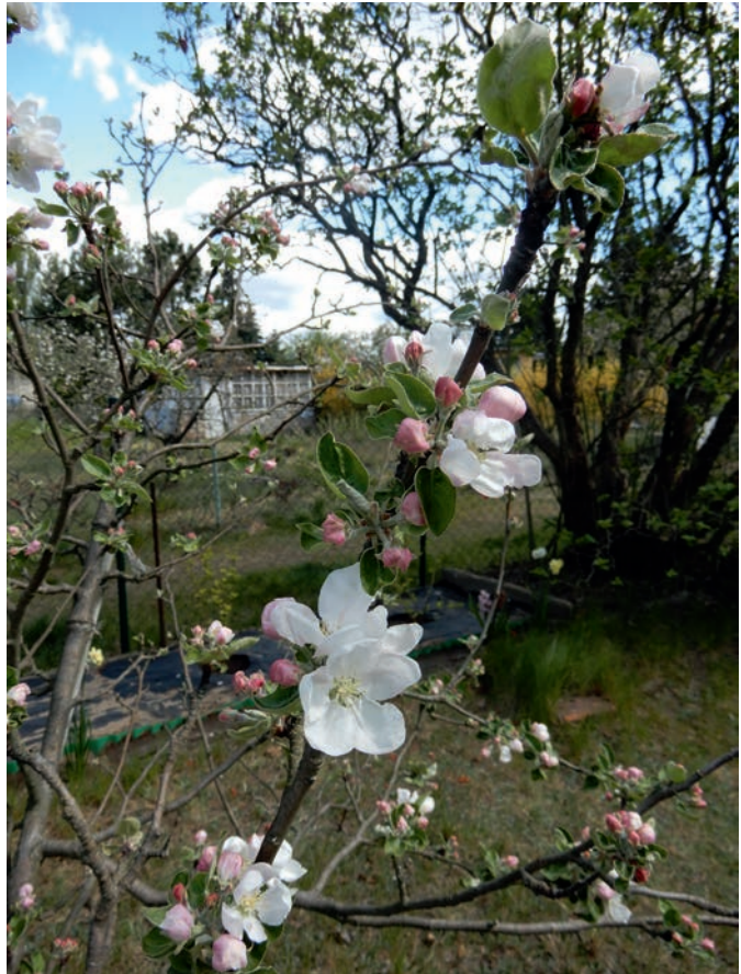
8. JABŁOŃ – KWIATY