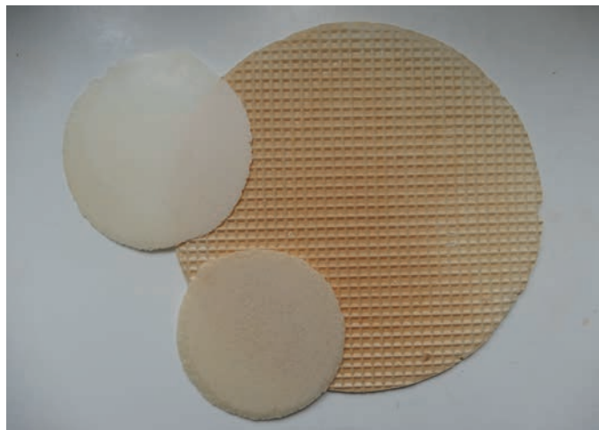
17. ANDRUT I WAFELEK