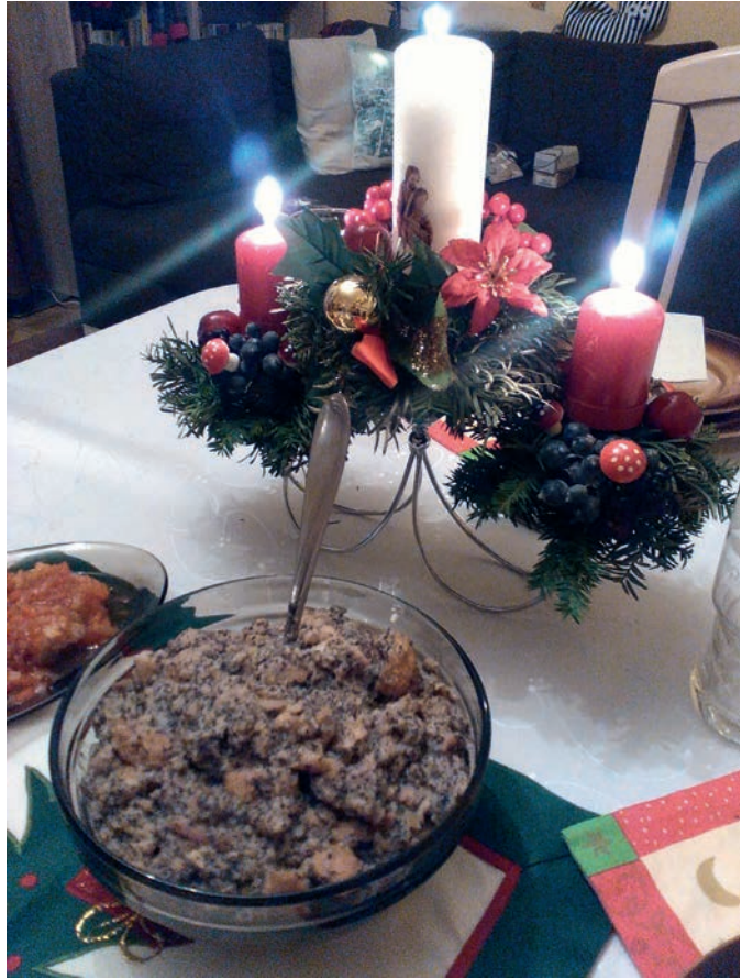
15. MAKIELKI; STÓŁ WIGILIJNY