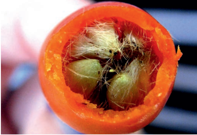
4. DZIKA RÓŻA – WNĘTRZE OWOCU