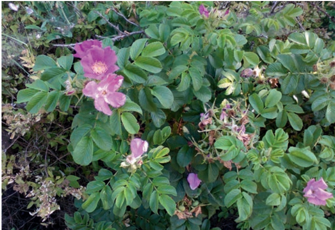
5. DZIKA RÓŻA – KRZEW I KWIATY