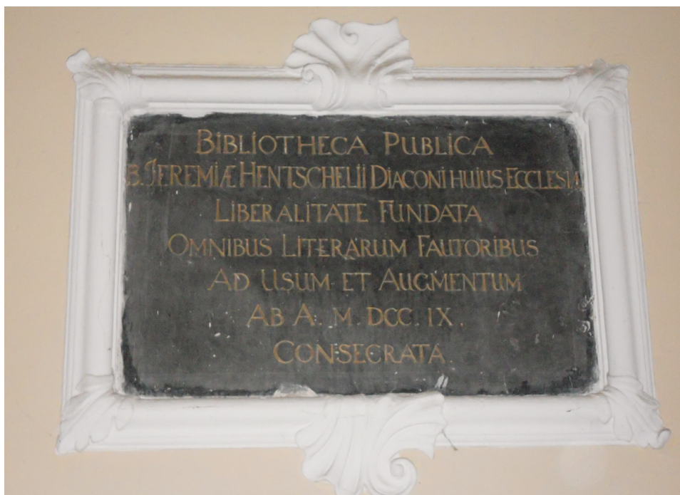
Il. 1. Tablica nad drzwiami biblioteki w kościele św. Krzyża w Lesznie