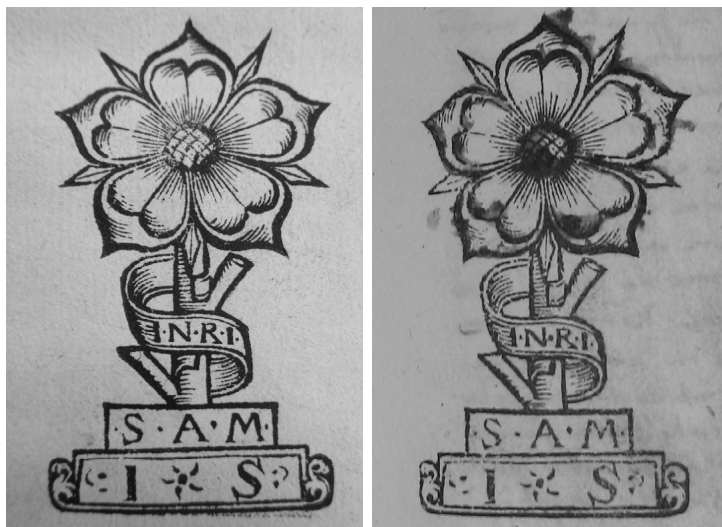
Il. 1. Po lewej: odbitka klocka drzeworytniczego ze znakiem notarialnym J. Żdżarowskiego, użytym w funkcji ekslibrisu (Gniezno, AAG, BK Inc. 37, k. nlb 1b); po prawej: odbitka tegoż znaku przy wpisie admisyjnym (Kraków, AKMK, AOff. 37, s. 665)