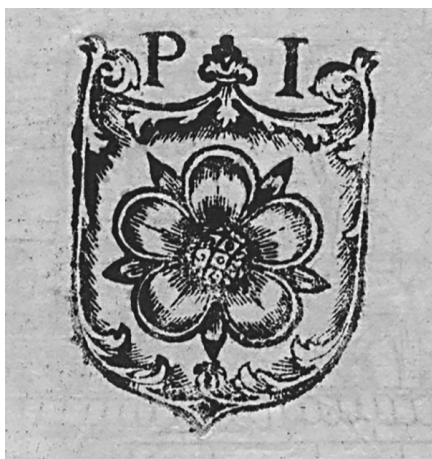
Il. 2. Ekslibris Piotra Izdbieńskiego (Johannes Chrysostomus, Index in Quinque Tomos operum... , Basel: A. Cratander, 1522, 2 o , Poznań, Biblioteka PTPN, sygn. 47941, T. 3, k. tyt. verso)

Żdżarowskiego wykazują pewne podobieństwa do wykończeń boków italianizującej tarczy herbowej z księgoznaku Izdbieńskiego. Sądzę, że obydwie klocki drzewo-