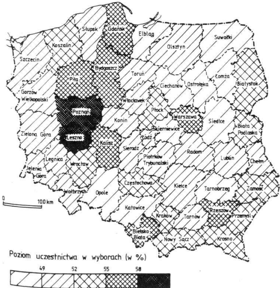
Ryc. 1. Zróźnicowanie przestrzenne uczestnictwa w wyborach parlamentarnych w 1993 r.

ciechanowskie (48.7%), łomżyńskie (48.8%) oraz uprzemysłowione województwa południowe: opolskie (46.5%) i katowickie (48.2%). Rozkład przestrzenny uczestnictwa w wyborach parlamentarnych w 1993 r. przedstawia ryc. 1.