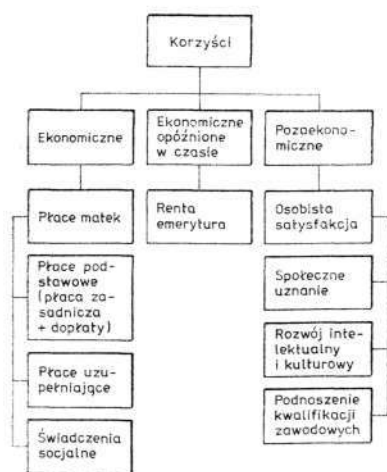
Ryc. 1. Korzyści związane z pracą zawodową matek w okresie rozwoju rodziny

większają rozmiary faktycznego dochodu rodziny, zatem do podstawowych korzyści ekonomicznych wynikających z pracy zawodowej matek należy zaliczyć płace kobiet (ryc. 1).