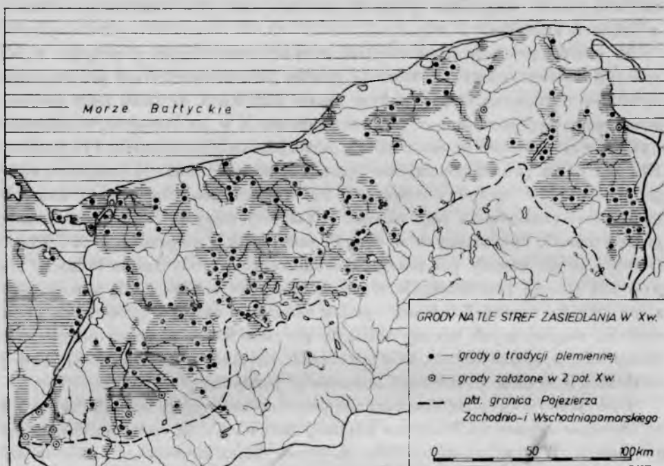
Ryc. 1. Grody na tle stref zasiedlania w X w.

Illustr. 1 Hillforts against the background of settlement in the 10-th century. ● hillforts of tribal tradition. ⊙ hillforts established in the second half of the 10-th century. — — the southern border of the West- and East-Pomeranian Lake District