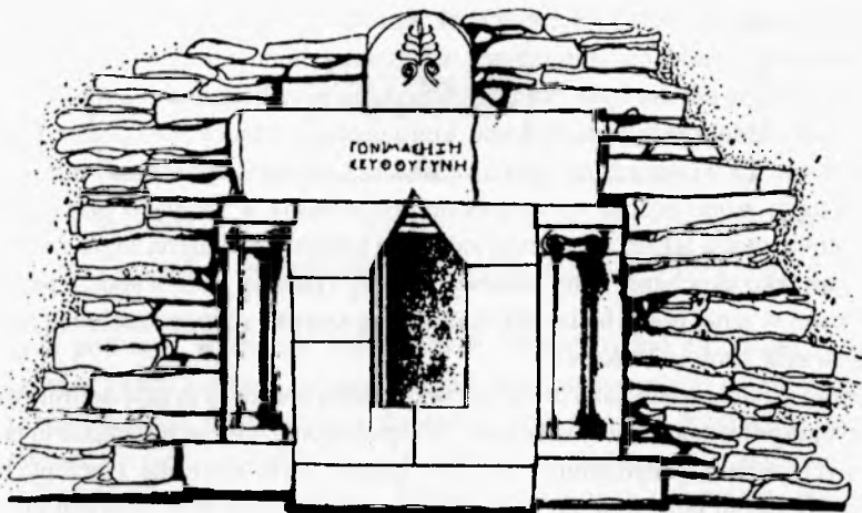
Ryc. 3. Grobowiec w miejscowości Smjadovo (wg Atanasov 2002).