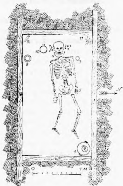
Ryc. 1. Rzut poziomy grobu w Arabadžijskata Mogila (wg Filov 1933)

Abb. 1 Grundriß des Grabes Arabadžijskata Mogila (nach Filov 1933)