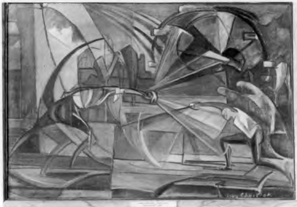
1. L. Chwistek, Szermierka , ok. 1919, olej na tekturze, 70 × 100 cm, wł. Muzeum Narodowe w Krakowie, nr inw. 155282

najpełniej realizuje się w schemacie porządkującym doświadczenie wokół kategorii rzeczy , ponieważ zasada ta logicznie wiąże się z zasadą tożsamości i wyłączonego środka, będącymi językowym odpowiednikiem ontologicznych zasad jedności i odrębności. Schemat naturalny jest nieunikniony i powraca co pewien czas, tłumiąc, jak Chwistek później zauważy, doświadczenie sztuki.