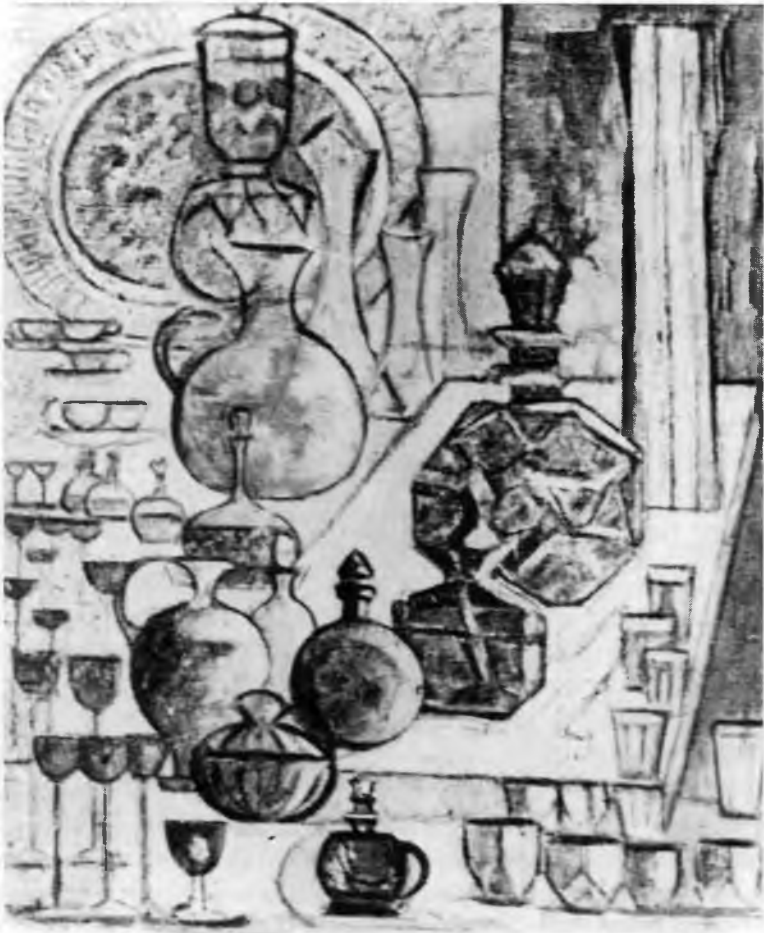
7. L. Chwistek, Szkló , 1932-37, olej na desce, 65 × 50 cm, wł. prywatna, Kraków

oraz zasadę kontrastu realizującą się w zestawianiu różnych stref. Konstrukcja pojęcia strefy i zasad strefizmu miała na celu początkowo elementaryzację języka plastycznego poprzez zdefiniowanie podstawowej jednostki kompozycyjnej oraz wypracowanie szerszej niż system unifikacji i system kontrastów (odpowiednio realizujących się w różnych stylach czy systemach rzeczywistości) zasady kształtowania. Oto jak definiował Chwistek to pojęcie: