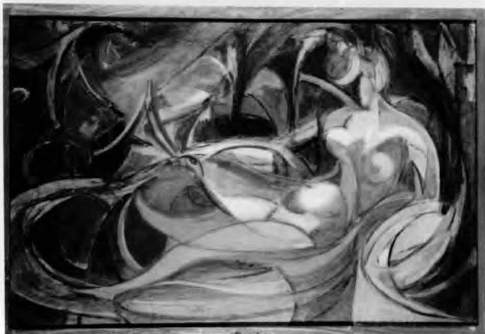
2. L. Chwistek, Motyle , ok. 1920, olej na płótnie, 48 × 72 cm, wł. Muzeum Narodowe w Warszawie, nr inw. MPW 1159

jest prowadzoną wobec dzieła swobodną, kompensacyjną grą wyobraźni. Chwistek był tu wyrazicielem rozwijanej równolegle doktryny strefizmu względnie antyunizmu.