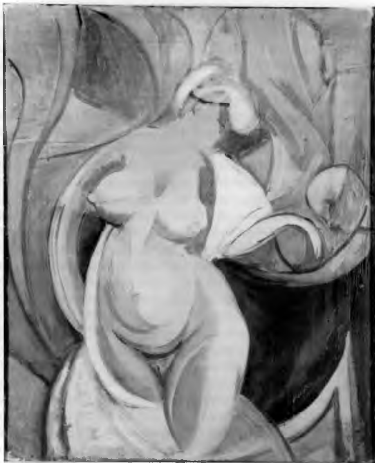
4. L. Chwistek, Akt kobiecy , ok. 1919, olej na płótnie, 55 × 45 cm, wł. Muzeum Narodowe w Warszawie, nr inw. MPW 1158, fot. S. Sobkowicz

wykładni pojęcia rzeczywistości lat 20. usiłuje przejść do integrującego (hierarchicznego) ujęcia, a przecież wiadomo, że te dwie presupozycje dyskursu wzajemnie się anulują. Wytwarza to dyskontynuację w myśli Chwistka porządkującej początkowo typy rzeczywistości w sposób horyzontalny, później zaś wertykalny. Pojawia się więc w jego dyskursie różnica pomiędzy funkcją konstatającą i performatywną. Zasada niesprzeczności czy zdrowego rozsądku może być bowiem uznana za indukcyjny fakt, to znaczy, że wszystkie schematy rzeczywistości dają się zapisać w postaci niesprzecznej aksjomatyki. Ale zarazem pojawia się wątpliwość, czy aksjomatyka rzeczywistości wyobrażeń jest aksjomatyką adekwatną? Tę trudność zauważył już Roman Ingarden, gdy pisał, że niesprzeczność układu aksjomatów rzeczywistości wyobrażeń pozostawia