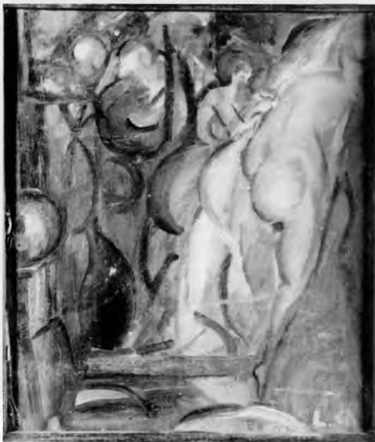
5. L. Chwistek, Kąpiące się , olej na tekturze, 28 × 25 cm, wł. Muzeum Narodowe w Warszawie, nr inw. MPW 1160, fot. H. Romanowski

W przypadku aksjomatyzacji rzeczywistości wyobrażeń mielibyśmy do czynienia z pomieszaniem kryteriów rzeczywistości, czego Chwistek chciał za wszelką cenę uniknąć.