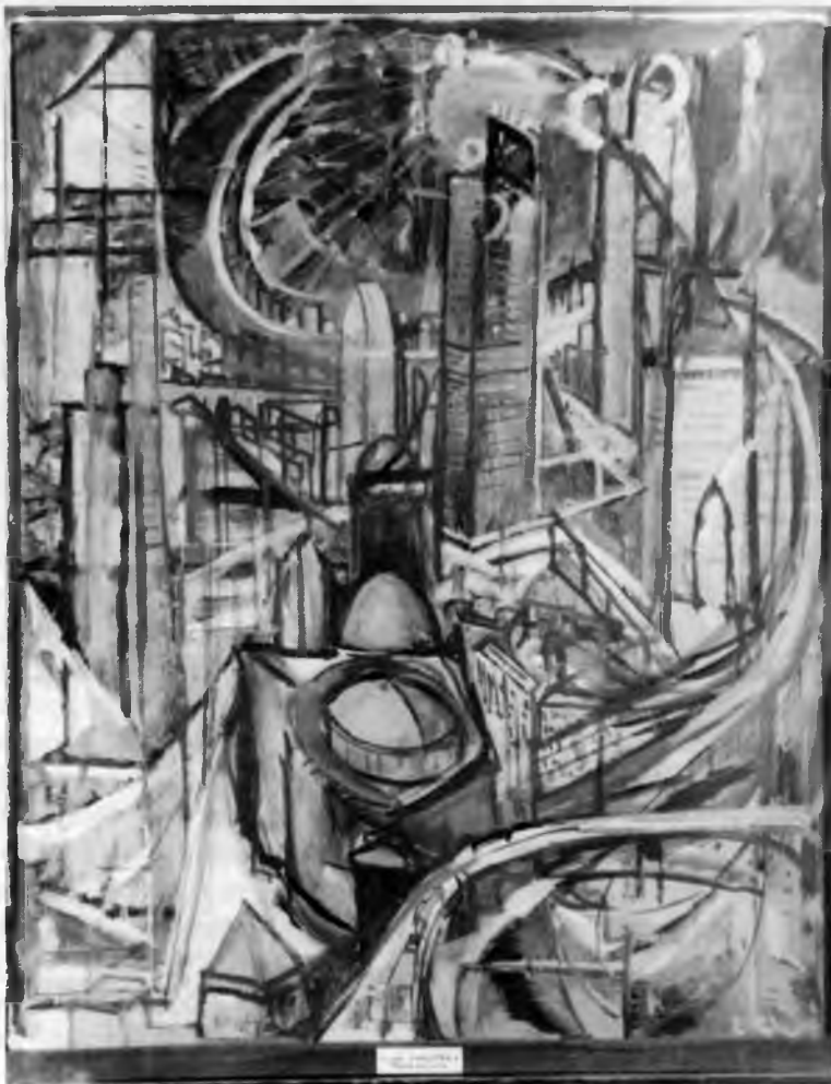
3. L. Chwistek, Miasta fabryczne , ok. 1920-21, olej na tekturze, 81 × 65 cm, wł. Muzeum Narodowe w Warszawie, nr inw. MPW 1157

nych systemów pozostaje nieredukowalna przeciwstawna temu dążeniu tendencja do anulowania tej różnicy pomiędzy systemami rzeczywistości, czego rezultatem jest dyskurs o sztuce – strefizm .