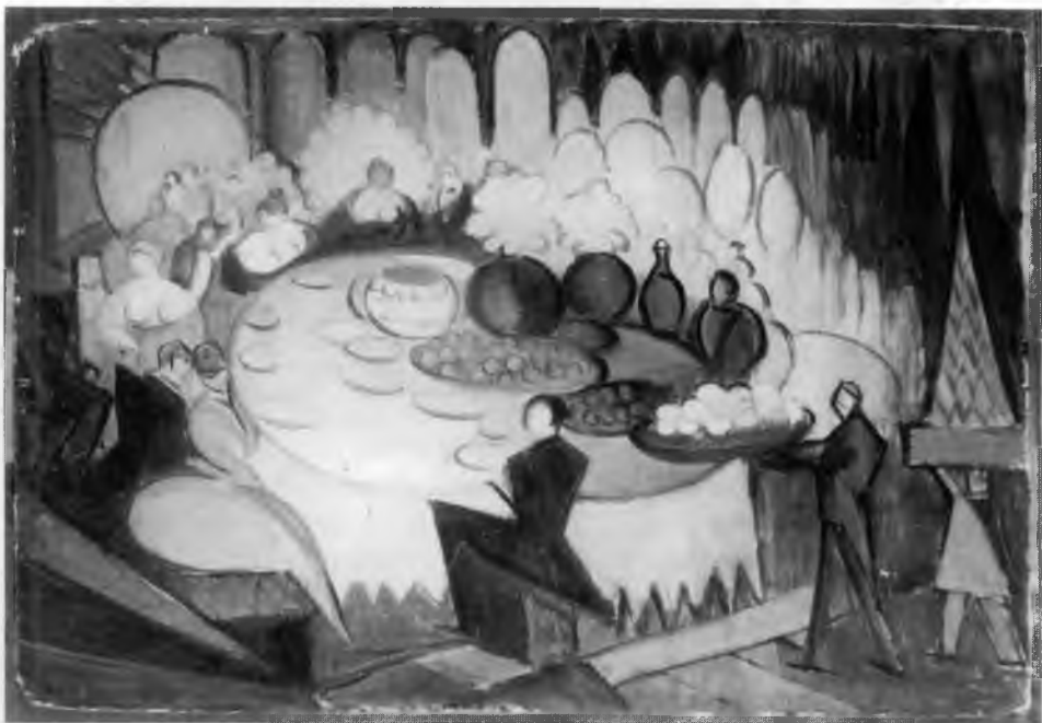
6. L. Chwistek, Uczta , olej na płótnie, ok. 1925, wł. Muzeum Narodowe w Warszawie, nr inw. MPW 1161

Dotychczasowe rozważania wykazały, że postulowana przez Chwistka autonomia zdrowego rozsądku i metody konstrukcyjnej (symbolicznej) jest problematyczna. W dalszym ciągu trzeba pogłębić to przekonanie, że dyskurs Chwistka o sztuce ( strefizm ) jest dywersją wobec filozofii