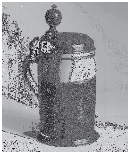
Ryc. 2. DzbANEK miodowy z Rochlitz (wg Adler 2005)

Pojemniki o wysokości 18–26 cm mają lekko wklęsłe dna (o średnicy 9–15 cm), przechodzące płynnie niewielkimi stopkami w cylindryczne brzuśce zakończone