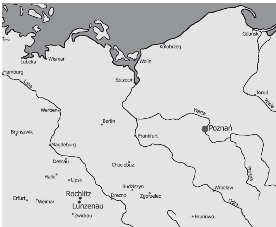
Ryc. 1. Lokalizacja domniemanych ośrodków garncarskich, gdzie produkowano dzbanki miodowe z Rochlitz. Rys. A. Kowalczyk