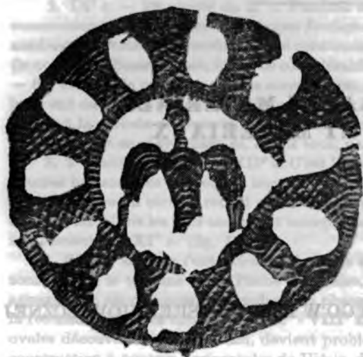
Ryc. 1. Wrocław-Ostrów Tumski, plakieta cynowa, \varnothing 5,1 cm, początek XIII w. według J. Kaźmierczyka, J. Kramarka, C. Lasoty, 1975 Wrocław-Ostrów Tumski, Zinuplaketten, \varnothing 5,1 cm, Anfang 13. Jh. Nach J. Kaźmierczyk, J. Kramarek, C. Lasota, 1975