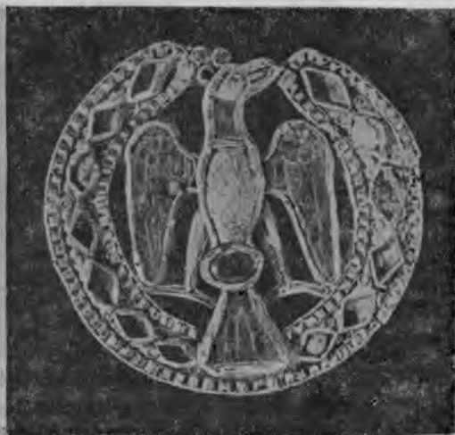
Ryc. 4. Moguncja, fibule ze skarbu cesarzowej Giseli, złoto emaliowane i kamienie szlachetne, \varnothing 10 i 7 cm, druga połowa X w. według P. E. Schramma, E. Mütterich, 1962 Mainz, Fibeln aus dem sog. „Hort der Kaiserinnen”, Gold, Email und Edelsteine, \varnothing 10 und 7 cm, 2. H. 10 Jh. Nach P. E. Schramm, E. Mütterich, 1962