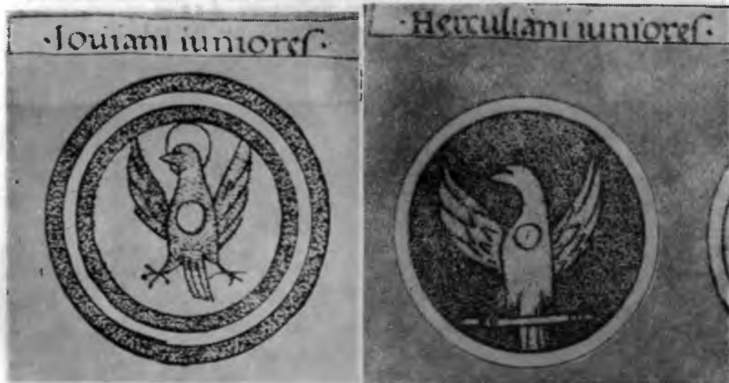
Ryc. 5. Wyobrażenia późnoantycznych znaków legionowych z Notitia dignitatum . Według Notitia dignitatum , 1876 Spätantike Legionstandarten aus den Notitia dignitatum . Nach Notitia dignitatum , 1876

Odkrycie fibul mogunckich z wyobrażeniem Gołębic Duchy Świętego w skarbie zawierającym też oznaki władzy cesarskiej, przy jednoczesnym braku przedstawień orłów w tymże skarbie, pozwala przypuszczać, że symbole Duchy Świętego spełniały rolę późniejszych orłów heraldycznych. Prześledzenie rozwoju symbolu orła jako oznaki władzy, począwszy od czasów rzymskich, prowadzi do bardzo interesujących wniosków. W świetle późnoantycznych Notitia dignitatum 8 , zestawiających insygnia legionowe Wschodniego Imperium, doszło, po zwycięstwie chrześcijaństwa, do sakralizacji orła rzymskiego w duchu nowej religii. Zazwyczaj przedstawiono go według schematu i kolorów, jakie znamy już z przytoczonych fibul emaliowanych, a niekiedy nawet otrzymywał aureolę (il. 5).