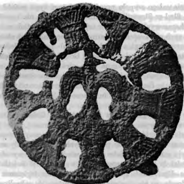
Ryc. 3. Sanzkow, pow. Demmin (NRD), plakietka ołowiana, \varnothing 5,2 cm, początek XIII w. według Ausgrabungen und Funde, t. 13, z. 6

Sanzkow, Kr. Demmin (DDR), Bleiplakette, \varnothing 5,2 cm, Anfang 13. Jh. Nach Ausgrabungen und Funde, Bd. 13, H. 6