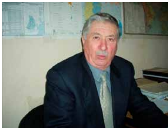
Zdjęcie 1. Stepan Topal – prezydent Republiki Gagauskiej