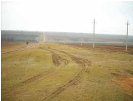
Zdjęcie 6. Pozostałości Wału Trajana na północ od Wulkaneszti