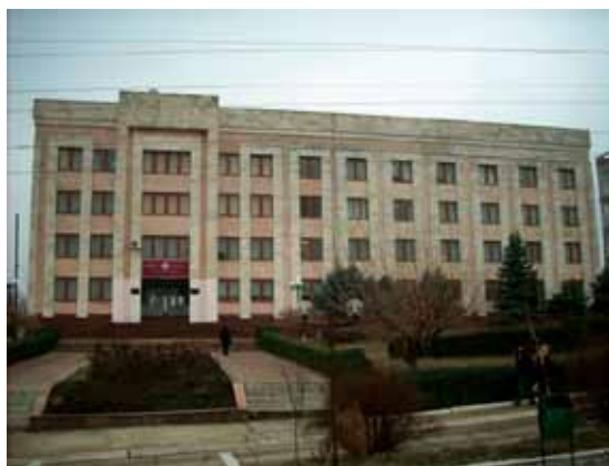
Zdjęcie 3. Komrat – główny gmach uniwersytetu