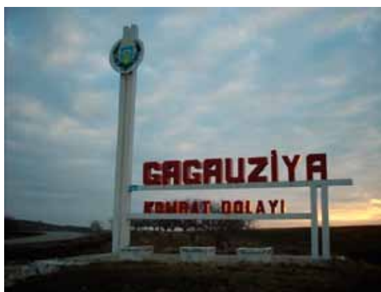
Zdjęcie 2. Granica Gagauz Yeri