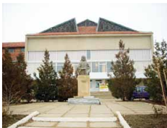
Zdjęcie 8. Czadyr Łunga – Teatr Gagauski