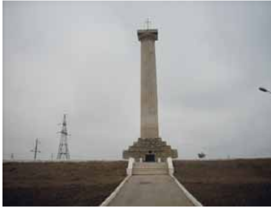
Zdjęcie 5. Wulkaneszti – pomnik bitwy kagulskiej