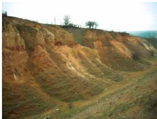
Zdjęcie 7. Czeszmekej – Jar