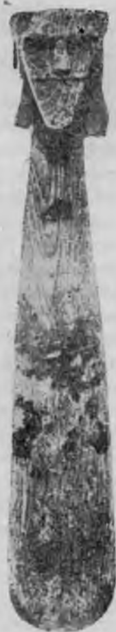
Ryc. 2. Wolin. Miniaturowa figurka czterotwarzowego bóstwa. Według W. Filipowiaka i J. Wojtasika Fig. 2. — Wolin. La statuette de divinité à quatre visages. D'après W. Filipowiak et J. Wojtasik

Znalezienie w 1974 r. w Wolinie 10 w poziomie z IX/X w. miniaturowej drewnianej czterotwarzowej figurki (ryc. 2) ponownie nasunęło skojarzenie tego odkrycia z opisem wyglądu Svantevita.