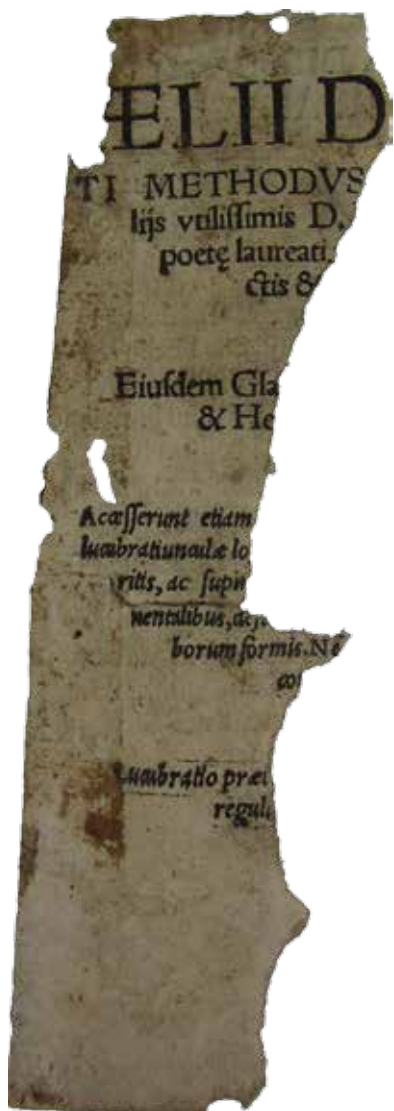
Fot. 4. Aelius Donatus, Methodvs Cvm Scholijs vtilissimis D. Henrici Glareani poetę laureati, [Kraków, Maciej Szarffenberg, 1531], 8°. Fragm. karty tytułowej, sygn. AAGn. PL 491 (dalej: Aelius Donatus, Methodus...).