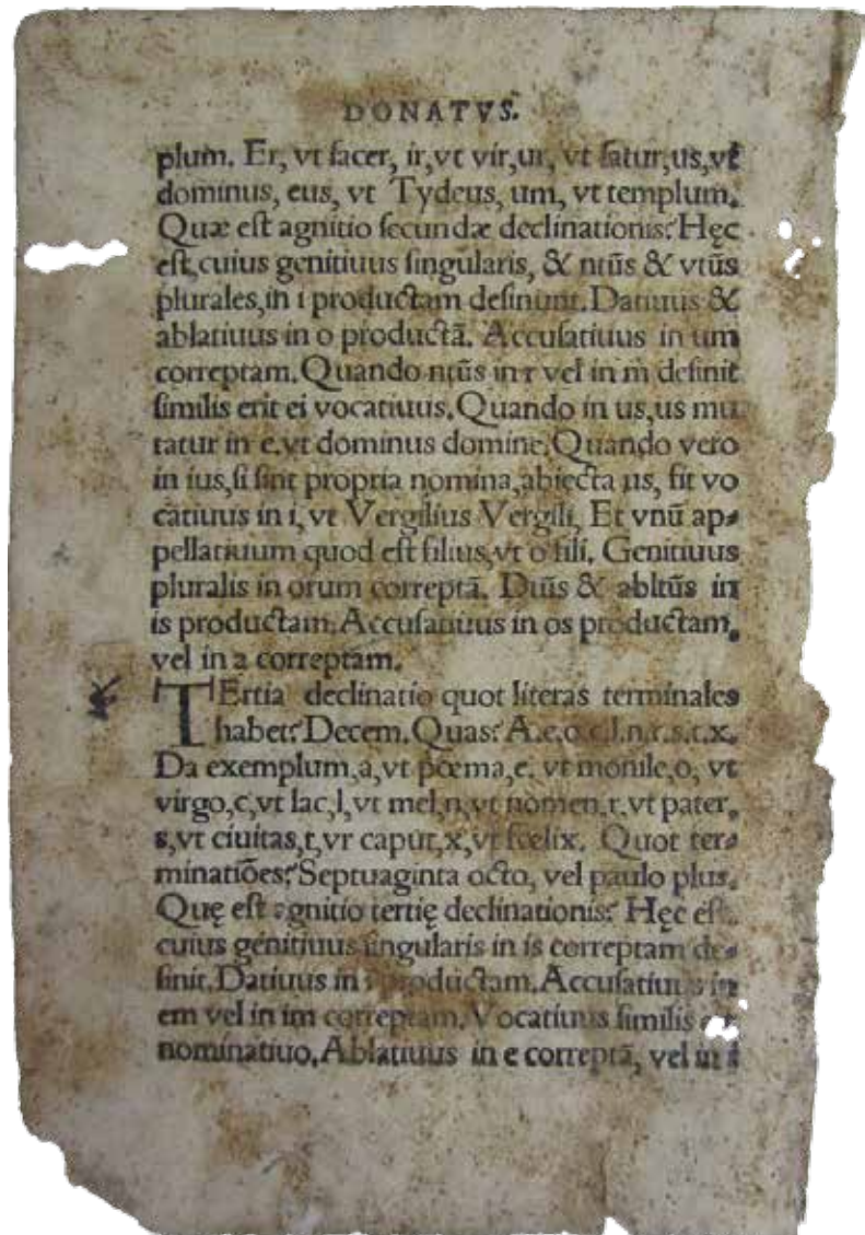
Fot. 7. Aelius Donatus, Methodvs... . Fragm. karty A 4 verso.