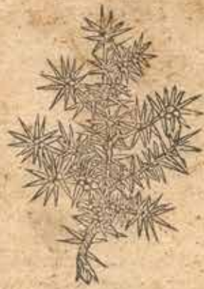
Fot. 9. Stratander Steinensis Christophorus [tłumacz], Olevm Ivniperi, [Kraków, Hieronim Wietor, po 23 II 1545], 8o. Karty: A 1 (tytułowa), A 3 (właściwe A 2 verso), A 3 , A 4 verso, sygn. AAGn. PL 496 (dalej: Olevm Ivniperi... )

OLEVM IV. NIPERI QVA RATIONE omnibus ferē humani corporis egritu- dinibus medeatur, a docto quodā medico conscriptum, & ex germanico in latinū ser- monē versum.