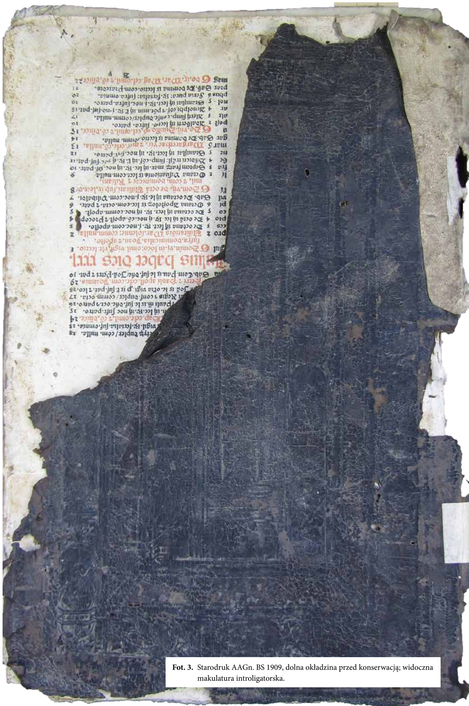
Fot. 3. Starodruk AAGn. BS 1909, dolna okładzina przed konserwacją; widoczna makulatura intrologatorska.