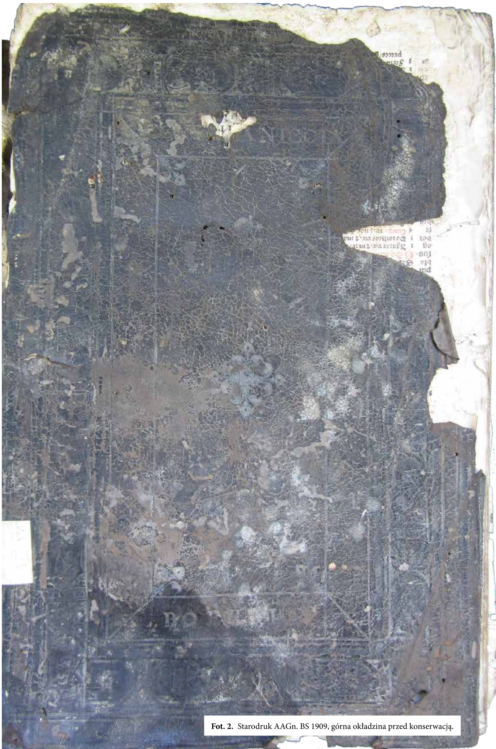
Fot. 2. Starodruk AAGn. BS 1909, górna okładzina przed konserwacją.