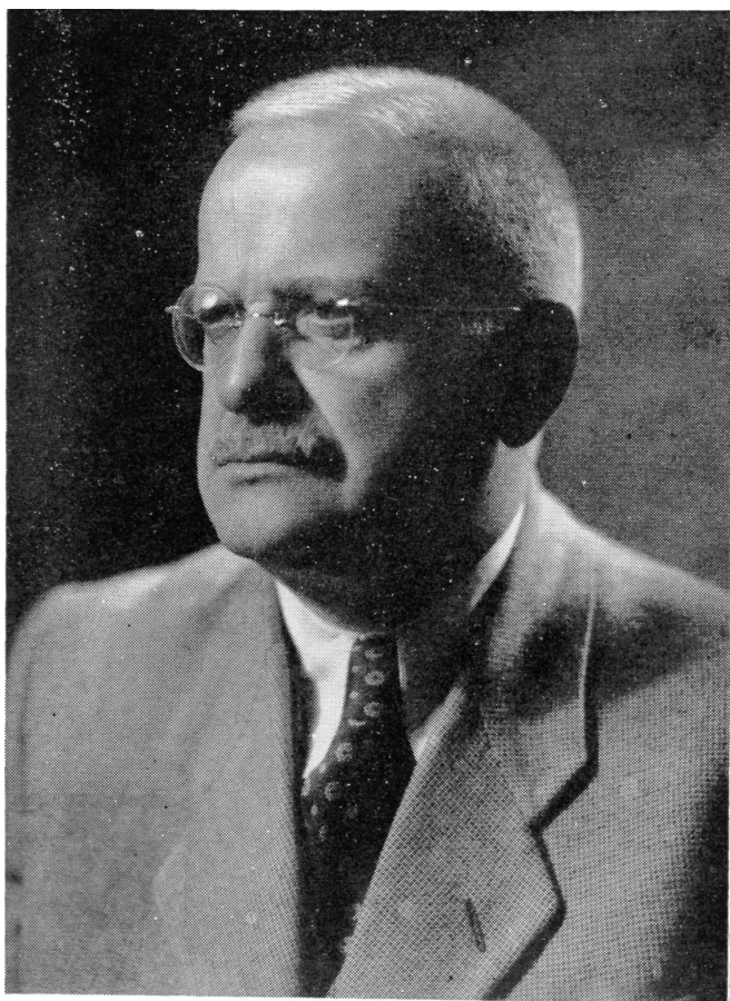
Profesor doktor Czesław Znamierowski